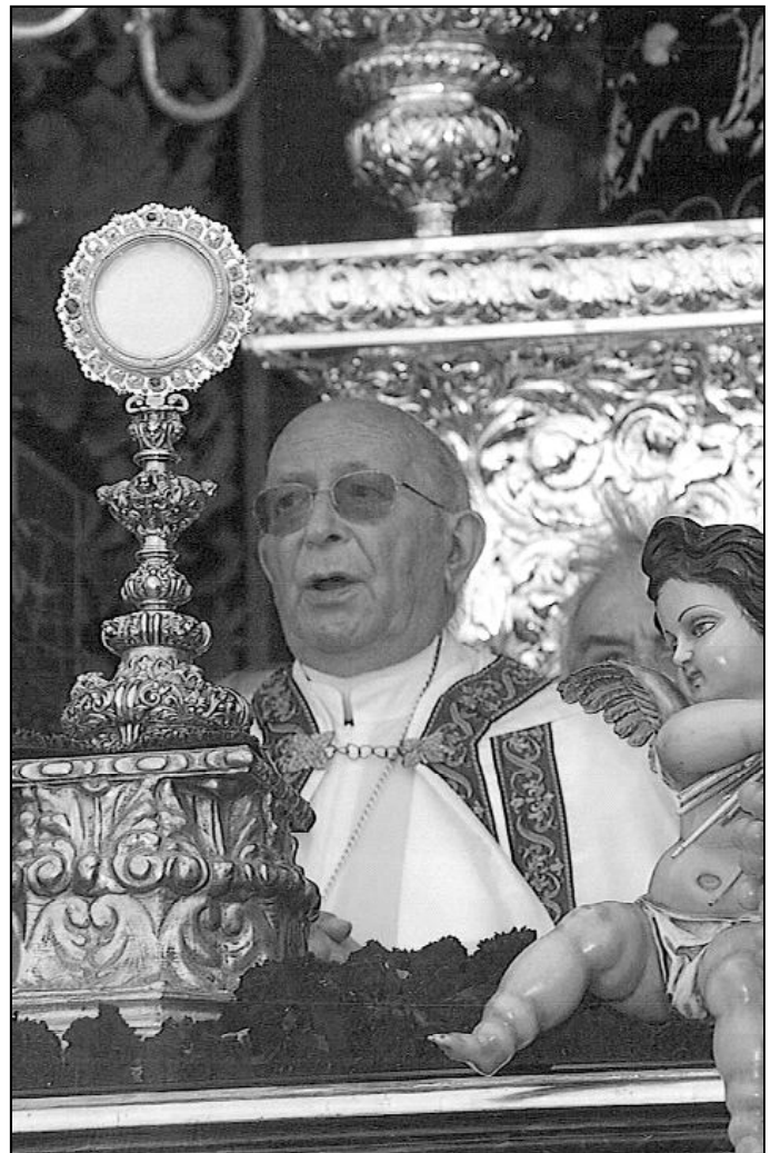
imagen de la procesión del Corpus Christi del año pasado