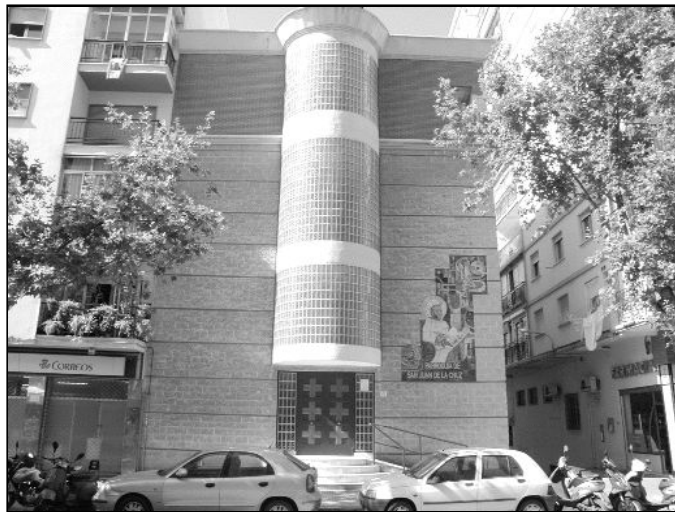
Fachada de la parroquia San Juan de la Cruz, en El Palo

Además se albergan también en este espacio parroquial una imagen de la Inmaculada Concepción y otra del Sagrado Corazón de Jesús, ambas realizadas en vaciados de escayola de Olot.