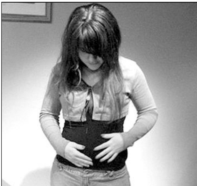
Son muchas y complejas las causas que conducen al aborto

«La falta de un trabajo seguro, legislaciones frecuentemente escasas en materia de protección de la maternidad o la imposibilidad de asegurar un sostenimiento adecuado a los hijos», son impedimentos que, según el Papa, desaniman a los jóvenes a iniciar la vida matrimonial, sofocan «la exigencia del amor fecundo», «abren la puerta a un creciente sentimiento de desconfianza en el