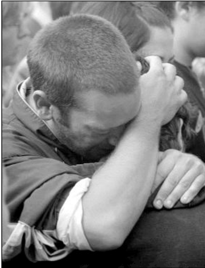
Dios hará lo que Él quiere, ¡y siempre tendrá razón!

Hay muchos momentos en la existencia, en la que serás confrontado con este género de