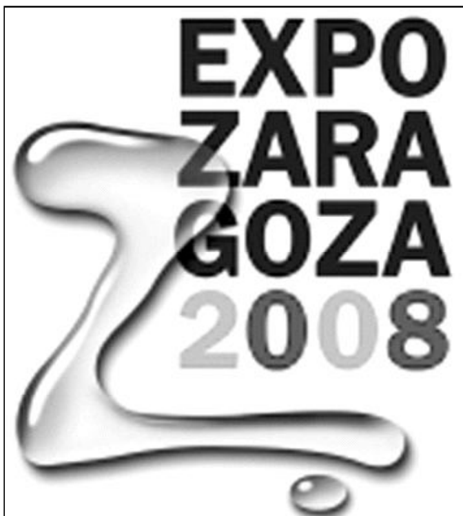
Logo Expo Zaragoza 2008

Monseñor Tomasi recordó las palabras de Benedicto XVI, en