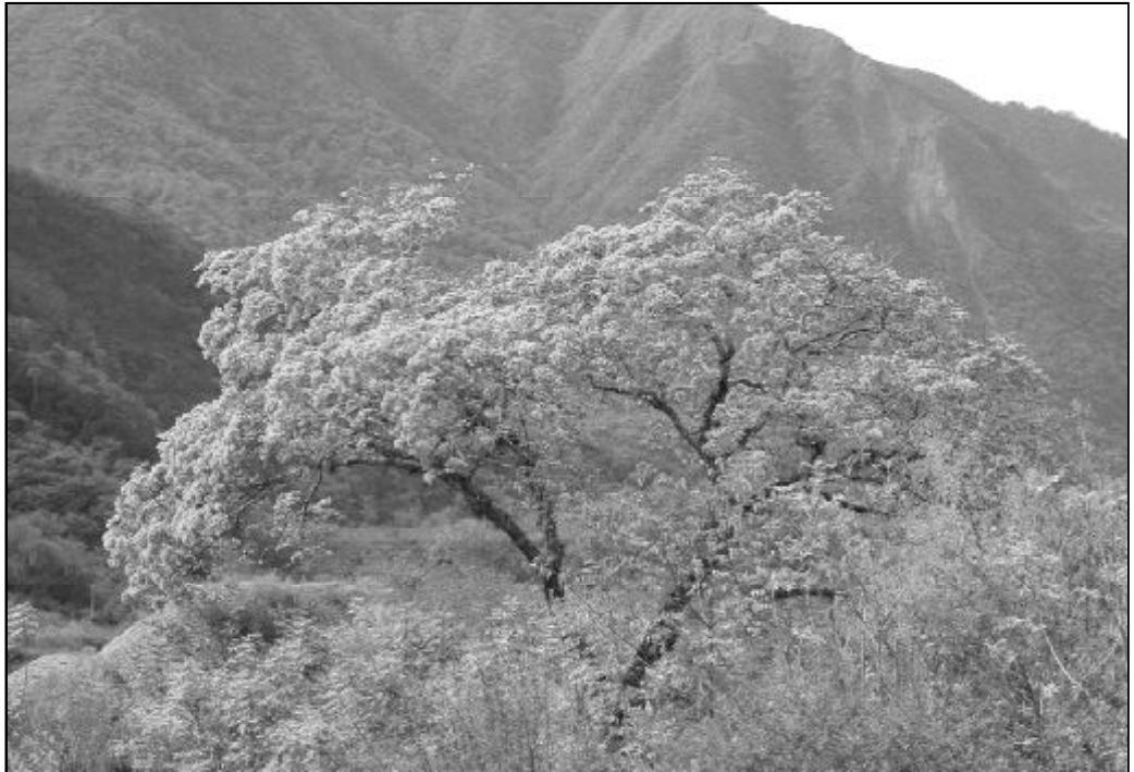
“El invierno ya ha pasado”

La ausencia de los que él ama, sus días que están contados, lo arrojan a los pies de aquél que le dará la fuerza para dejar de llorar, para levantarse y para proseguir su ruta (1 Samuel 30,3-6).