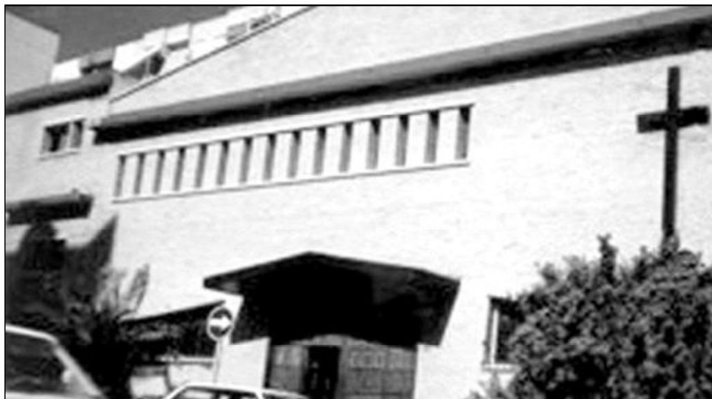
Fachada de la parroquia Santo Ángel

artista para su confección fueron recogidos de la basura: restos de latas, chino de la playa y materiales de deshecho.