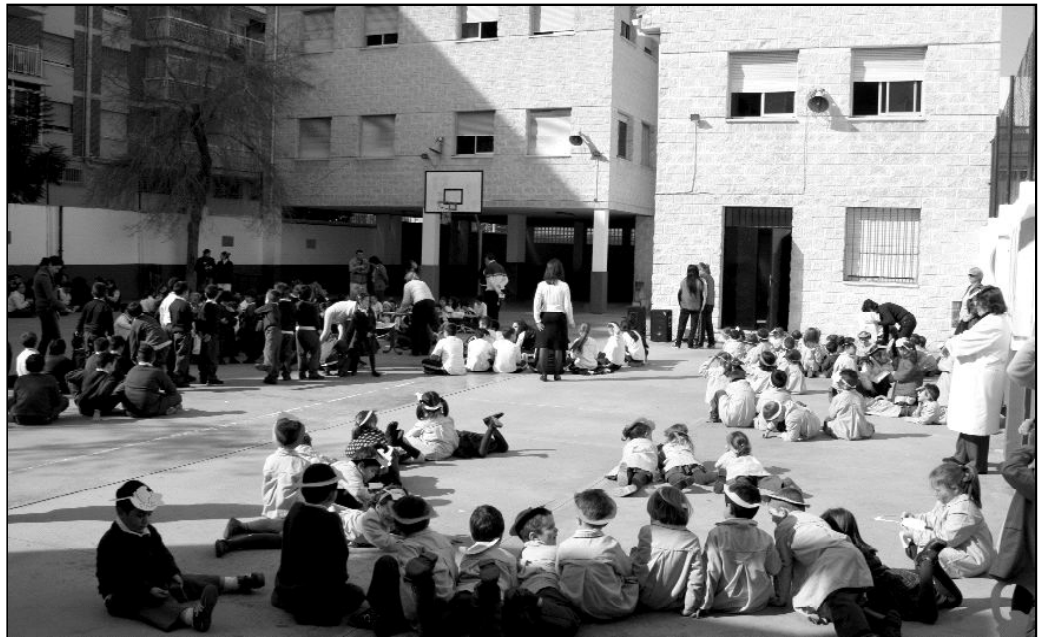
Alumnos del colegio Padre Jacobo realizando una actividad en el patio