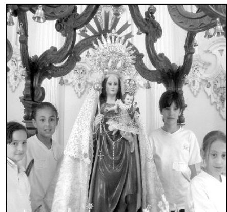
Alumnos junto a la Virgen de Flores

Tanto la parroquia de la Encarnación, con la cesión de las instalaciones, como el ayuntamiento de Álora, con la adecuación y la limpieza de los anexos, pusieron su granito de arena para la mayor brillantez de esta jornada festiva.