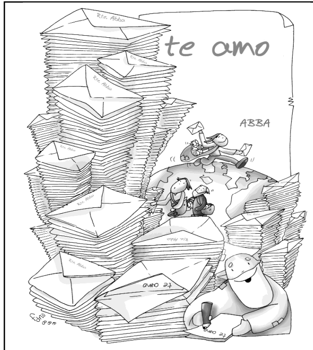
"Hay muchas ovejas y pocos pastores, buena noticia para todos y pocos carteros..."

Alguien escribió, más o menos, esto: El astro rey se ocultaba por el poniente, pero viendo que la tierra se sumergía en la oscuridad preguntó con tristeza: ¿No habrá quien me releve? La humilde lamparilla de barro se le quedó mirando y exclamó: Maestro, aquí estoy, se hará lo que se pueda.