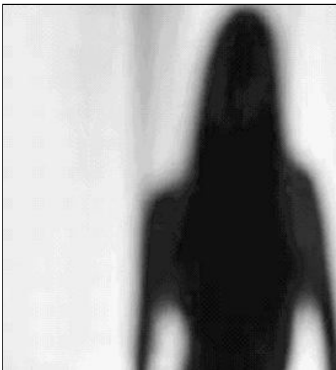
En Roma se ha reflexionado sobre la situación mundial del inmigrante

"Tales situaciones, junto al aumento de la comercialización del sexo y las prácticas sociales y culturales profundamente radicadas de discriminación de las mujeres y niñas, hacen a éstas fáciles presas de los traficantes", añadió. "Como religiosos profundamente arraigados en el Evangelio, estamos impresionados por este fenómeno que causa un sufrimiento enorme a las mujeres y a los niños".