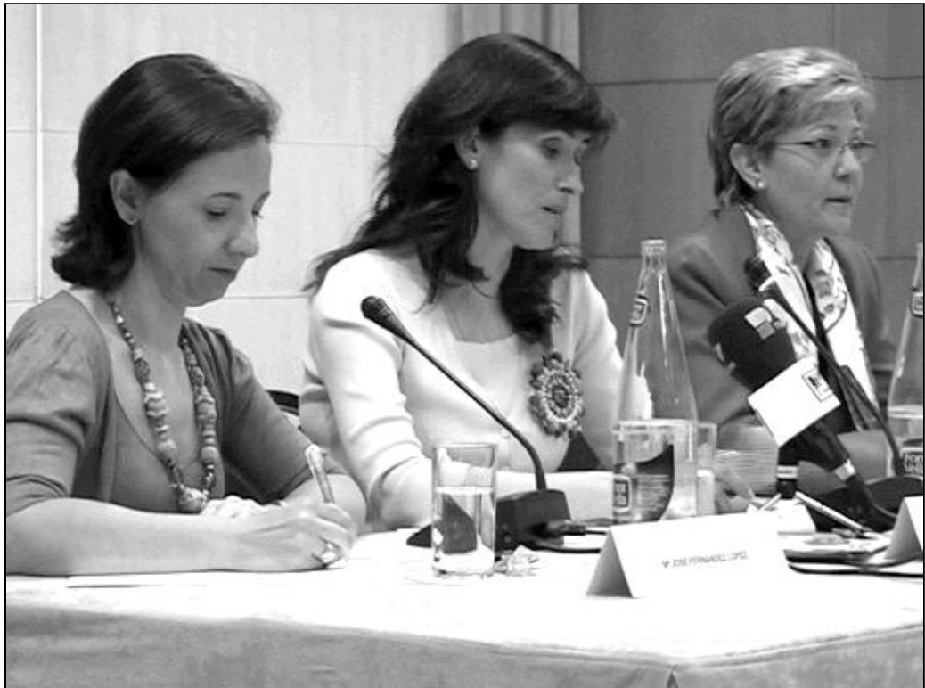
Responsables de Red Madre en la rueda de prensa de presentación de la asociación en Málaga