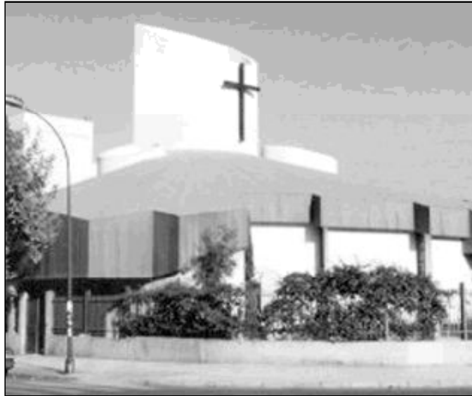
Fachada del templo parroquial Santa María Goretti

la de la izquierda, con el sagrario a sus pies; la central con el presbiterio, y la derecha, con la pila bautismal.