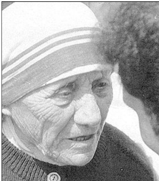
El proceso de beatificación de Teresa de Calcuta sigue abierto

Nada más arrancar, con el primer capítulo te zambulles de lleno en una experiencia religiosa que muchos ignorábamos. Jesucristo es lo más importante para esta religiosa, premio Nobel de la Paz. Es su única razón de existir. Además, de las páginas del volumen emerge con una fuerza inusitada la