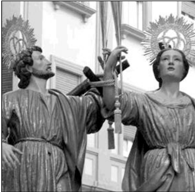
San Ciriaco y Santa Paula, patronos de Málaga

Málaga cuenta en sus anales con un ejemplo de fortaleza frente a propuestas de vida cómoda,