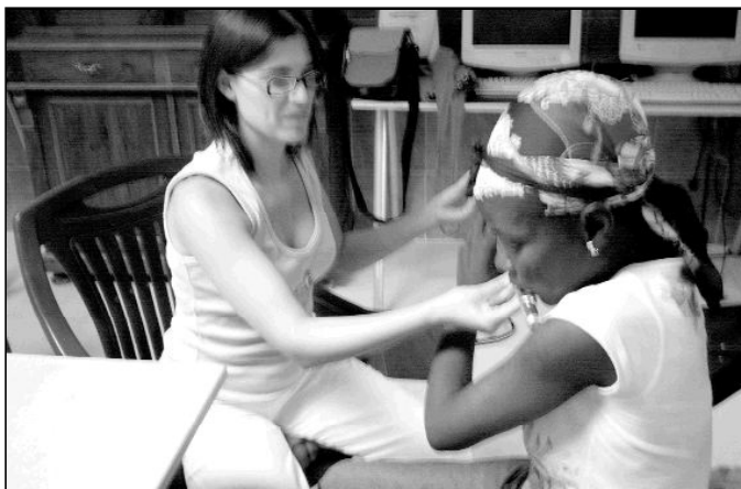
Participantes en el campo de trabajo de Colichet