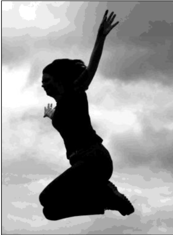
¿Somos realmente libres?

Siglos antes, un gran número de judíos creían que Jesús iba