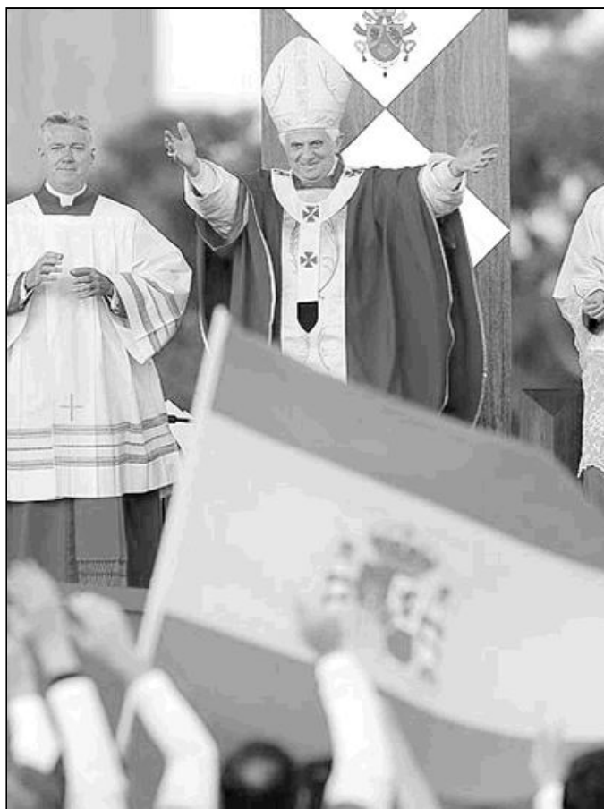
Madrid albergará la Jornada Mundial de la Juventud de 2011

Por su parte, Benedicto XVI ha afirmado, a lo largo de las