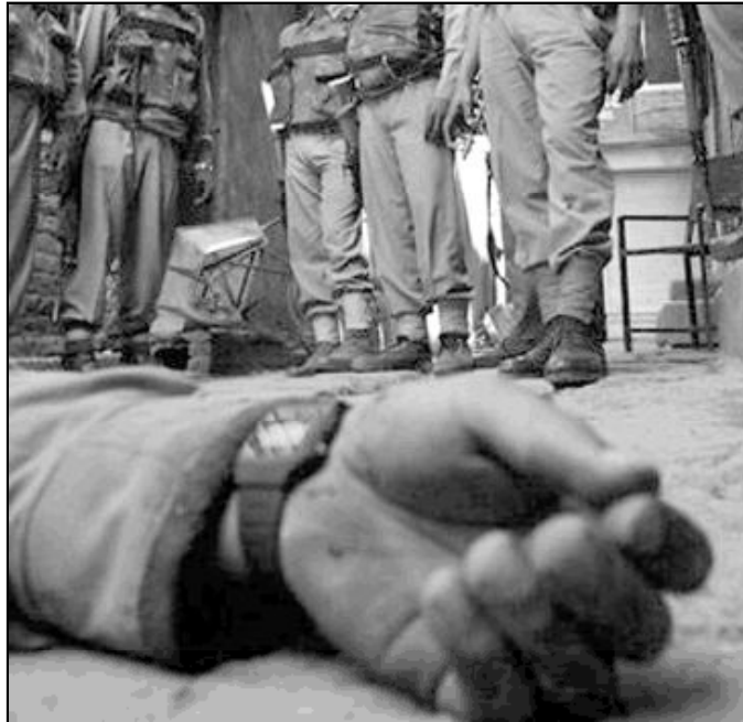
Los extremistas hindúes acusan a los cristianos de evangelizar a los pobres

Así mismo, ha manifestado su "solidaridad a las Iglesias locales y a las congregaciones religiosas" que han sufrido ataques, al tiempo que denunció este tipo de acciones que "hieren la dignidad y la libertad de las personas y comprometen la pacífica convivencia civil". Al mismo tiempo, hizo un llamamiento a todos para que, "con sentido de responsabilidad", se ponga fin a la violencia y se "reconstruya un clima de diálogo y respeto mutuo". La escalada de violencia contra los cristianos empezó a manifestarse cuando fundamentalistas hindúes perpetraron varios ataques e incendios contra iglesias, centros sociales y asistenciales católicos e incluso viviendas de simples creyentes bajo el lema 'Matad a los