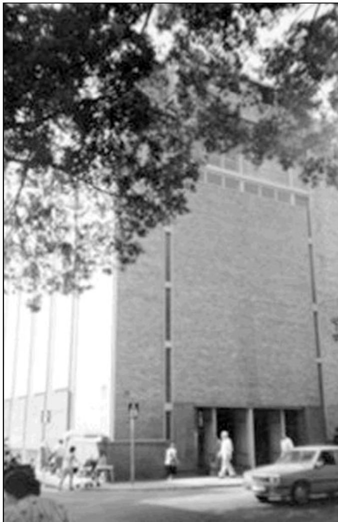
Fachada de la parroquia Stella Maris

La parroquia tiene distintas actividades en su tarea pastoral y evangelizadora, como pueden ser los grupos de oración existentes, las reuniones de formación O.S.C.D.; las catequesis a los distintos niveles: comunión, perseverancia, confirmación y de adultos; el grupo de Cáritas, con su atención al público y sus reuniones formativas; las reuniones para aprender a leer la Biblia; el grupo de Liturgia. Dentro de la catequesis para adultos, se tienen unas catequesis de cara a la actualización cristiana de la vida. También la exposición del Santísimo que cada jueves se realiza por las tardes. Y no podemos pasar por alto la celebración, en el último día del año, de la vigilia para recibir el año nuevo