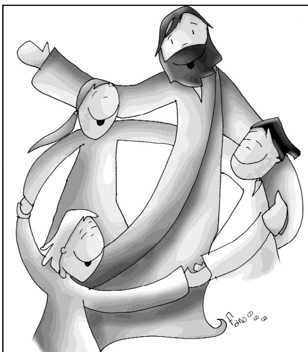
"Ahí estoy yo, en medio de ellos"

experiencia de la vida la que nos enseña en qué momento el otro es capaz de asumir lo que le decimos, y en cuál es aconsejable callar y esperar.