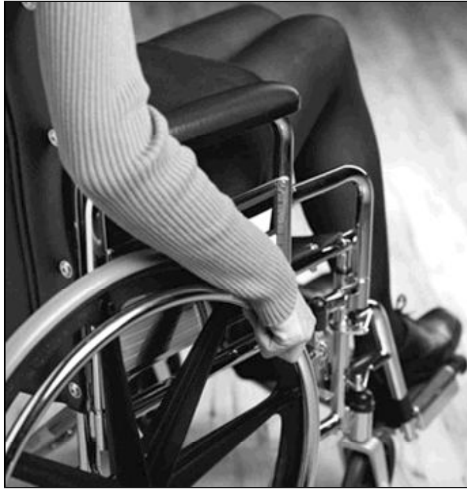
Nuestras comunidades, ¿saben acoger, imitar y apoyar este esfuerzo?

Desde siempre, numerosas personas con discapacidad han tratado de mantener la mayor autonomía posible. Pero ha sido en los últimos años cuando el esfuerzo personal se ha convertido en un esfuerzo compartido y en un clamor social. Tal vez, porque los accidentes de todo tipo, el progreso de la medicina y una nueva sensibilidad social han acrecentado el número de personas con discapacidad que quieren mejor calidad de vida, más autonomía y una buena integración laboral. Para hacerse una idea, las personas con discapacidades graves