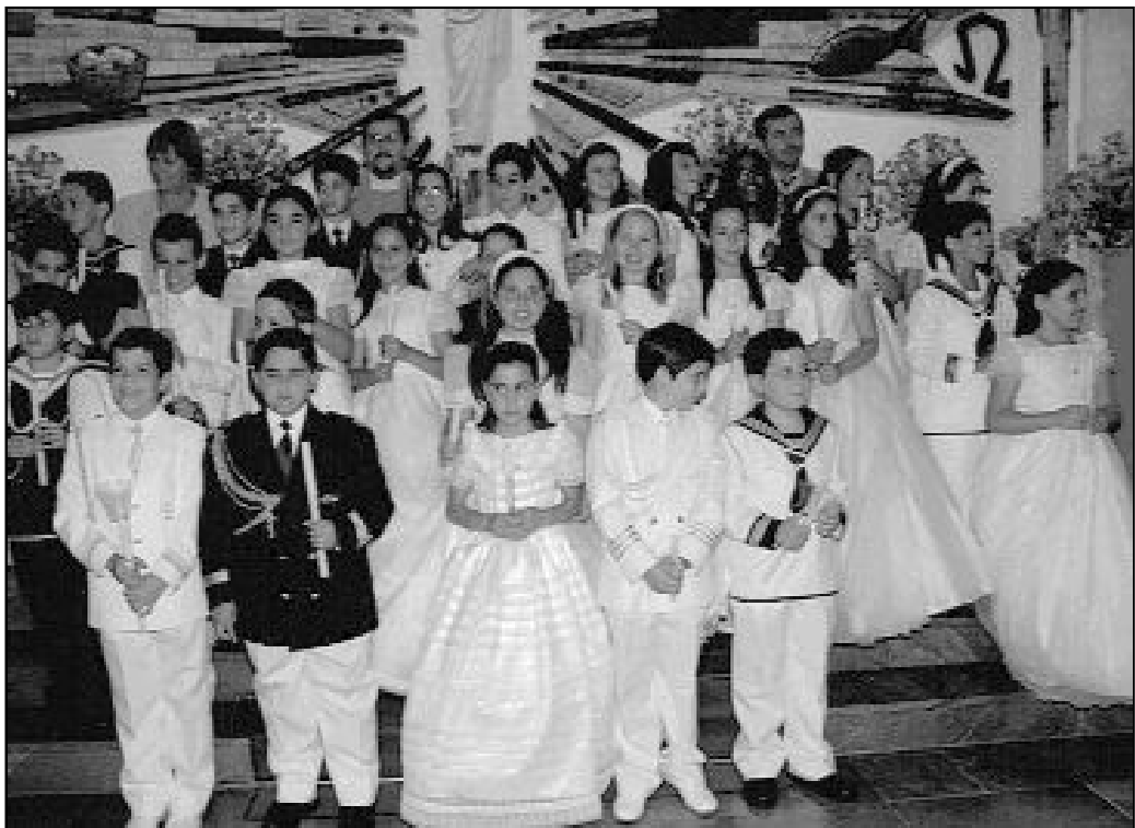
La parroquia San Manuel, en Mijas-Costa, es la de mayor número de celebraciones de la Primera Comunión