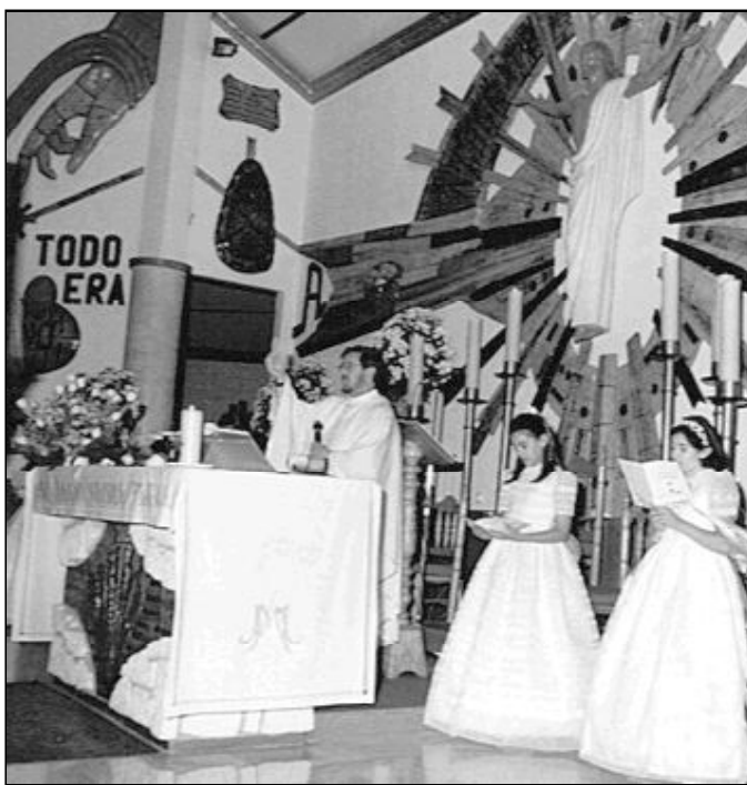
Primera Comunión en la parroquia San Manuel, Mijas-Costa

–No voy a dar una cifra, pues la respuesta es muy compleja. En la parroquia tenemos catequesis de perseverancia con un número de niños que siempre nos parecerá muy pequeño, aunque es muy considerable, teniendo en cuenta tantas actividades deportivas y desplazamientos familiares que se producen los fines de semana. Nuestro deseo es soñar con la utopía del cien por cien. Pero aquí nos encontramos con la raíz profunda de toda Iniciación Cristiana en la infancia: el apoyo y el testimonio