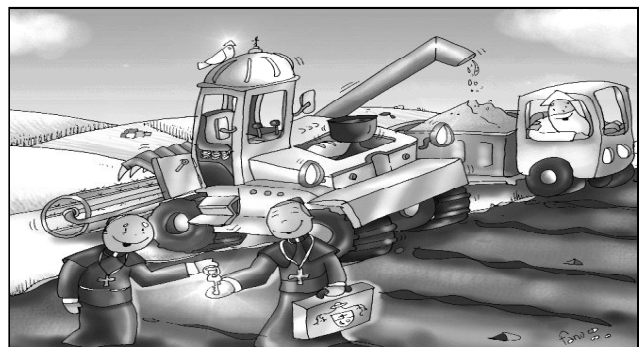
"Bendito el que viene al servicio del Señor"