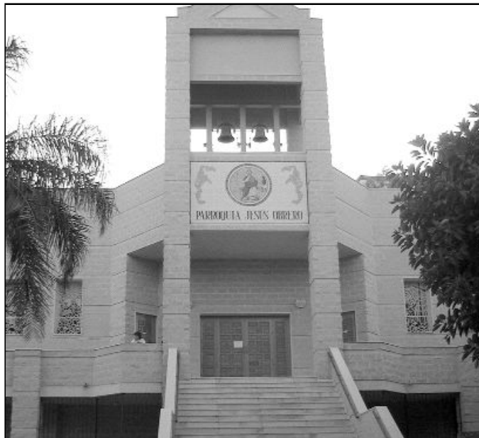
Fachada del templo parroquial Jesús Obrero

La parroquia funcionó en un primer momento en un salón del Colegio 26 de Febrero. En 1973 se trasladó a una nave prefabricada, en tanto se construía el