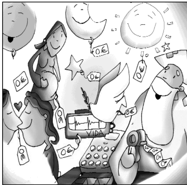
"Lo que nace de Dios es gratuito"

que se reconozca a Dios como único Señor, porque es en lo más hondo del ser humano donde Dios ha dejado su imagen. El ser humano es imagen de Dios, desde el comienzo de la creación. Puede que en este juego de palabras entre la imagen de la moneda - del César - y la imagen de Dios - dentro del hombre - radique la grandeza, lo inesperado, a la vez que profunda respuesta de Jesús.