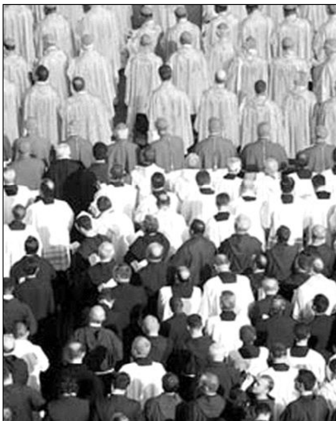
253 prelados de los cinco continentes están participando en el Sínodo

"Al final, el punto de llegada es que el hombre se encuentra