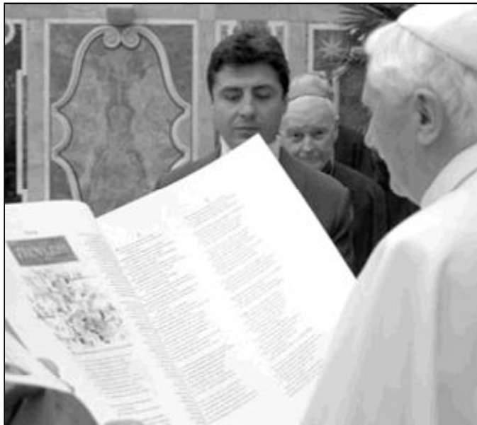
El Papa, en la inauguración del Sínodo de los Obispos

El 5 de octubre, Benedicto XVI inauguró en la Basílica de San Pablo Extramuros el Sínodo de los Obispos sobre "la Palabra de Dios en la vida y en la misión de la Iglesia", que se clausura hoy, 26 de octubre. En la homilía, el Papa pedía al Señor que "nos permita acercarnos con fe a la doble mesa de la Palabra y del Cuerpo y la Sangre de Cristo. Que nos alcance este don María Santísima, 'quien guardaba todas estas cosas, y las meditaba en su corazón'. Que ella nos enseñe a escuchar las Escrituras y a meditarlas en un proceso interior de maduración, que nunca separe la inteligencia del corazón".