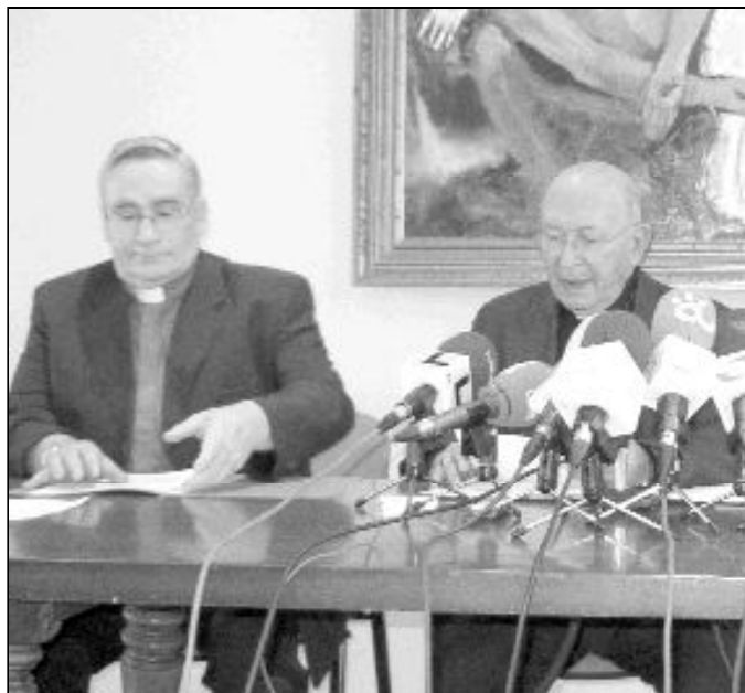
El Vicario General y el Obispo Administrador Apostólico de la diócesis en la rueda de prensa del 10 de octubre