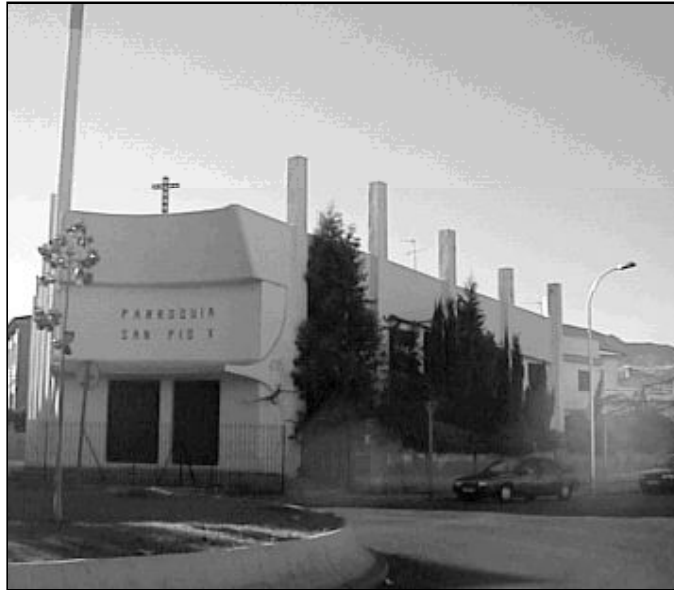
Fachada del templo parroquial San Pío X

Las Hermanitas de Jesús llegan al barrio en 1973. Vinieron con