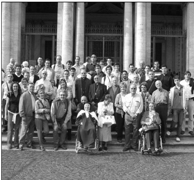
Peregrinos de la diócesis en la beatificación de los 498 mártires en Roma

Como Duarte, muchos hombres y mujeres fueron al martirio. Eran personas normales, sencillas,