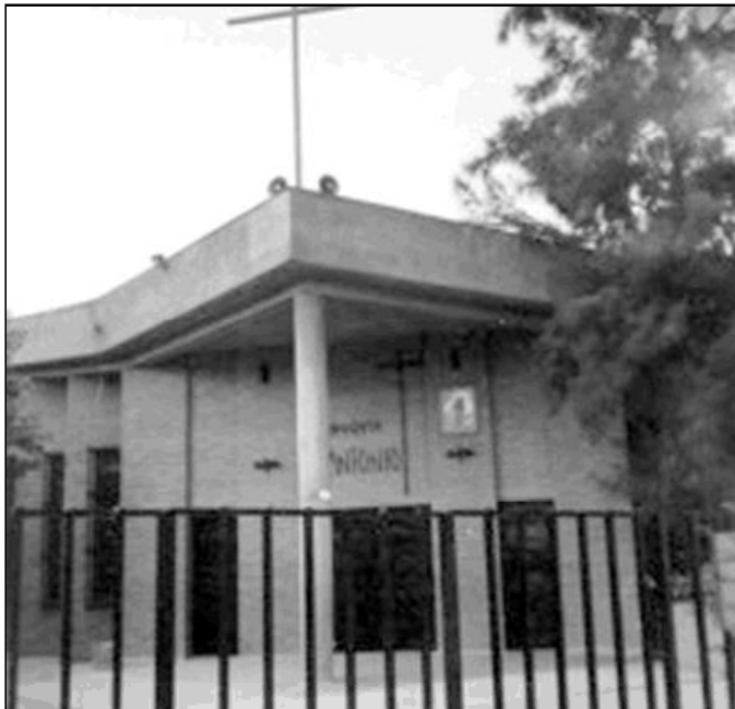
Fachada del templo parroquial San Antonio de Padua

La parroquia estaba destinada de una manera prioritaria a los obreros de la construcción, pescadores, portuarios, parados, loteros, pequeños comerciantes, vendedores y empleados en la textil.