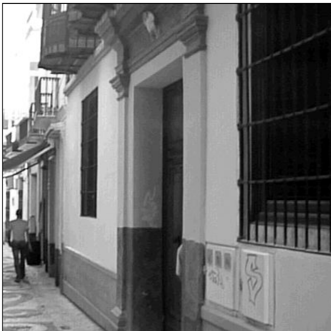
Fachada de la sede de Cáritas en Málaga, en calle Fresca

Cáritas de España constató que ya en el primer semestre de 2008 había aumentado la demanda de ayuda en un 40 por ciento con respecto al mismo periodo de 2007, debido a la crisis económica, notándose especialmente en las partidas destinadas a familia, acogida, inmigrantes y empleo, y prevén que en el segundo semestre "las cifras aumenten". En un avance de urgencia presentado por Cáritas, el secretario general, Silvano Agea, destacó que mientras que en todo el 2007 el total de demandas ascendieron a 142.746, ya en el primer trimestre se han alcanzado las 100.471 peticiones o consultas. Por tipos de demanda, Agea indicó que "aumentan significativamente" la solicitud de ayudas para vivienda y para búsqueda de empleo. Aunque destacó el aumento, que incluso en 2007 se comenzó a notar, de la petición de ayuda para acogida, atención primaria y acción de base. En este sentido, Agea apuntó que debido a la crisis