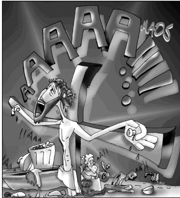
"Dando un fuerte grito, entregó el espíritu"

VIDA O LA NO VIDA. Pero los cristianos, en el día de hoy, celebramos la vida. Cristo ha dado la vida para que nosotros podamos gozar el placer de la vida. Lo ha hecho gracias a la Cruz. El había lanzado un desafío inusual: "¿Dónde está muerte tu victoria?" para responder: "Yo seré, muerte, tu victoria". O también, "Muerte, seré tu muerte". En esta conmemoración de Todos los Fieles Difuntos, los creyentes expresamos y celebramos que la existencia cristiana o está ilumina-