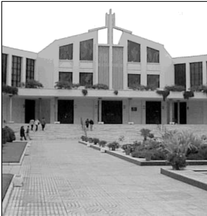
Imagen de la capilla del Cementerio de San Gabriel

La hija de esta familia afirma que su madre ha sido todo un ejemplo para ella y para sus hermanos, y su padre ha sido el eterno acompañante. En palabras de esta joven, que ha sido una gran colaboradora en el buen funcionamiento del hogar, "en nuestra familia la muerte, gracias a Dios, ha llegado cuando ya estábamos preparados para afrontarla. Han muerto como todos queríamos, en sus camas y a nuestro lado. Pero la verdad es que requerían tanta dedicación que sus pérdidas han dejado un vacío enorme. Sin