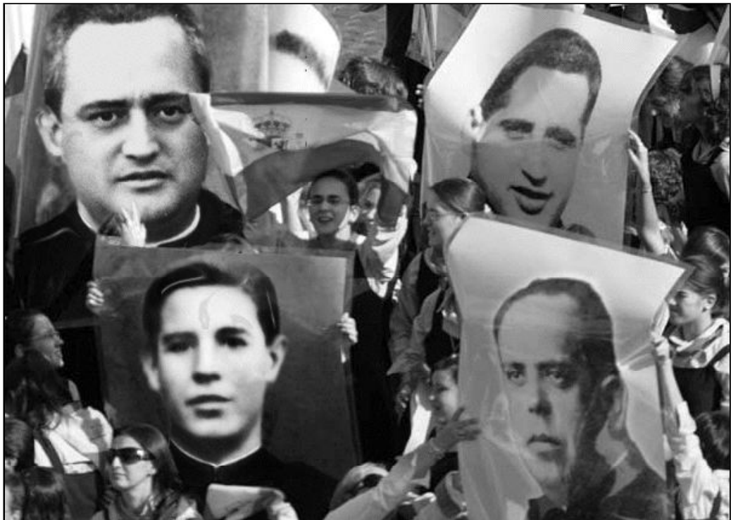
Muchos malagueños acudieron a la ceremonia de beatificación que se celebró en Roma en octubre de 2007

Tenemos la certeza de que aquellos que murieron en la persecución religiosa de los años 30 gozan ya de la inenarrable visión del rostro de Dios. Sus muertes, perdonando a sus verdugos, nos siguen sorprendiendo y nos interrogan sobre el sentido que damos a la palabra "fraternidad" y la madurez de nuestra coherencia en la fe. A ellos miramos en la cercanía de la fiesta de todos los santos.