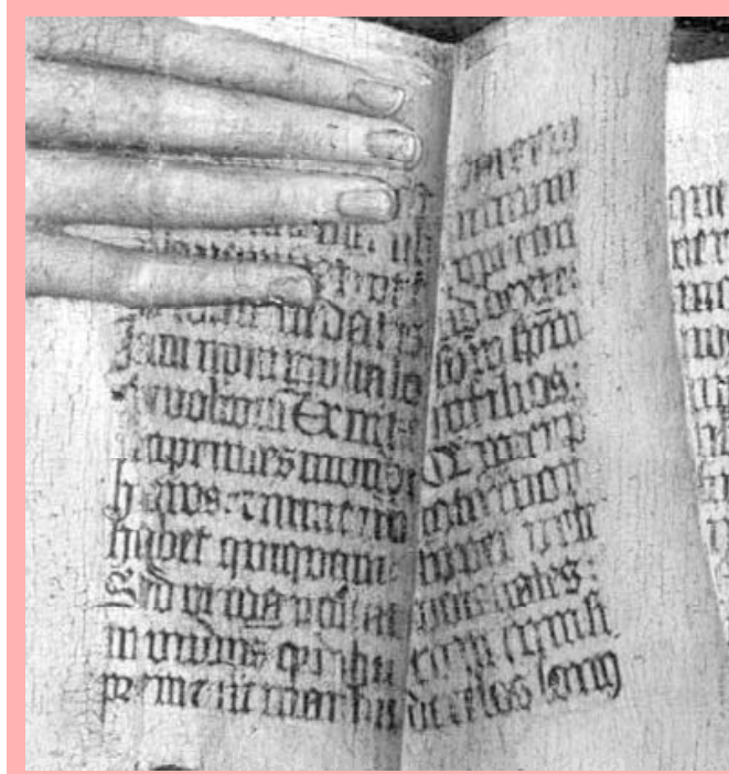
Este año nos invitan, de forma especial, a acercarnos a los textos de san

Además, tenemos las cartas escritas por sus discípulos, las llamadas cartas deuteropaulinas. En ellas, algunos de sus discípulos recogen y transmiten las ense-