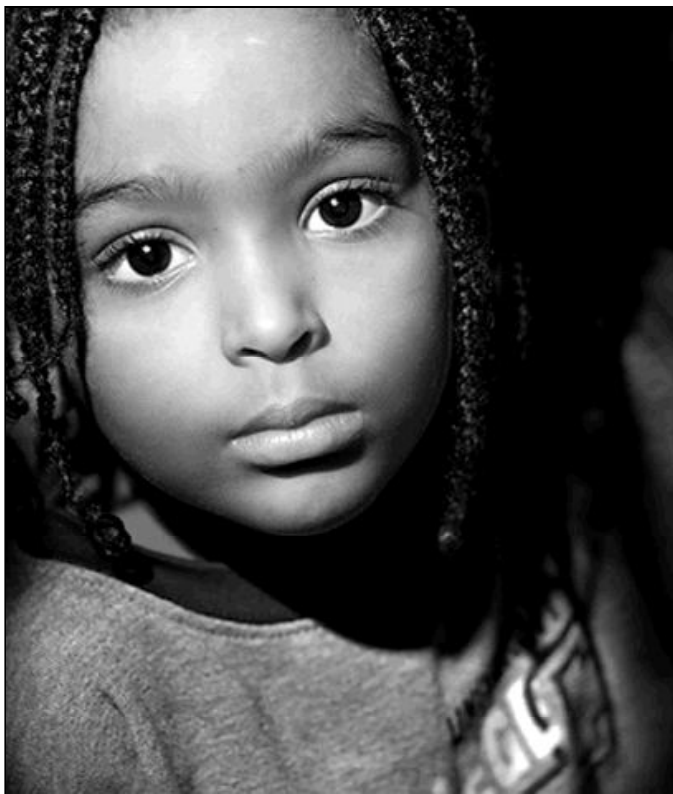
Los menores se enfrentan a abusos extremos

Pero los menores no son los únicos que se enfrentan a abusos extremos en el este de la República Democrática del Congo. Los grupos armados y las fuerzas gubernamentales siguen violando a mujeres y niñas. Entre las víctimas —a algunas de las cuales las violan grupos enteros de hombres—