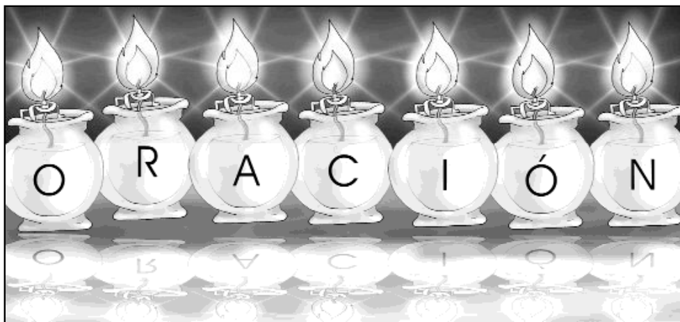
"Mantengamos la luz encendida"