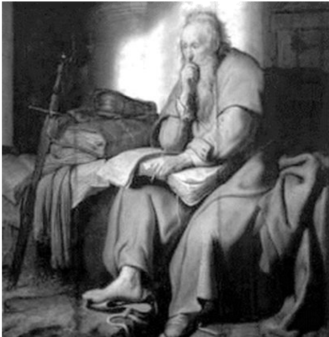
"San Pablo" por Rembrandt

El texto resalta el papel de Ananías, que por mandato del Señor, a pesar de sus reticencias