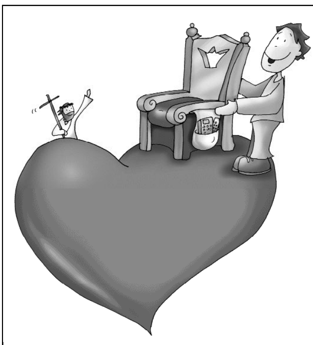
CRISTO REY. “Cede a Jesús el Trono de tu Corazón”

(Namao, Canadá, 1995). La opción preferencial por los pobres más que una moda pasajera, es la mejor reformulación actual de la enseñanza de Mateo. Si nos adentramos por esta reflexión la perplejidad nos arranca la tremenda pregunta que es autoinculpación: ¿Cuándo te vimos en la indigencia y no te socorrimos? Sabemos la respuesta: “si lo hacéis con uno de estos mis pequeños, conmigo lo hacéis”. Lo expresaba Benedicto XVI en su Encíclica “Deus caritas est”: “se ha de recordar de