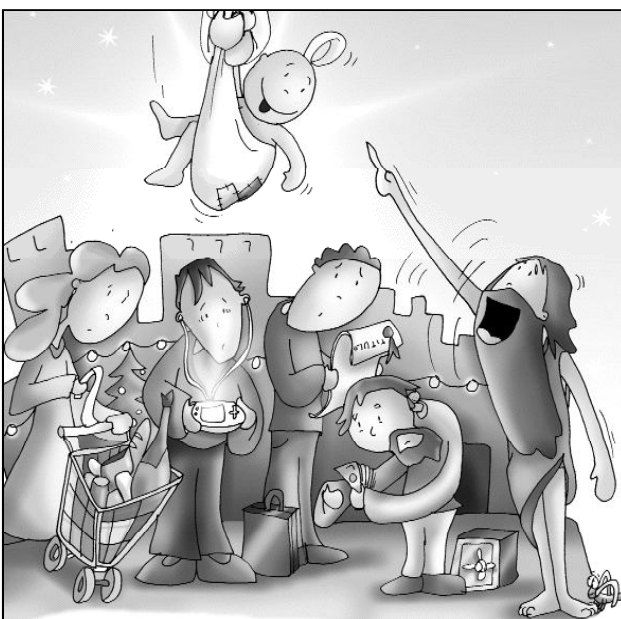
"Voz que clama en el desierto"

"¿Tú quién eres...?", le preguntan... le piden algo así como su carnet de identidad Juan se define por la misión que ha recibido: Es el precursor, el que corre abriendo camino. No es el Mesías, pero sí su pregonero... No es el novio, pero sí su amigo... No es la Palabra, pero sí una voz... No es quien esperaban, pero sí quien confirma las esperanzas de los que esperaban..."