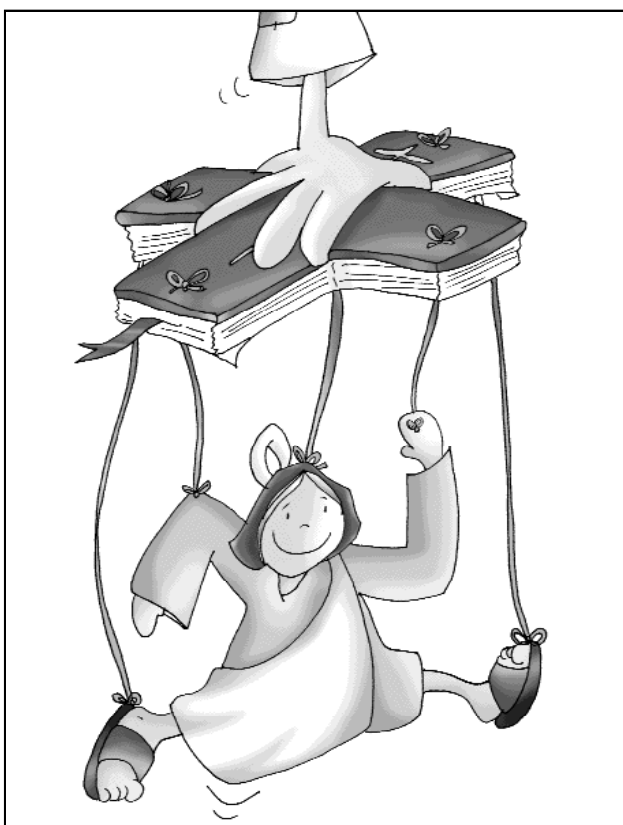
"Hágase en mí según tu Palabra"

nos agarramos a María que nos enseña a vivir la entrega libre (LIBERTAD) y el servicio generoso a Dios y a los demás... (El que no vive para servir, no sirve para vivir) (Necesitamos agarrarnos... porque vacilamos con facilidad...).