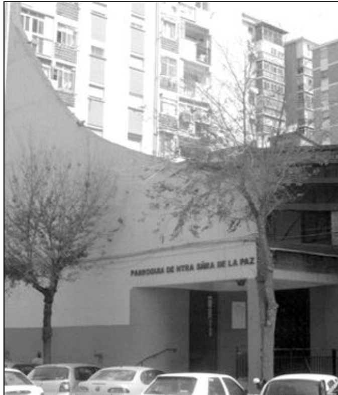
Fachada del templo parroquial Nuestra Señora de la Paz, en calle Goya

La parroquia está dedicada a la Virgen de la Paz. Esta devoción está muy arraigada en todo el barrio e incluso en otras zonas de Málaga. Con motivo de su fiesta, en enero se celebra un solemne triduo y la Eucaristía, y se invita a toda la capital para celebrar una jornada por la paz.