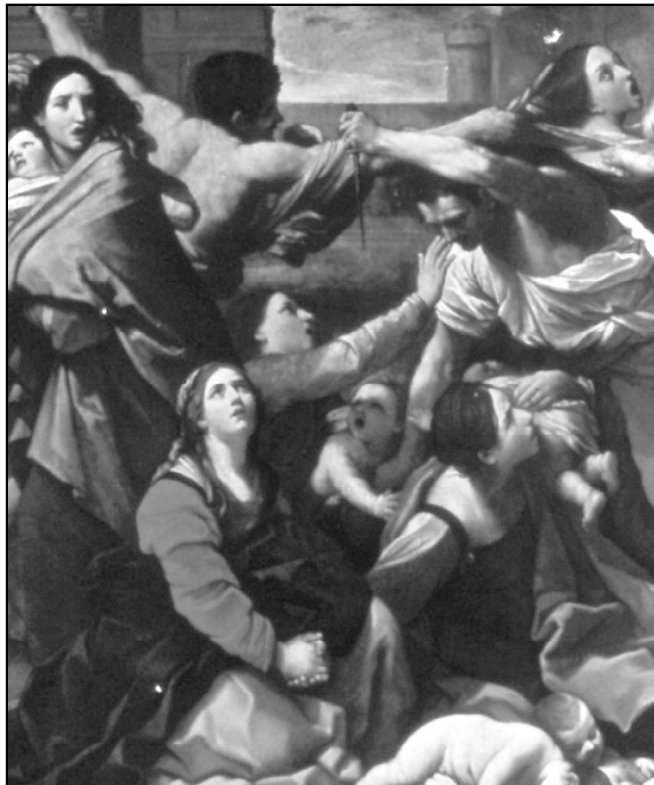
La matanza de los inocentes

El ser humano es una singularidad en medio de la naturaleza. Un individuo-persona irreductible al anonimato; imposible de diluir en la inmensidad del género. No hay crimen sin algún razonamiento ciego que lo quiera justificar. Cuando Herodes llevó a cabo la matanza de los inocentes —que hoy conmemoramos—, trató de evitar que alguien le arrebatara el