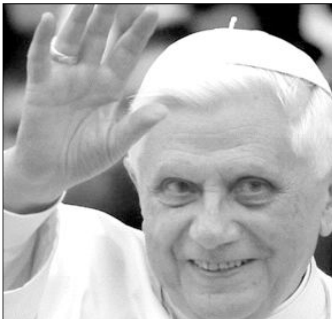
El Papa acaba de publicar su mensaje para la Jornada Mundial de la Paz

Benedicto XVI presidirá las tradicionales celebraciones de