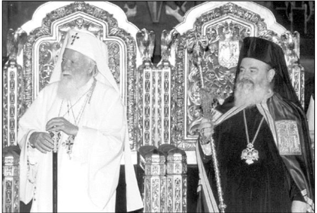
Representantes católicos y ortodoxos se reúnen en un foro de diálogo

En él han dialogado y llegado a consensos sobre cuestiones morales y sociales, entre ellas el papel de la familia, además de ratificar lo cercanas que están ambas doctrinas y manifestar preocupaciones muy similares, según informa Europa Press.