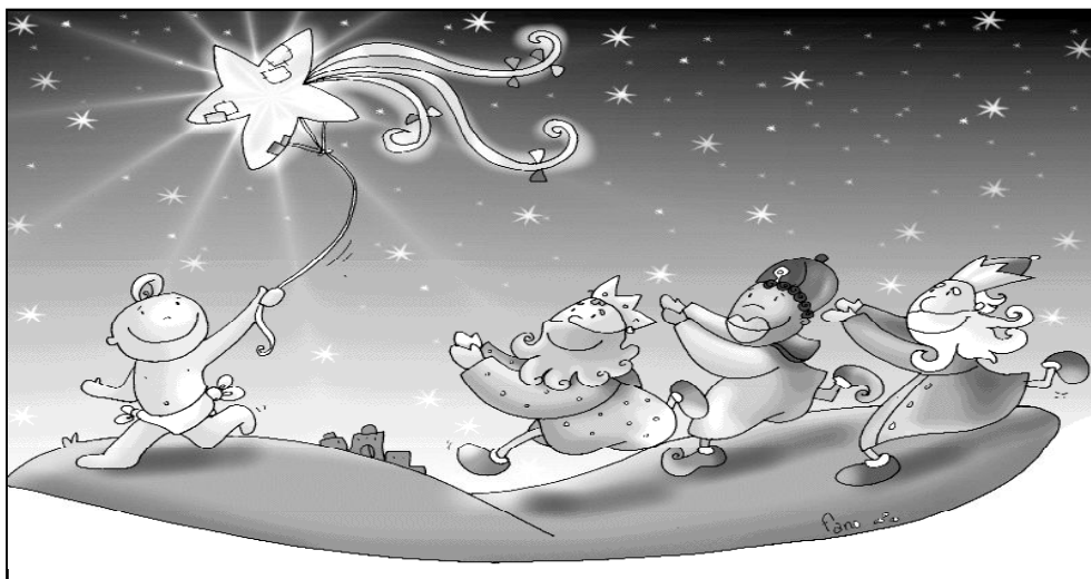
"Seguid la estrella, os llevará a Jesús"