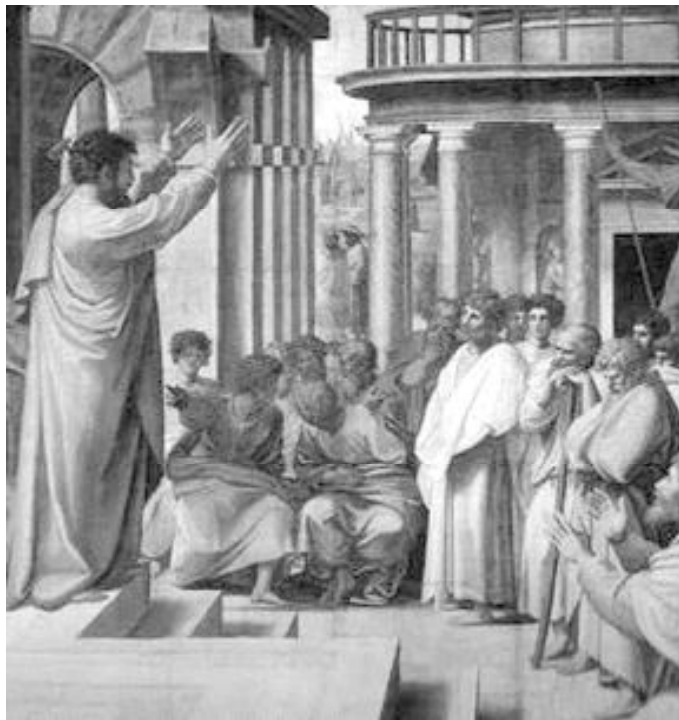
San Pablo, de perseguidor a predicador

En este contexto plural surgieron los primeros cristianos, a quienes llamaban los «nazarenos», como un grupo más dentro del judaísmo. Los distinguía su fe en Jesús, muerto y resucitado, a quien Dios ha constituido Señor, Mesías e Hijo de Dios.