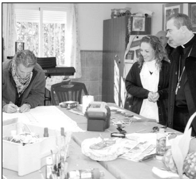
Uno de los acogidos en la casa le muestra los trabajos que allí realizan.