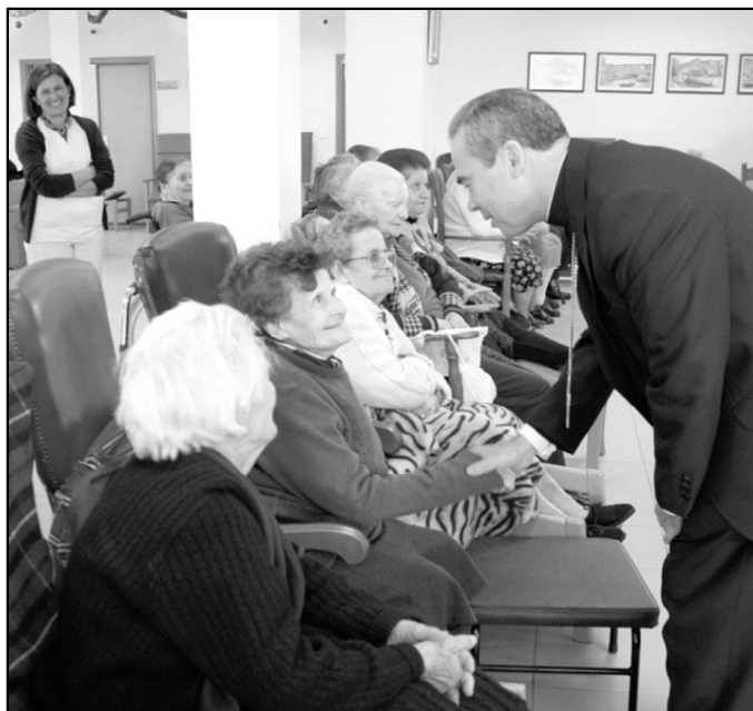
El Sr. Obispo saluda a los residentes en su primera visita a la Residencia "El Buen Samaritano", el pasado 18 de diciembre.