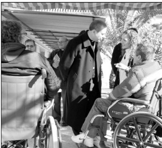
Ese mismo día también visitó la casa "Colichet", para enfermos de sida.