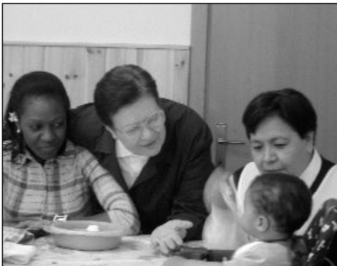
La Iglesia cuenta con más de 1.000 centros asistenciales

La Iglesia es la entidad que genera más empleo después de la Administración Pública. Sólo Cáritas, a través de sus acciones de empleo, generó durante el año 2007 más de 14.000 puestos de trabajo; en sus cursos de formación participó un 73% de mujeres, casi el triple que de hombres, y una mayoría de jóvenes e inmigrantes. Según las estadísticas de la Conferencia Episcopal Española, la Iglesia cuenta con unos 4.300 centros educativos (guarderías, Primaria, Secundaria, universidades), que producen miles de contratos anuales, tanto temporales como indefinidos. En cuanto a los servicios asistenciales, la Iglesia cuenta con 858 residencias, que atienden a unos 70.000 ancianos y dan trabajo a unos 10.000 profesionales; 191 orfanatos que emplean a unos 2.000 trabajadores, y unos 150 centros de atención sanitaria (hospitales, ambulatorios, dispensarios) que gene-