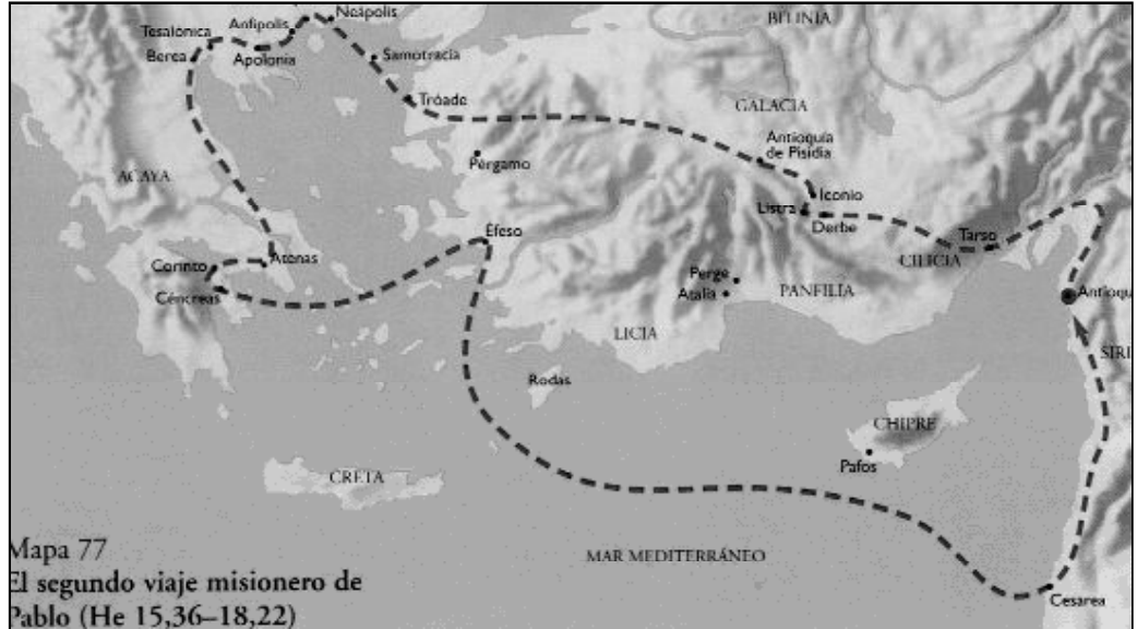
Mapa 77 El segundo viaje misionero de Pablo (He 15,36-18,22)

Pablo y Bernabé decidieron visitar las comunidades fundadas durante su primer viaje misionero para ver como seguían y alentarlas. Con ese objetivo emprendieron un segundo viaje misionero, que probablemente se desarrolló del año 49 al 52. En la preparación del viaje tuvieron una fuerte discusión Pablo y Bernabé, porque éste quería que les acompañara su sobrino Juan Marcos, que los había abandonado a mitad del viaje anterior. Pablo no cedió a la petición de Bernabé y acordaron dividirse las comunidades y visitarlas por separado. Bernabé con Juan Marcos partirían para Chipre, mientras que Pablo se iría a Anatolia.