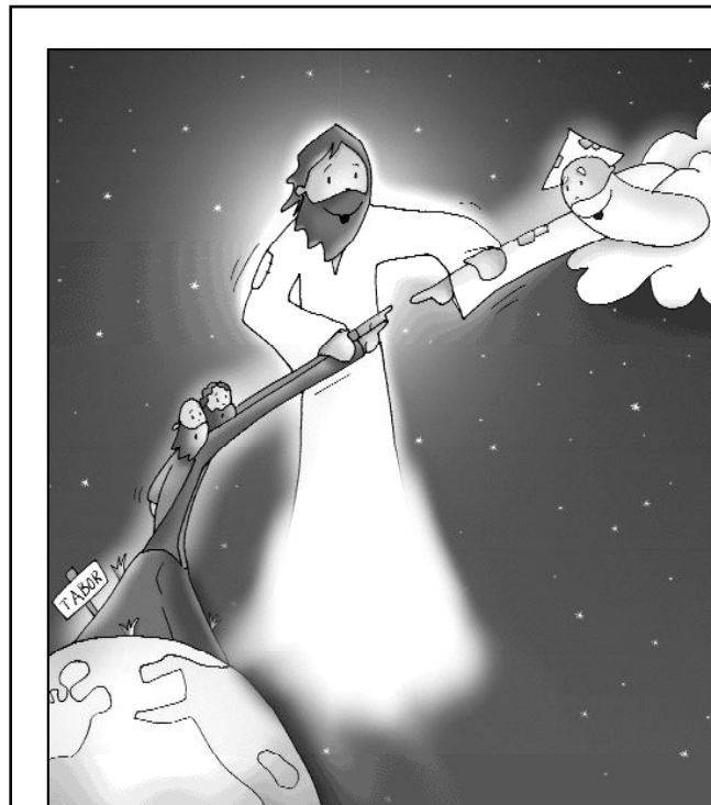
"Jesús se transfiguró"

Una experiencia que es tan gozosa que se nos invita a compartir con los demás, porque