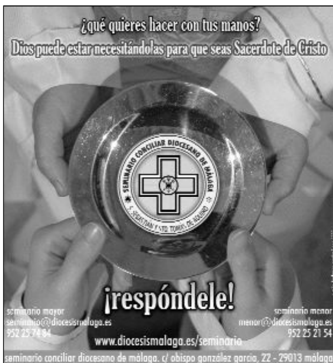
Imagen que ilustra el tríptico vocacional editado por el Seminario

A partir del próximo viernes, 13 de marzo y hasta la celebración litúrgica del Día del Seminario, (el domingo siguiente al día 19, es decir, el día 22),