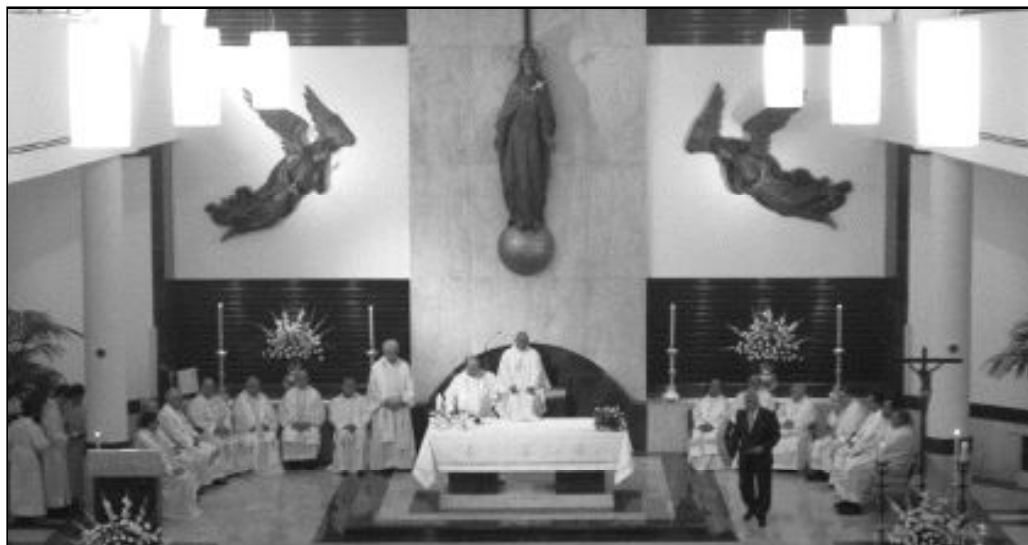
Imagen de la Eucaristía de inauguración de las obras realizadas en la iglesia parroquial de la Amargura

La parroquia fue creada en el año 1953, al terminar la gran misión de Málaga, pero no comenzó hasta el año 1956 en la ermita de Zamarrilla, donde permaneció hasta la inauguración del nuevo complejo parroquial el 14 de mayo de 1961, siendo bendecida por el obispo auxiliar D. Emilio Benavent.