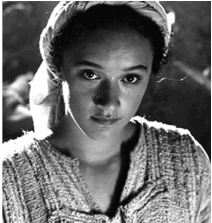
La mujer derrocha ternura por donde va

Porque son las madres de familia que cuidan, educan y forman a los hijos, futuro de la humanidad; son las profesionales de todo tipo, que componen el más amplio abanico que se pueda imaginar y que, en sus diversas tareas, van poniendo ese sello de eficiencia, de actitud de servicio, de amable serenidad. Son las religiosas que, en su dedicación total a Dios y a los demás con generosidad y abnegación, van sembrando semillas de vida a través de la clausura, de la enseñanza, de la asistencia a ancianos, niños y