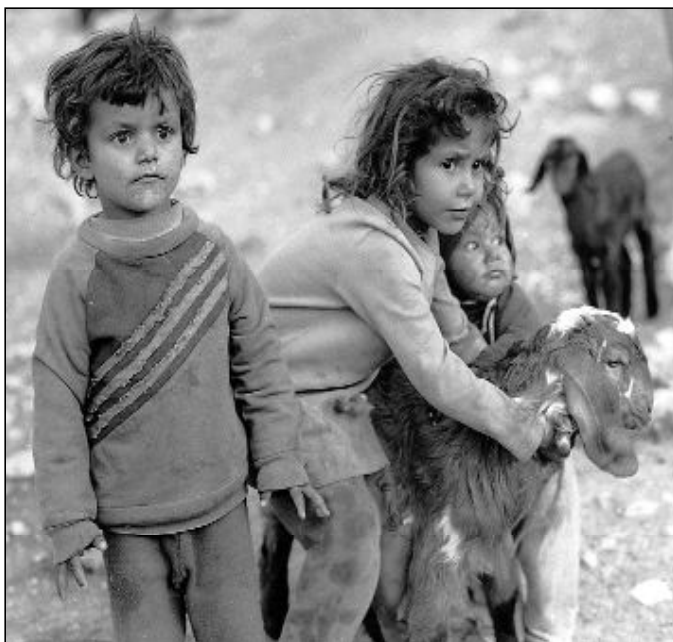
La situación económica actual privará a muchos niños de ser educados

Los niños de países o sectores empobrecidos serán las primeras víctimas de la crisis económica y financiera, advirtió la Santa Sede al tomar la palabra ante la sesión especial del Consejo de los Derechos del Hombre. El arzobispo Silvano M. Tomasi llegó a esta conclusión en su intervención, al analizar el impacto de la crisis económica y financiera mundial en los derechos humanos. En particular, el representante de Benedicto XVI consideró que el devastador impacto de la crisis en los niños pobres se deberá a dos motivos fundamentales: la reducción de las ayudas oficiales que ya se está constatando, así como de las remesas que envían a sus familias los trabajadores emigrantes. En juego, denunció, están "los derechos a la salud, a la educación, y a la alimentación". En varios países pobres, de hecho, "los programas educativos, de salud y ali-