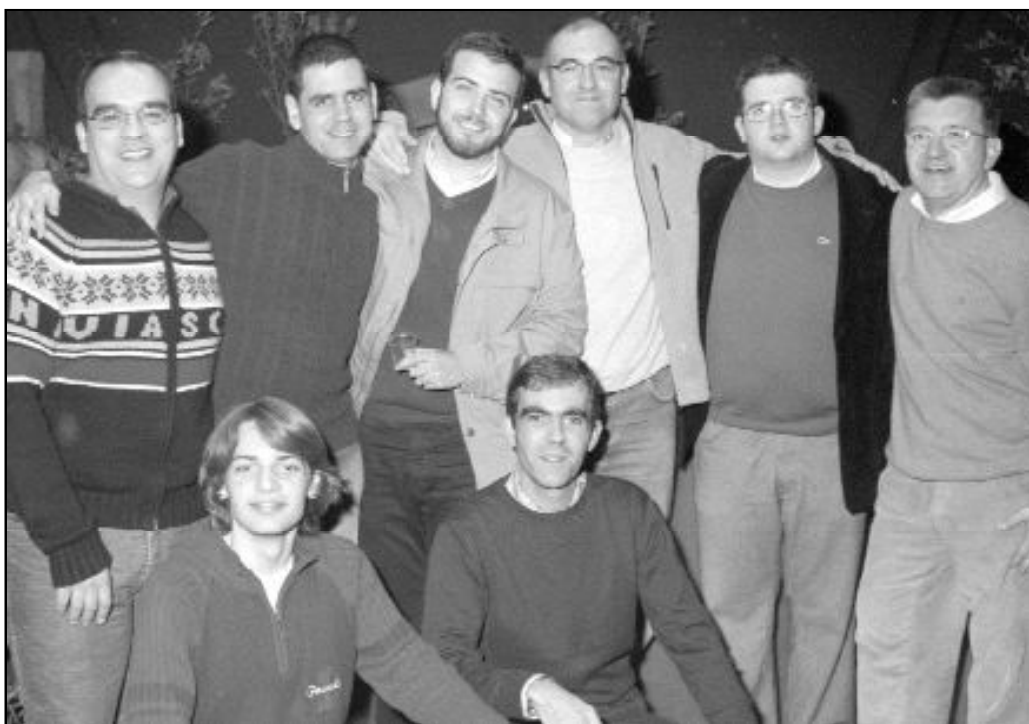
Un grupo de seminaristas que está actualmente preparándose para el sacerdocio