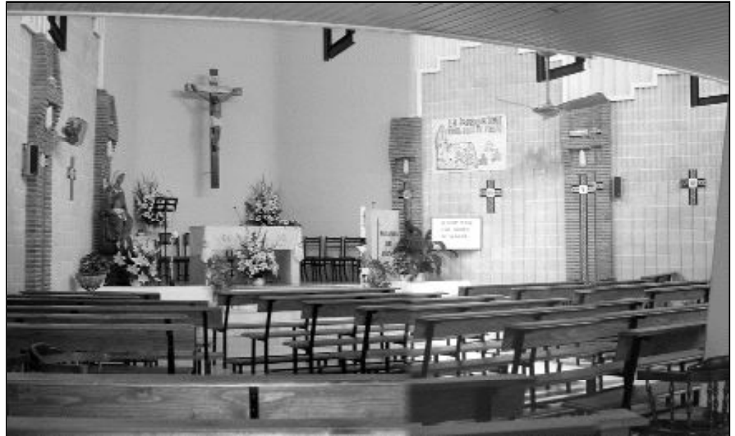
Interior del templo parroquial