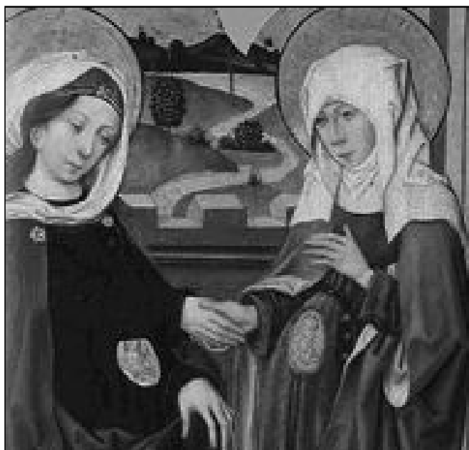
Detalle del cartel anunciador del año de oración por la vida

A propuesta de la Subcomisión Episcopal para la Familia y Defensa de la Vida, y con el visto bueno del Comité Ejecutivo de la Conferencia Episcopal Española (CEE), se ha puesto en marcha este año 2009, un año de oración por la vida que, pretende, en palabras de Juan Pablo II en el Evangelium Vitae que "en cada comunidad cristiana, con iniciativas extraordinarias y con la oración habitual, se eleve una súplica apasionada a Dios, Creador y amante de la vida". Para ello, y con el objetivo de facilitar la oración personal y comunitaria, la citada Subcomisión ha preparado unos materiales, cartel, rosario, oraciones por la vida, preces para la adoración ante el Santísimo y para la celebración de la Eucaristía y la Liturgia de las Horas, que se han enviado a las delegaciones de pastoral familiar de todas las diócesis españolas y que pueden ser bajadas de internet desde la página web www.conferenciaepiscopal.es .