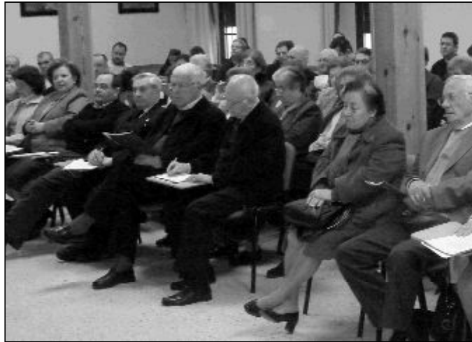
San Pablo fue el eje de la reflexión