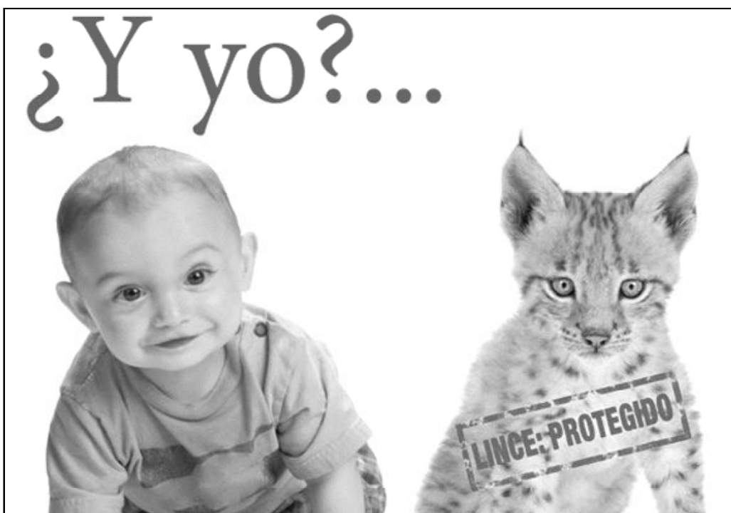
Detalle del cartel de la Conferencia Episcopal para la Jornada por la Vida del 25 de marzo