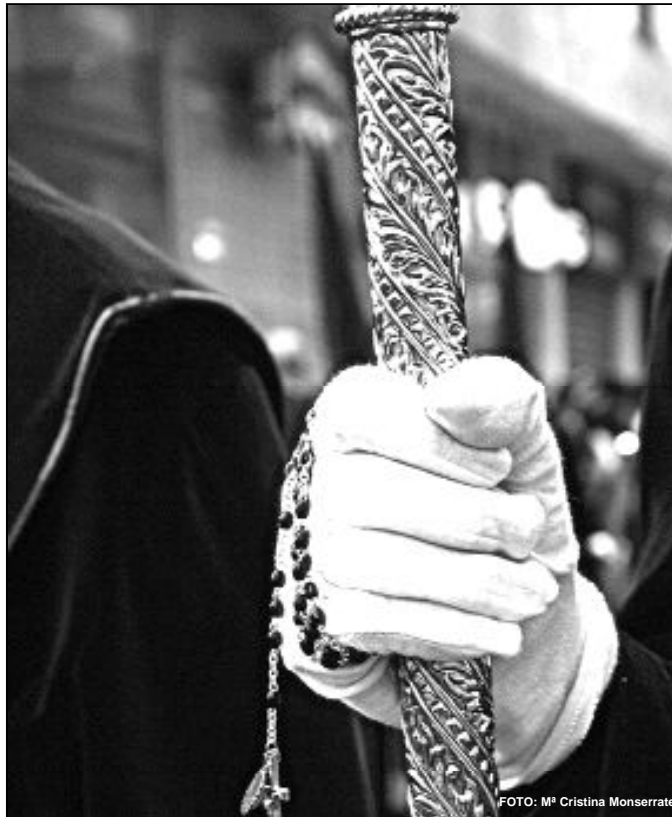
Muchas cofradías realizan estación de penitencia en la Catedral

El acto penitencial comunitario se desarrollará a las 11 de la