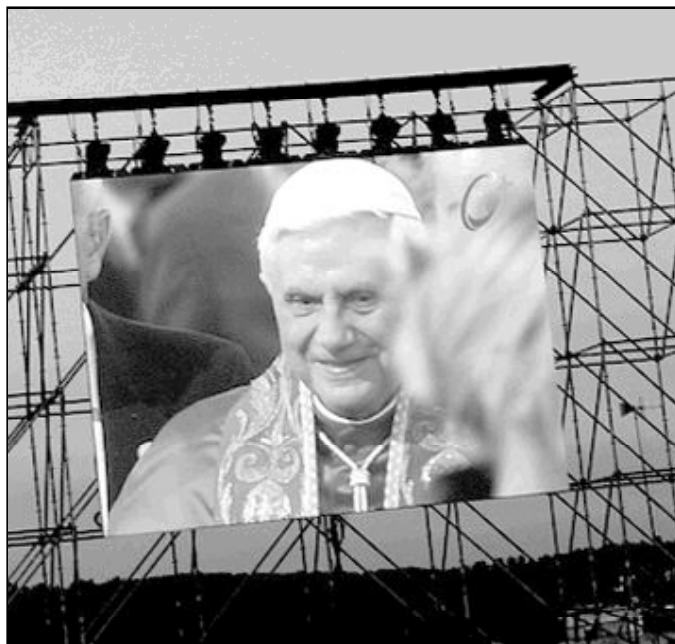
Benedicto XVI en Colonia, Alemania

Las declaraciones del obispo, continúa la carta, "se han superpuesto de manera imprevisible" a la rehabilitación de los lefebvristas, excomulgados en 1988 por su opo-