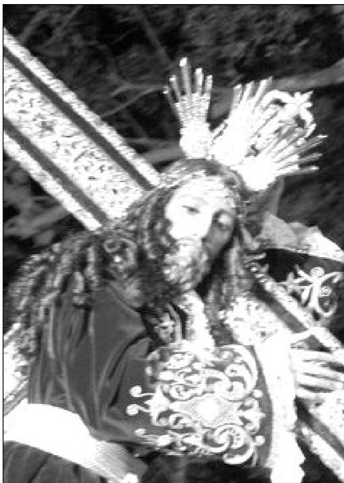
Detalle de la imagen de Nuestro Padre Jesús El Rico

Esta actuación se complementa con una visita, por parte de los alumnos, a la Ciudad de la Justicia, donde pueden presenciar la celebración de un juicio y comprender la repercusión de cualquier acto delictivo en la vida de una persona.