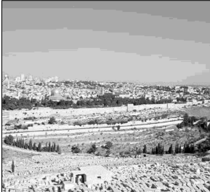
Pablo llegó a Jerusalén

Pablo partió de Éfeso hacia Tróade, a donde había enviado por delante a sus colaboradores Erasto y Timoteo para que activasen la recogida de la colecta a