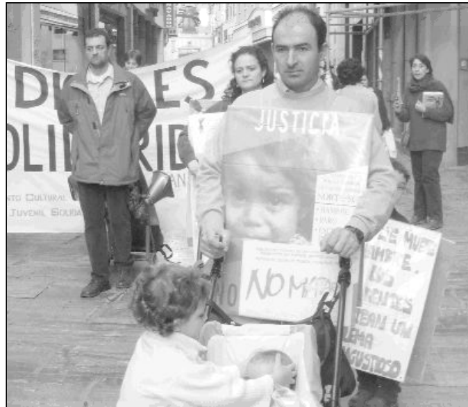
Manifestación del Movimiento Cultural Cristiano

4º Entendemos que esta posición ética sobre el derecho a la vida debe ser entendida de modo universal, independiente de las creencias o adhesiones religiosas que cada individuo profese, pero al mismo tiempo podemos entender la situación de aquellas personas que pueden llegar a plantearse esta opción como una alternativa, sin llegar nunca, por supuesto, a compartirla y a