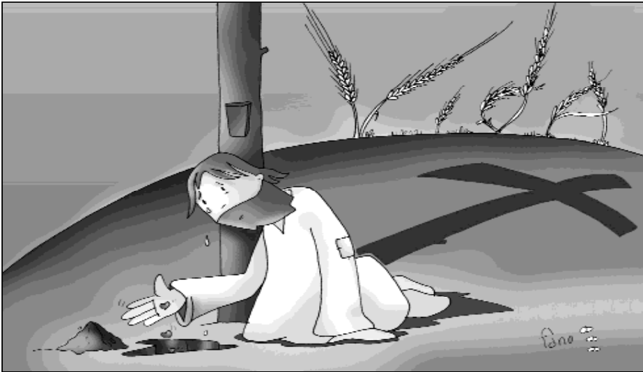
El grano de trigo muere para dar vida