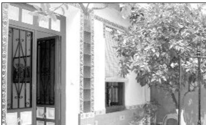
Detalle del patio de la casa "Ntra. Sra. de la Merced"

F.D.T. recibió el indulto el año pasado y ha tenido la generosidad de compartir su experiencia con nosotros.