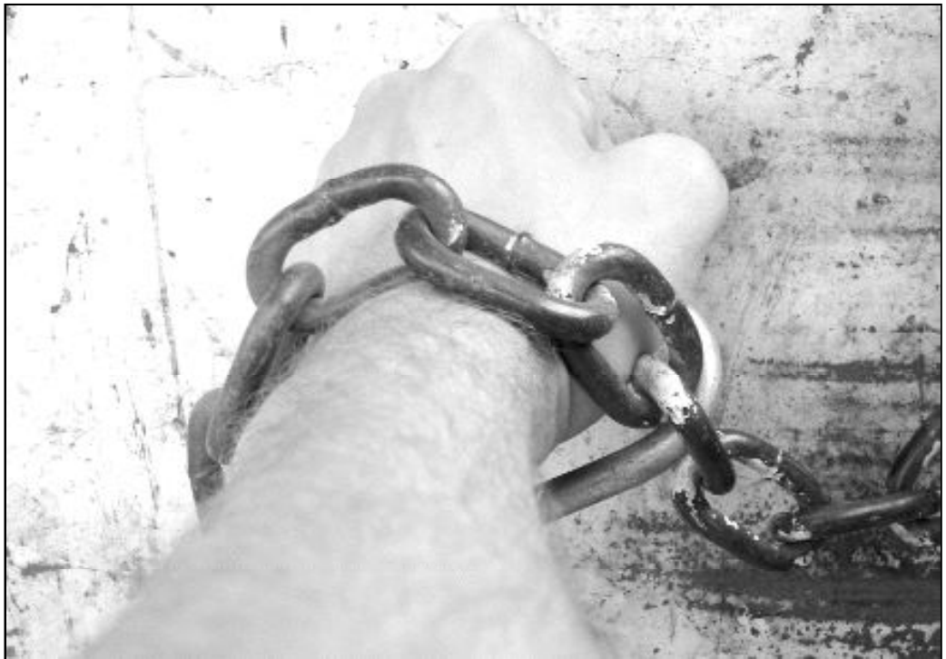
La verdadera liberación sólo se consigue cuando la persona es capaz de recuperar su autonomía

Desde hace algunos años, diversas cofradías de la provincia también solicitan al Ministerio de Justicia la liberación de un preso de su distrito. Con esta medida, adquieren el compromiso de realizar un seguimiento personalizado para ayudarle y acompañarle en el duro camino que emprenden hacia su completa inserción social.