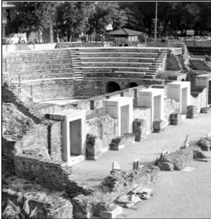
Ruinas de Tesalónica

Pero a su partida Pablo dejó una comunidad viva y fervorosa, formada por algunos judíos