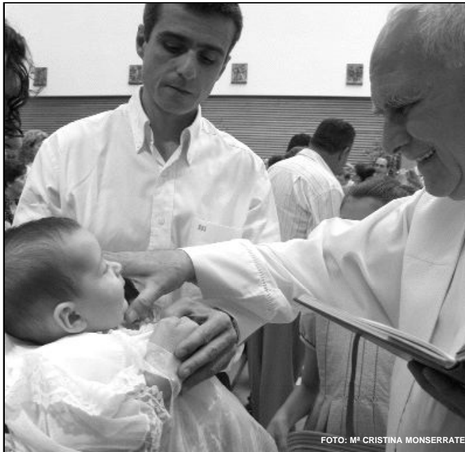
Una niña es unguida con el óleo de los catecúmenos en su bautismo

El delegado de liturgia nos explica que la palabra crisma ,