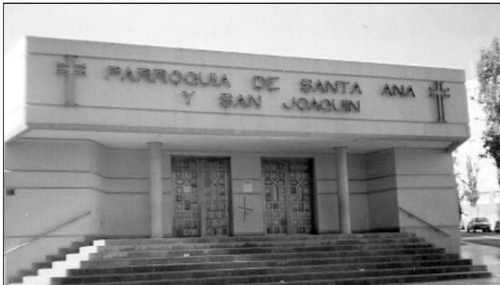
Fachada del templo parroquial de Santa Ana y San Joaquín

catequesis y comunidades de adultos de inspiración diocesana; una Cáritas incipiente, que a través de sus miembros y de toda la parroquia intenta estar cerca de los problemas y necesidades del barrio; la Asociación MIES y sus comunidades, insertadas en la parroquia, que trabajan apostólicamente con jóvenes y niños alentando la oración y diversas actividades. También la Hermandad de Culto y Procesión de Jesús Nazareno del Perdón y María Stma. de Nueva Esperanza, se va haciendo cada