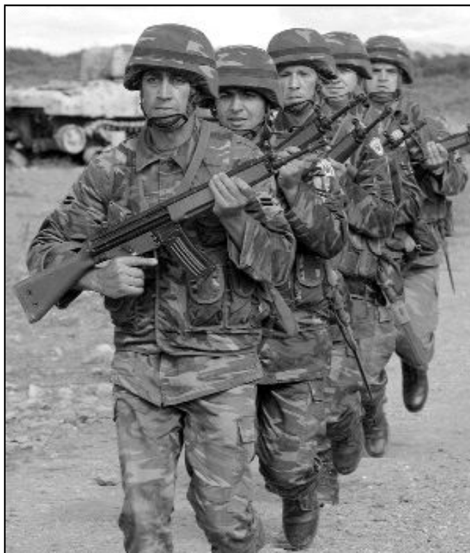
"Hoy tenemos libertad, pero el problema es la seguridad"

Ante la reciente expulsión de Marruecos de cuatro evangélicas españolas y una alemana, acusadas de proselitismo, tanto la Iglesia Católica como la Iglesia Evangélica se dedararon ajenas a la actividad de estas personas