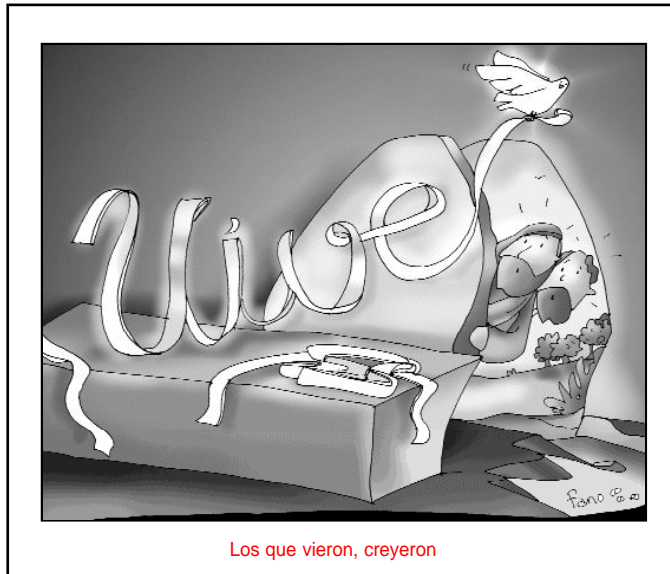
Los que vieron, creyeron

Terminamos con este segundo domingo la octava de Pascua. Ocho días en los que la Iglesia ha celebrado con gozo la Resurrección del Señor. Ocho días en los que se ha proclamado a los cuatro vientos el grito de júbilo de los apóstoles: ¡en verdad ha resucitado!