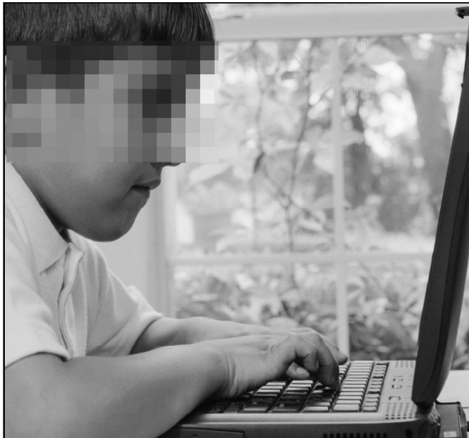
Los niños occidentales sufren hoy otro tipo de esclavitud

Aparte de la mayor de las violencias, como es la que sufren los