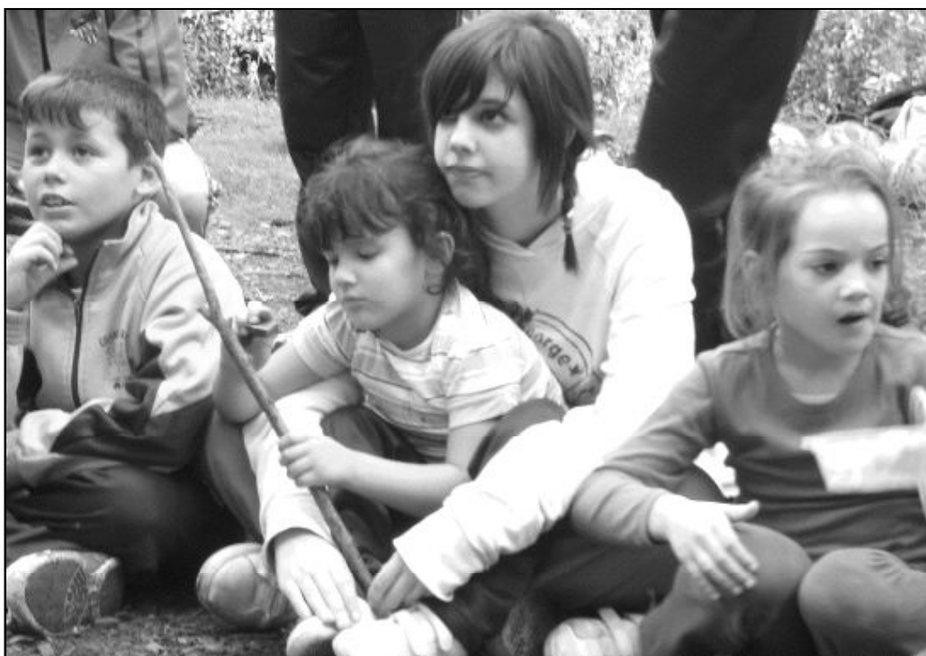
La solidaridad, el acompañamiento y el trabajo conjunto son claves en la educación de los más pequeños