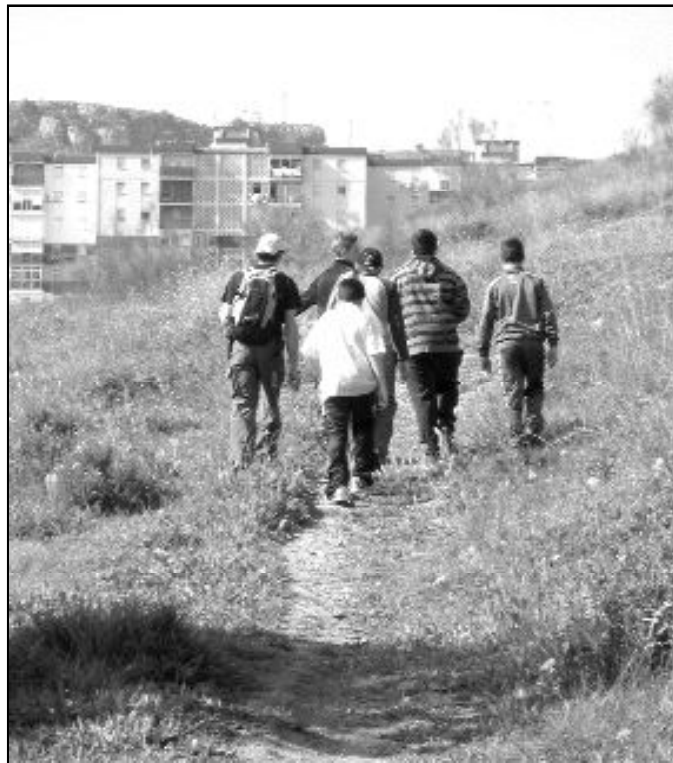
"Bajar a la calle" es parte de un camino que aún está por recorrer

Su objetivo es trabajar con los chicos y chicas del barrio, fuera del horario lectivo, pero aprovechando las instalaciones. Entre las actividades que se realizan se encuentran refuerzo educativo, excursiones, salidas, y lo que denominan "centro abierto", que consiste en una serie de talleres para los muchachos y también para sus familias, a quienes se les apoya, además, mediante una Escuela de Padres que se coordina con técnicos de Cáritas diocesana.