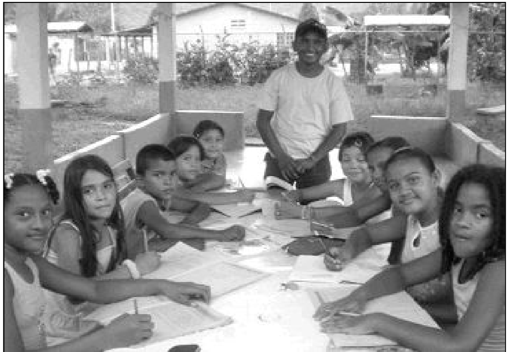
Un grupo de niños profundiza en el seguimiento de Jesús con la ayuda de un catequista nativo