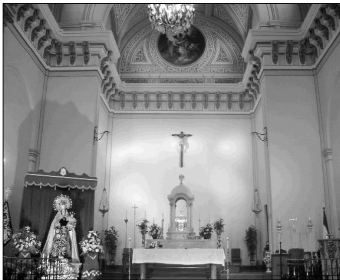
Interior del templo parroquial