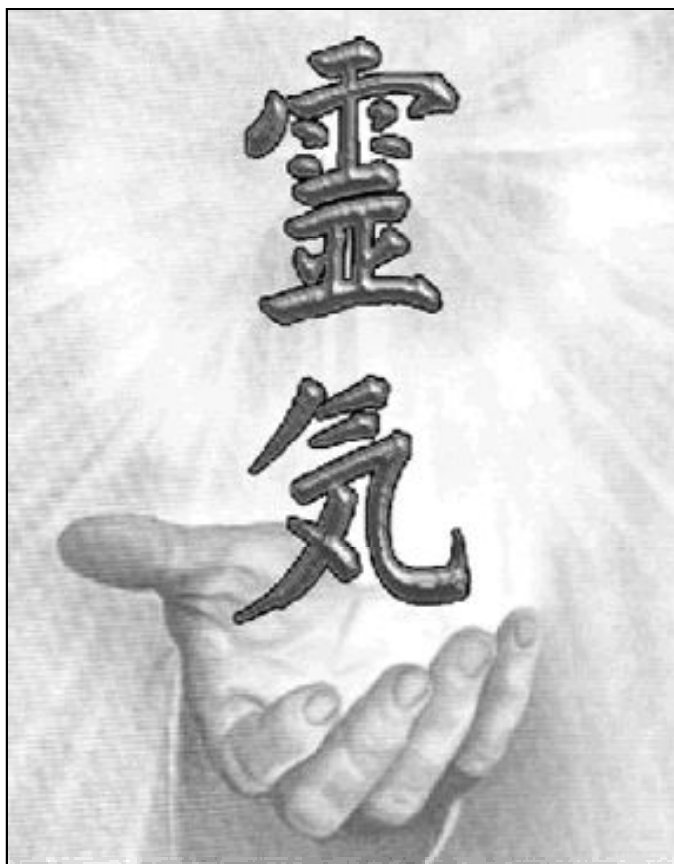
El Reiki no ha sido aceptado por las comunidades científicas

Benedicto XVI dedicó el mensaje de Pascua de la Basílica de San Pedro del Vaticano a mostrar cómo la resurrección de Jesús no es una teoría o un mito, sino el hecho más significativo de la historia. Ante los doscientos