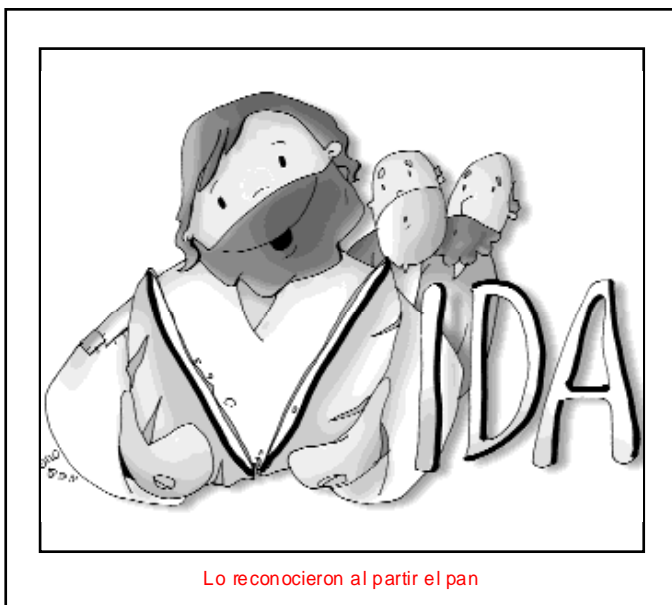
Lo reconocieron al partir el pan

encuentro con el resucitado para que luego hablasen abiertamente y sin miedo de Jesucristo. Por tanto, la experiencia pascual se antoja necesaria, primero, para nuestro crecimiento personal y nuestra relación con Dios y, segundo, para ser transmisores, testigos, apóstoles del Señor resucitado con valentía y con autoridad, porque esta experiencia no es para que se quede en nuestro interior, sino que debe salir, debe ser vivida, debe ser transmitida. Y nosotros, ¿nos hemos encontrado con el resucitado? Karl Rahner, famoso y gran teólogo del siglo XX, dijo que el cristiano del siglo XXI o será un místico o no será cristiano. Creo que por ahí debe ir