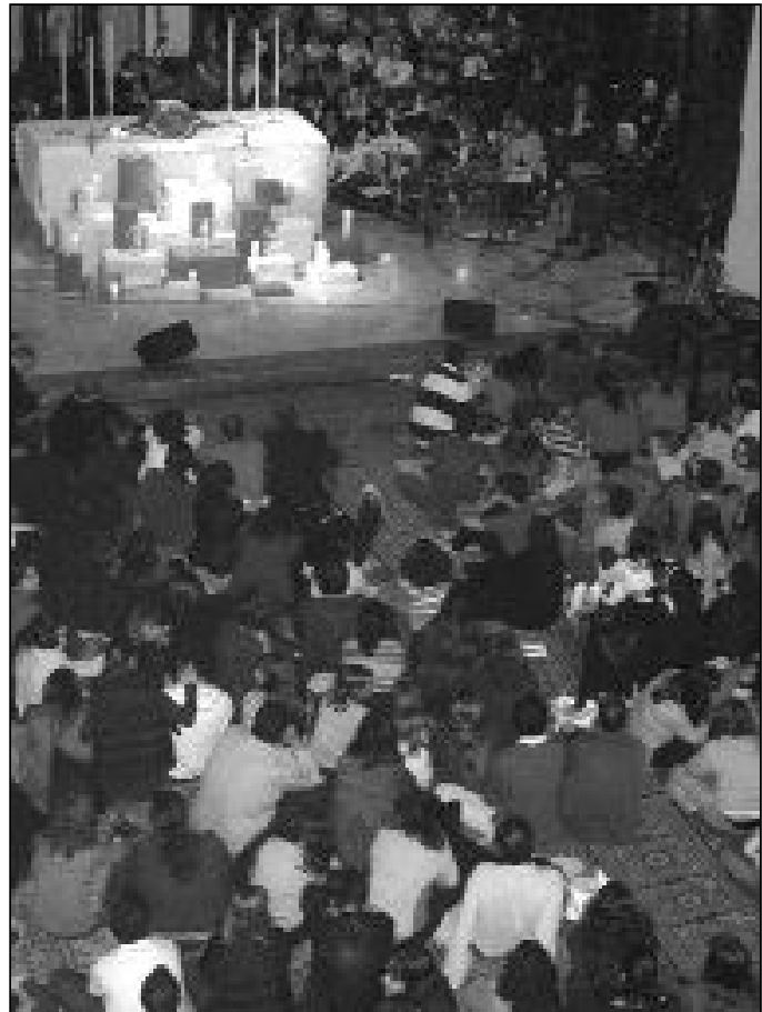
Momento del Maratón de Oración por las Vocaciones celebrado en marzo

Los frutos de esta oración no son fácilmente cuantificables. “Por números, hemos de decir que las vocaciones al sacerdocio o a la vida consagrada están bas-