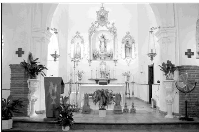
Interior del templo de Comares (arriba) y de Benamargosa (abajo)

más le llama la atención de los vecinos de Comares y de sus pedanías es la religiosidad tan profunda y respetuosa que tienen, sobre todo en los ritos funerarios y en los sacramentos, a los que dedican un cuidado especial.