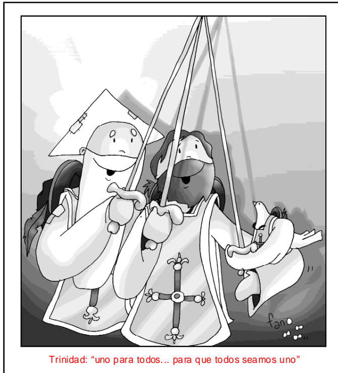
Trinidad: "uno para todos... para que todos seamos uno"

Dios es Familia. Y desde lo que Él es, nos invita a toda la comunidad humana a que seamos reflejo fiel de esa relación de amor que existe entre el Padre, el Hijo y el Espíritu. A esto está llamada la humanidad y en la medida en que ésta sea fiel a la voca-