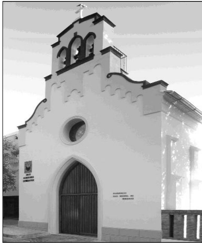
Fachada de la iglesia

En 1942, D. Balbino, obispo de Málaga, decreta la creación de 14 nuevas parroquias, entre las cuales está la de San Miguel, que se segrega de la del Sagrario. El 1 de enero, abrió los libros sacramentales la parroquia y estrenó sello parroquial. También cabe reseñar las distintas actividades de los Padres Paúles en cuanto a misiones populares por toda la diócesis. Y esta parroquia es punto de referencia y de encuentro para las comunidades de Hijas de la Caridad de la capital. La parroquia va tomando vitalidad con la presencia de los distintos párrocos y la incor-