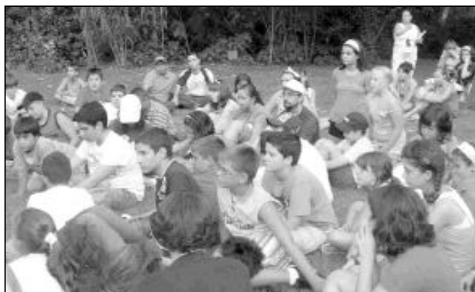
Dos imágenes del campamento en Jimera de Líbar

del curso siguiente. El hilo conductor del campamento ha sido la figura de san Pablo. Durante los días de la experiencia se ha recorrido su vida, desde la infancia hasta el martirio, a través de una historia de ficción que tiene como protagonista a un supuesto amigo de la infancia, Ciriaco de Tarso,