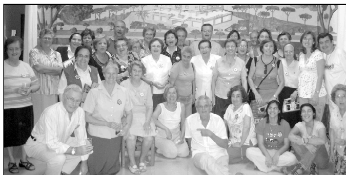
Participantes en la Verbena del Hogar Pozo Dulce

El coro del hogar compuso una canción dedicada a los voluntarios, en la que se explicaba el proceso de adaptación desde que llegan a Pozo Dulce y se producen las primeras tomas de contacto. También el grupo de teatro "El corralito" interpretó la obra "Cosas de viejos", escrita y dirigida por ellos. Y como recuerdo de la noche, en agradecimien-