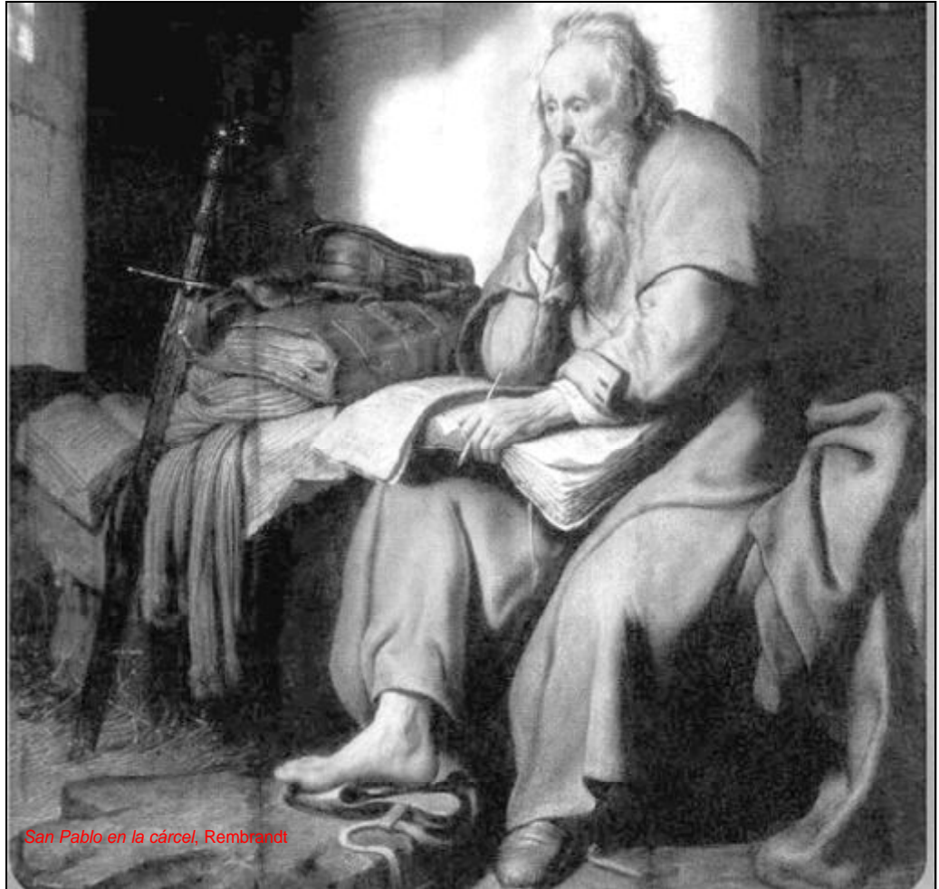
San Pablo en la cárcel, Rembrandt

El sucesor de Félix, el procurador Poncio Festo, quiso enviar a Pablo a Jerusalén para que fuese juzgado. Pablo, sabiendo que los judíos habían preparado una celada para matarle por el camino, ejerció su derecho como ciudadano romano de ser juzgado ante el