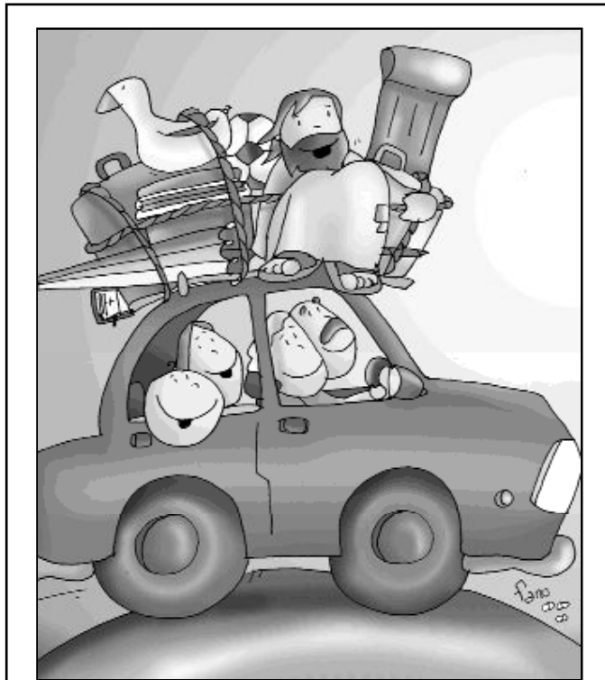
"LLévate a Jesús en vacaciones"

dedicar un rato cada día a descansar en el Señor; como el mismo Jesús recomienda a sus discípulos después del cumplimiento de la tarea y la misión encomendada. De este modo podremos proponer con más fuerza a Jesucristo en medio de una sociedad que vende humo.