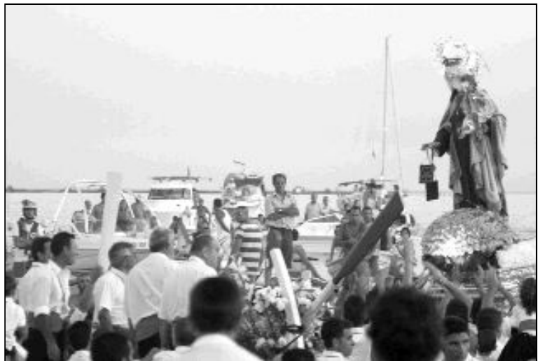
VIRGEN DEL CARMEN, EN EL PALO

En estas fotos enviadas por Javier Cebreros podemos ver dos momentos de la procesión de la Virgen del Carmen, el jueves 16 de julio, por las calles de la barriada de El Palo. La sede canónica de esta imagen de la Virgen es la parroquia de las Angustias. Fuengirola, Estepona, Marbella, El Perchel, Huelin, La Cala del Moral, Guadalmar y pueblos del interior como Campanillas o Cuevas de san Marcos, entre otros, celebraron ese día la festividad de la Virgen del Carmen con eucaristías y procesiones.