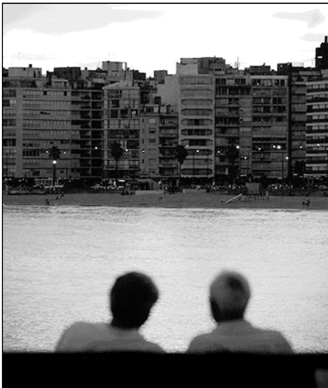
Tiempo para el diálogo y la reflexión para el matrimonio y la familia

3.- Lee algo, no sólo el periódico, sino una revista, un buen libro. Todos podemos leer. Aunque hayamos perdido el hábito... Y comenta lo que lees. ¡Qué útil es leer como familia un libro y comentarlo! Y "échale un poco de humor a la cosa": la risa alegra el corazón y evita las arrugas de la cara. "El humor sano y la risa discreta es