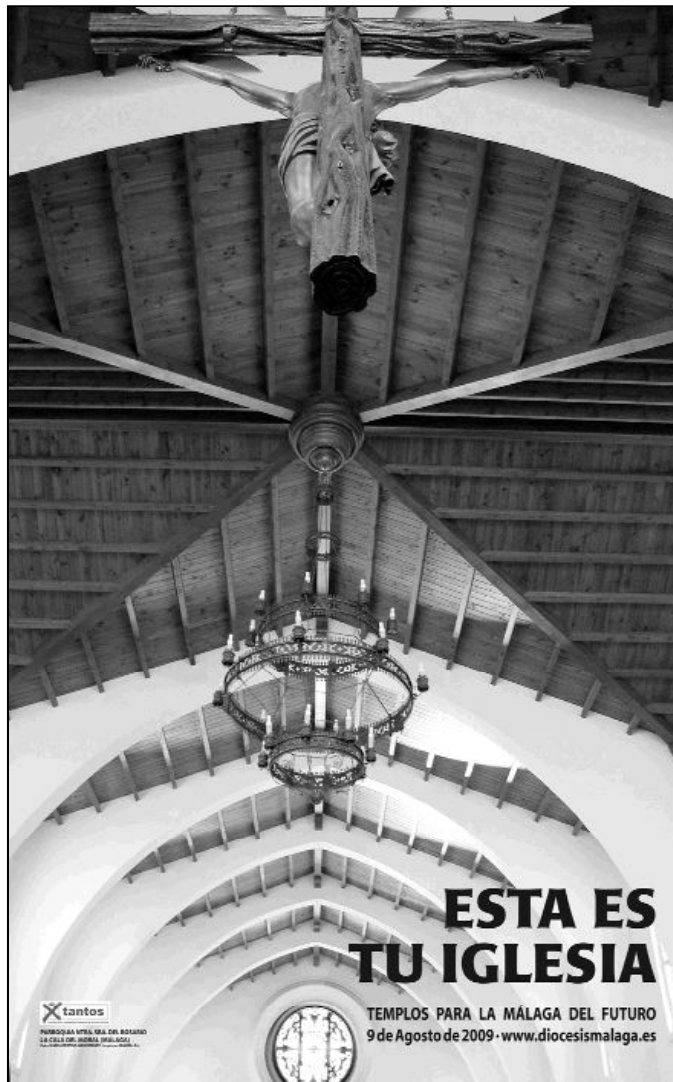
Cartel de este año para la campaña extraordinaria

Según la información económica de la Diócesis correspondiente al año 2008, la inversión en obras de rehabilitación y construcción de nuevos templos ascendió a más de seis millones de euros; es decir, el