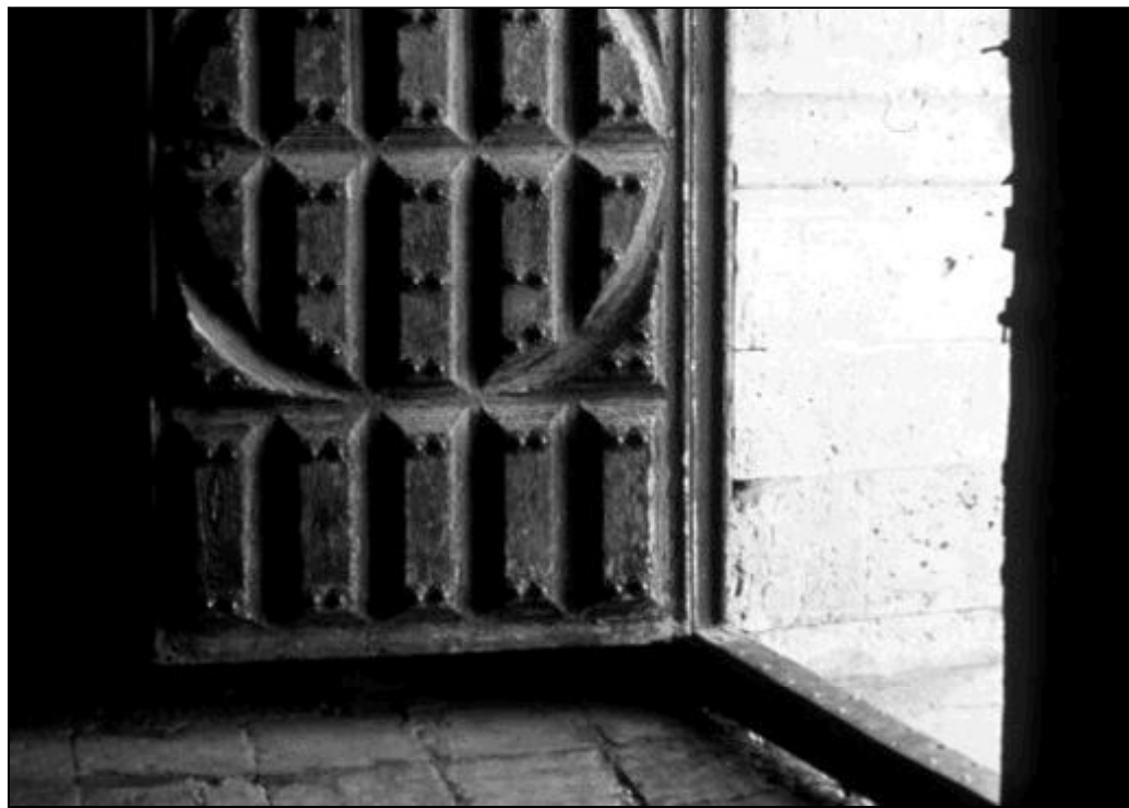
La parroquia es una casa de puertas abiertas

Han sido también muchos los párrocos y feligreses que han ayudado a que esta sección se pudiera publicar semanalmente, facilitando los datos y las fotos.