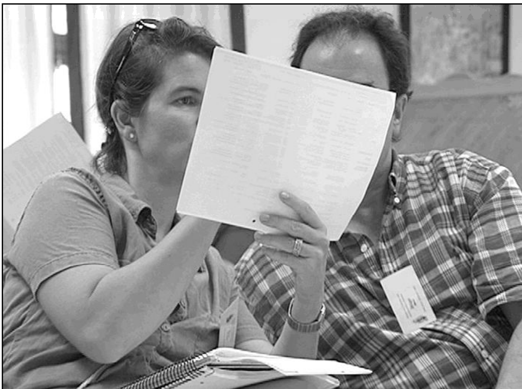
Participantes en el Máster en Pastoral Familiar en años anteriores