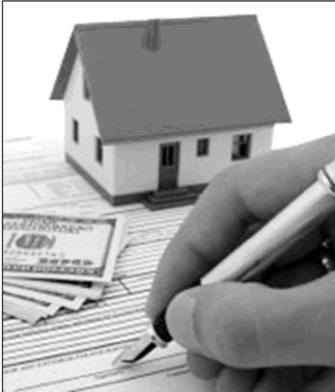
Los niños nacen en una sociedad con más recursos que nunca

Gran parte de la responsabilidad de esas hipotecas la tenemos