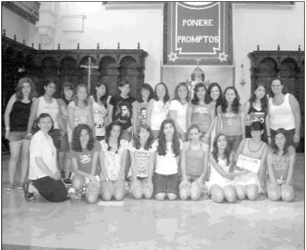
Foto de las chicas participantes en la experiencia vocacional SICAR