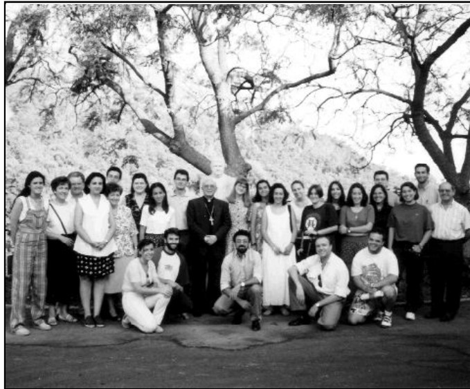
Foto de la primera promoción de la experiencia Monte Horeb, 1995-96. Las tres experiencias vocacionales celebran sus encuentros en el edificio del Seminario.

Más de 1.000 chicos, de entre 12 y 18 años, han vivido la experiencia del Menor y han contagiado a otros de lo que han supuesto para ellos las convivencias mensuales, la de verano, etc.