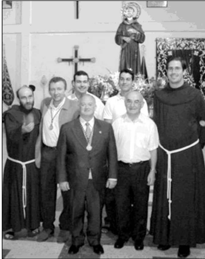
Padres Franciscanos de Ronda con sacerdotes diocesanos y feligreses

La llegada de los Franciscanos a Ronda se produce con la Reconquista, en el año 1485, con presencia en la ciudad hasta el 1836 en que los franciscanos abandonan la ciudad a causa de la Desamortización de Mendizábal. El P. Salvador nos describe la nueva llegada de los Franciscanos a Ronda y la opción de formar una Fraternidad Vocacional: "Llegamos a Ronda en el año 2004 y actualmente somos 4 hermanos en la Fraternidad. La casa de Ronda tiene como finalidad principal la acogida de jóvenes y el acompañamiento vocacional. La tarea fundamental es el acompañamiento y el trabajo con los distintos grupos