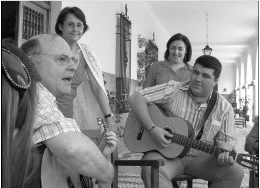
Cursillistas comparten un rato de canto en el transcurso de la experiencia