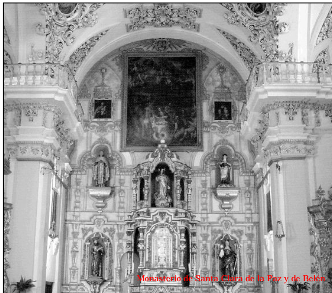
Monasterio de Santa Clara de la Paz y de Belén

En estos días cercanos a la Navidad, Antequera se convierte en la ciudad de los ricos mantecados preparados en sus monasterios de clausura. Entre ellos, destaca el de Santa Clara de Belén, en el que las claristas, además de la elaboración de los exquisitos mantecados, polvorones, alfajores, roscos, "bienmesabe", dedican la mayor parte de su jornada a la oración. Los orígenes de este monasterio se remontan al 18 de diciembre de 1603, en que cuatro hermanas claristas, procedentes del monasterio de Santa Clara de Estepa, se trasladan a Antequera para iniciar la vida evangélica de Hermanas Pobres de Santa Clara. Con la desamortización de Mendizábal, en 1841, desaparece el monasterio y 18 años después, en 1859, el deseo de los antequeranos y del obispo y el anhelo fuerte de las claristas deciden la nueva apertura, esta vez en el antiguo convento de los carmelitas descalzos. Del primitivo convento, en la calle de Santa Clara, que llegó a tener nueve patios, hoy sólo queda la iglesia, la sacristía y escasos restos de un claustro. El actual convento, situado en la calle Belén, fue, desde 1640 hasta la desamortización, convento de carmelitas descal-