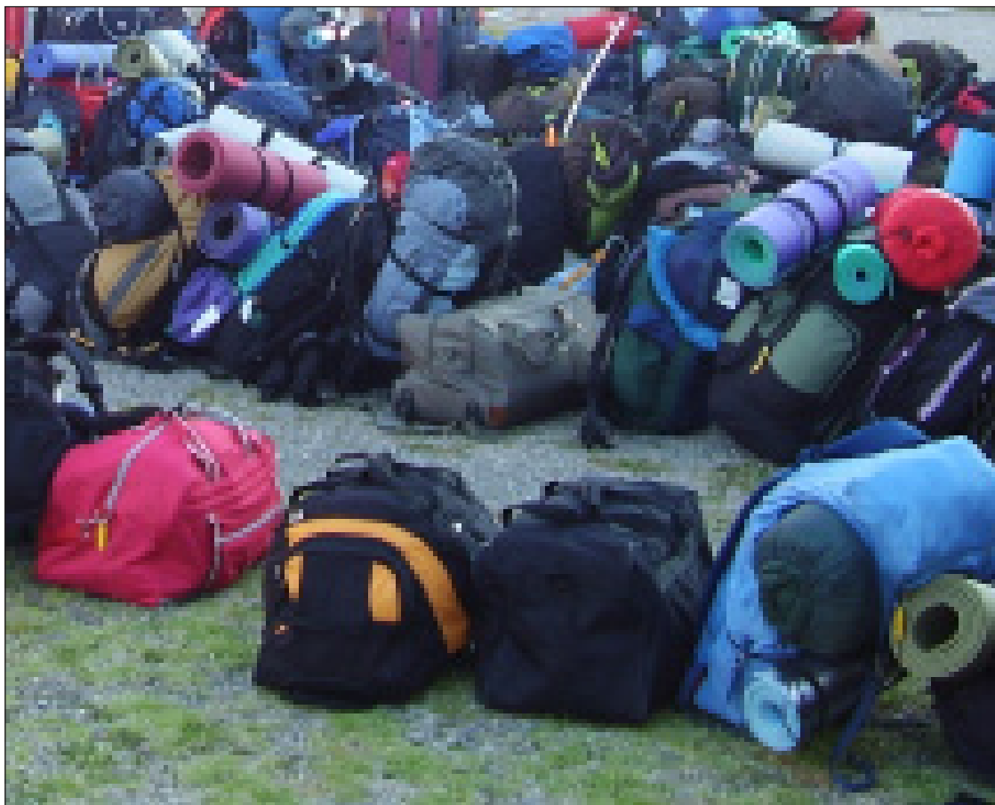
Los jóvenes regresarán físicamente cansados, pero con el corazón lleno de alegría