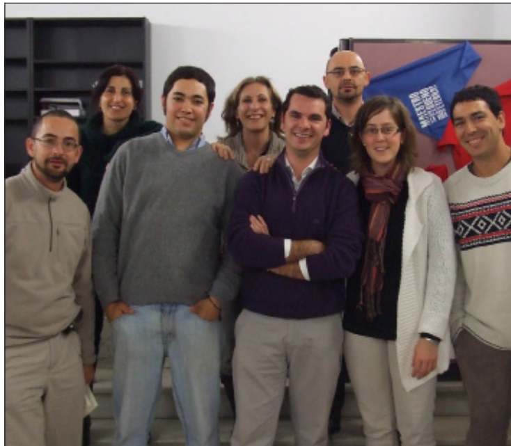
Equipo de la Delegación de Juventud de la Diócesis

1.- A nivel personal, miles de adolescentes, jóvenes y adultos pueden aportar experiencias propias de acercamiento, encuentro, vuelta a la fe; de poner a Jesucristo nuevamente como el centro de la vida; de “arraigarse y edificarse en Cristo”. Los acontecimientos centrales de estos años han sido como faros que iluminan el camino de la fe, la esperanza y el amor de muchos cristianos: la Peregrinación y Encuentro de Jóvenes en Santiago de Compostela, la Cruz de los Jóvenes y el Icono de la Virgen, los Días en las Diócesis, y la Jornada Mundial de la Juventud. Y se nota, en las parroquias, los movimientos, las comunidades, las asociaciones que se han implicado, ese misterioso