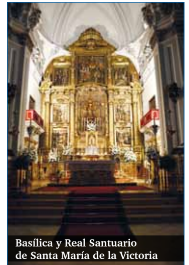
Basilica y Real Santuario de Santa María de la Victoria