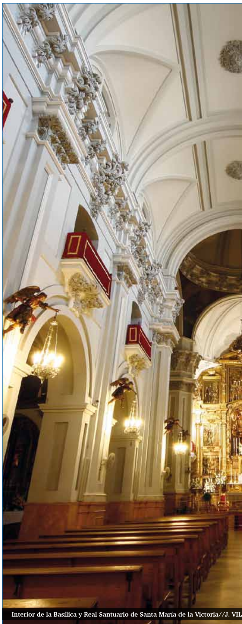
Interior de la Basílica y Real Santuario de Santa María de la Victoria

La nave central se cubre con bóveda de medio cañón con lunetos y fajones y se articula mediante pilastras cuyo orden arquitectónico podría tener un sentido alegórico, ya que el capitel es un híbrido de dórico y corintio en alusión a la austeridad de la orden y a la dedicación mariana del templo. En la parte central del retablo se abre el espacio que da acceso al camarín y que alberga sobre templete a la imagen de Santa María de la Victoria, Patrona de Málaga y su Diócesis. El retablo muestra escenas de la vida de san Francisco de Paula y, en el ático, se recuerda el episodio histórico ocurrido en el lugar en agosto de 1487. El 25 de abril del año 2007, la ciudad de Málaga conocía la noticia de la concesión por parte del Vaticano del título de Basílica para el Real Santuario.