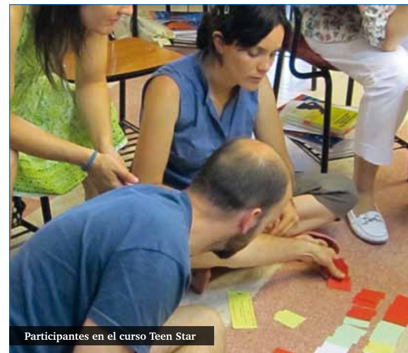
Participantes en el curso Teen Star