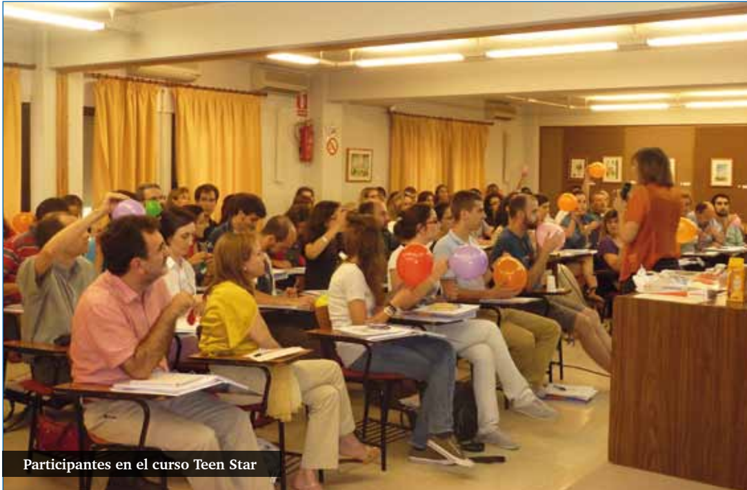
Participantes en el curso Teen Star