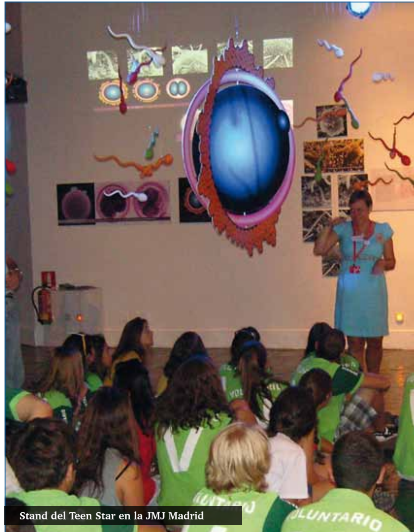
Stand del Teen Star en la JMJ Madrid

–Porque lo que se intenta es que nuestros jóvenes aprendan a establecer relaciones sinceras y duraderas, a compartir pensamientos y sentimientos, a perdonar y a saber pedir perdón, a respetar y a valorar al otro, a entender el valor del cuerpo al servicio del don de uno mismo. En definitiva, se trata de que descubran el