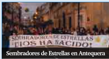
Sembradores de Estrellas en Antequera

Los niños de la diócesis de Málaga están convocados a celebrar la Jornada de Sembradores de Estrellas. Tendrá lugar el sábado 15 de diciembre, a las 11.00 horas, en la Catedral. Tras la presentación de la jornada, que correrá a cargo de los Misioneros de la Esperanza (MIES), los niños saldrán a las calles de la ciudad a felicitar a los transeúntes y anunciarles la alegría y la paz de la Navidad, en nombre de la Iglesia misionera y sin nada a cambio. Otras localidades, como Antequera, celebran la siembra de estrellas por su casa.