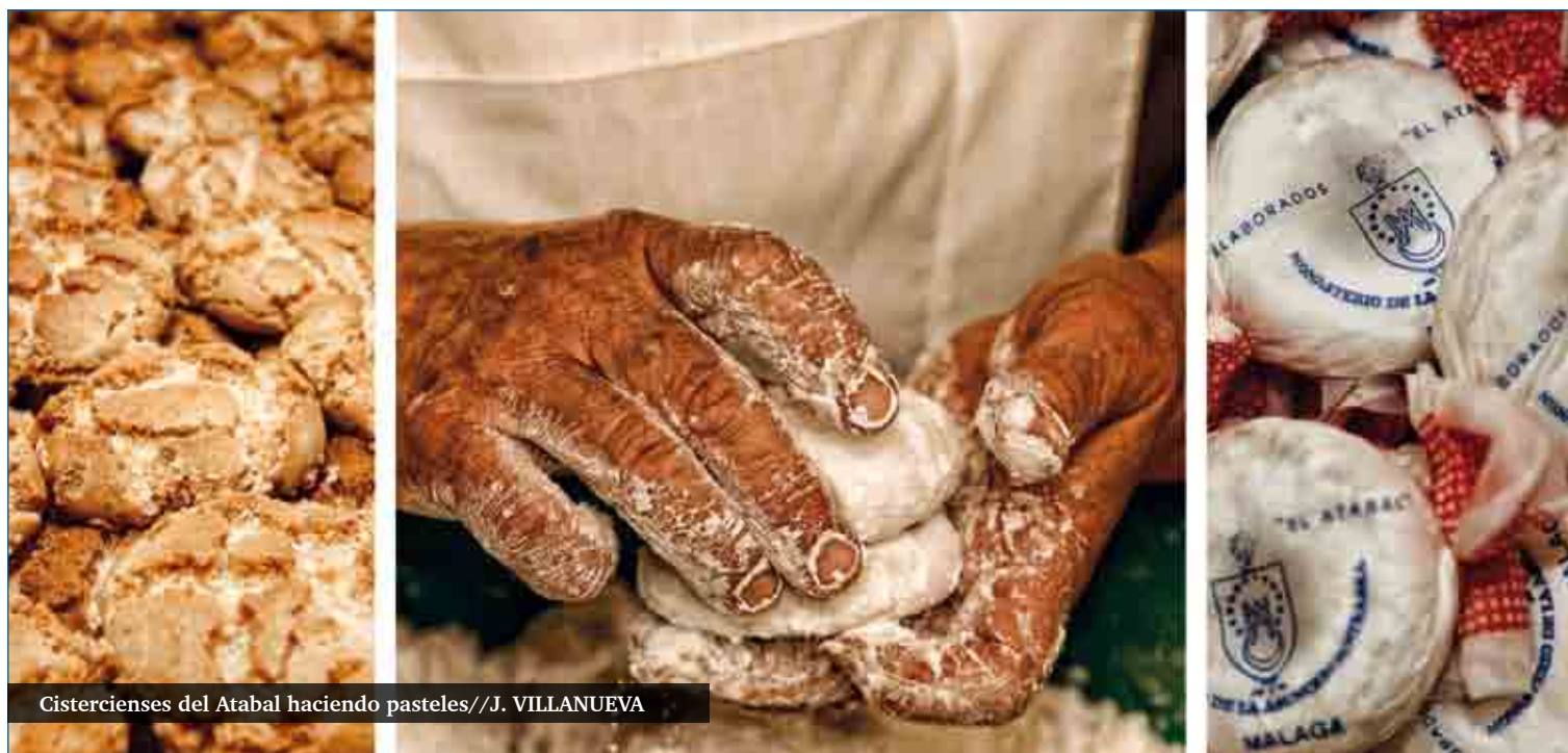
Cistercienses del Atabal haciendo pasteles//J. VILLANUEVA