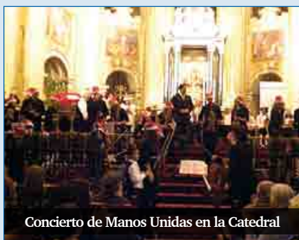
Concierto de Manos Unidas en la Catedral

Manos Unidas celebra un concierto de Navidad en la Santa Iglesia Catedral de Málaga, el 20 de diciembre, a las 19.30 horas. El acto, organizado por la Delegación local de Manos Unidas con la colaboración del Proyecto Orquestal Promúsica, deleitará a los presentes con un repertorio de villancicos y música clásica a cargo de la Orquesta Infantil Promúsica, la Joven Orquesta de Cámara Promúsica y la Orquesta de Cámara Promúsica. Este concierto se viene celebrando desde el cincuentenario de Manos Unidas, y quiere ser un gesto de agradecimiento a los malagueños por su constante afecto y colaboración con esta ONG católica para el desarrollo. La entrada es libre.