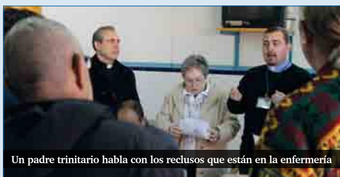
Un padre trinitario habla con los reclusos que están en la enfermería