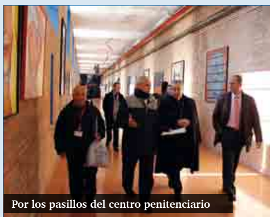
Por los pasillos del centro penitenciario