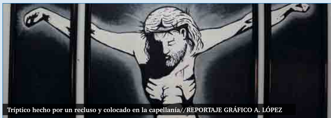
Tríptico hecho por un recluso y colocado en la capellanía