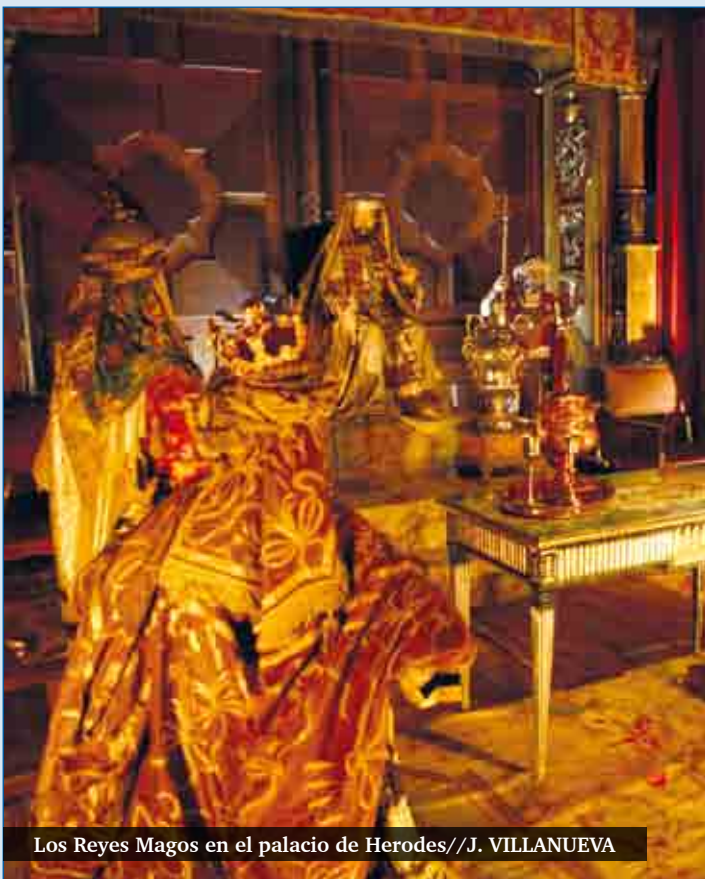
Los Reyes Magos en el palacio de Herodes//J. VILLANUEVA