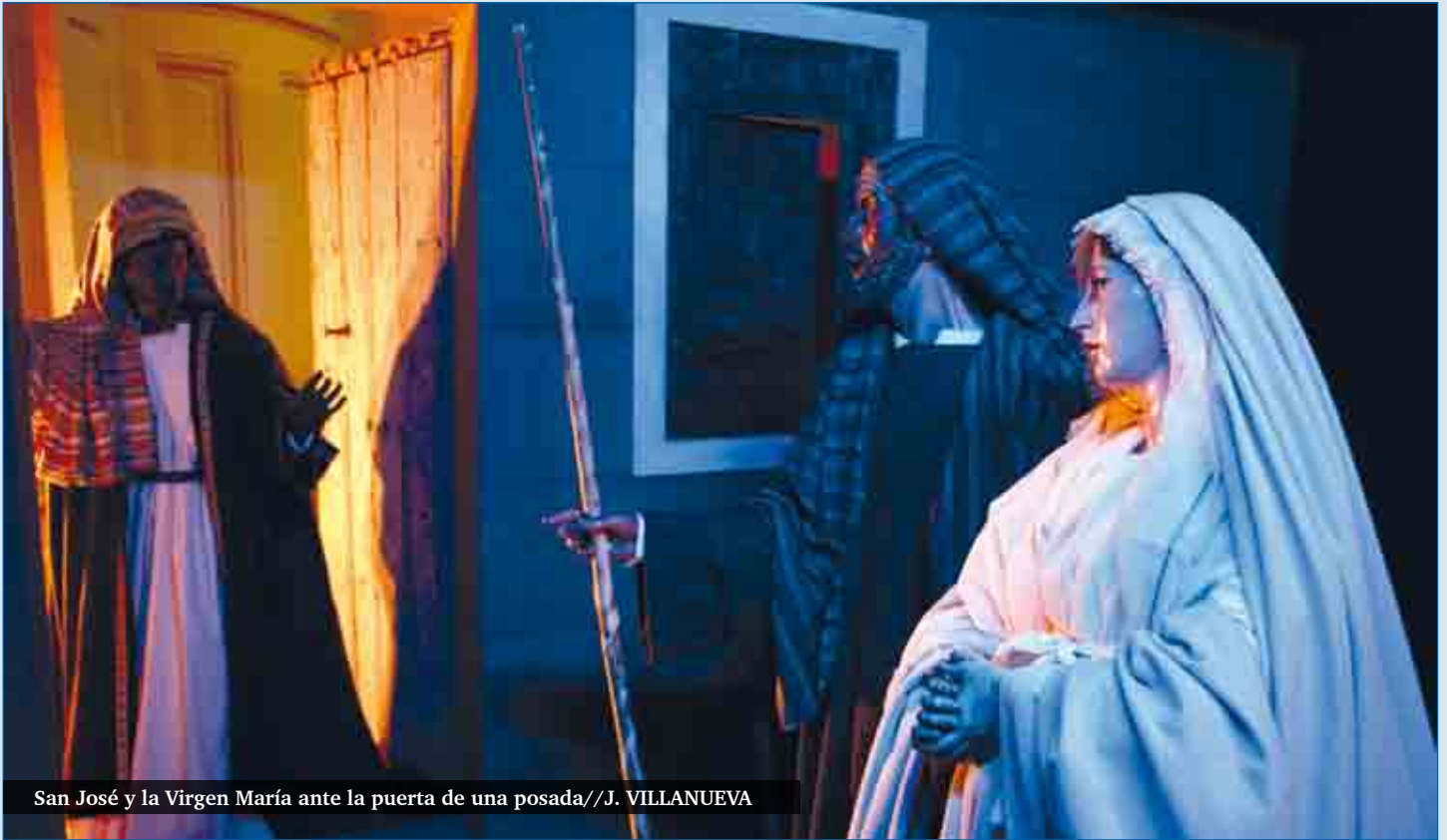
San José y la Virgen María ante la puerta de una posada//J. VILLANUEVA