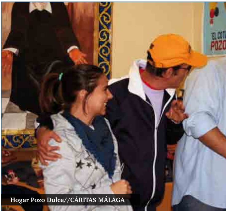
Hogar Pozo Dulce//CÁRITAS MÁLAGA