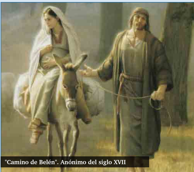
"Camino de Belén". Anónimo del siglo XVII

En estos tiempos que corren parece como si entre todas las virtudes que emana el Misterio la solidaridad y la generosidad ostentaran una preeminencia saliendo al paso de tendencias sociales cada vez más ancladas en nuestras vidas que llevan a muchos a hacer a acopio, casi compulsivo, de una ingente cantidad de obsequios en medio de una obligación impuesta por intereses mercantilistas. Constituyen –y más en la crisis que nos invade– un auténtico despilfarro, inútil derroche. Frente a esta tendencia irresponsable, la Natividad de Cristo, la Sagrada Familia que constituyó con María y José nos enseña a compartirlo todo. La Navidad no es sinónimo de consumismo. Se comprende la preocupación del papa Benedicto XVI ante el riesgo de convertir estas festividades en humo que se disipa sin dejar en nosotros la huella de la conversión. Nos pide que «la fiesta no sea absorbida por los aspectos exteriores, que tocan las fibras del corazón». El pontífice reconoce el valor de esos aderezos que conlleva la celebración de estos días, pero en su justa medida: «los signos externos son hermosos e importantes, siempre que no nos distraigan, sino que nos ayuden a vivir la Navidad en su verdadero sentido –aquello sagrado y cristiano–, de modo que tampoco nuestra alegría sea superficial, sino profunda».