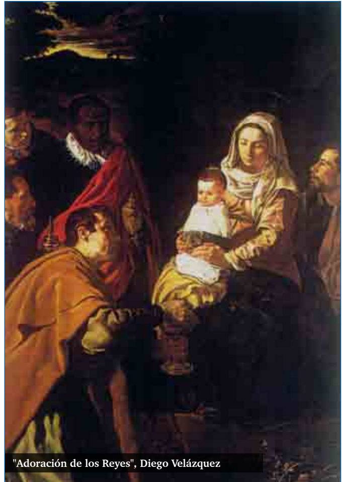
"Adoración de los Reyes", Diego Velázquez