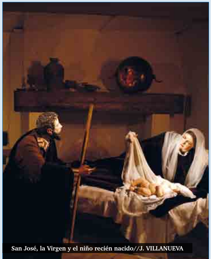
San José, la Virgen y el niño recién nacido//J. VILLANUEVA