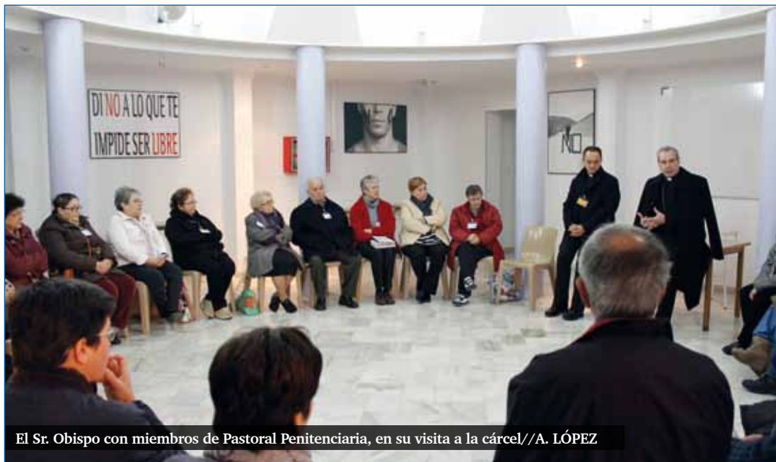
El Sr. Obispo con miembros de Pastoral Penitenciaria, en su visita a la cárcel