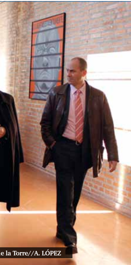
e la Torre//A. LÓPEZ