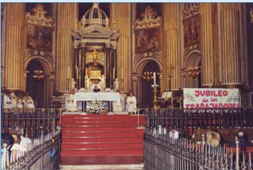
Eucaristía con motivo del Jubileo de los Trabajadores en la Catedral, año 2000