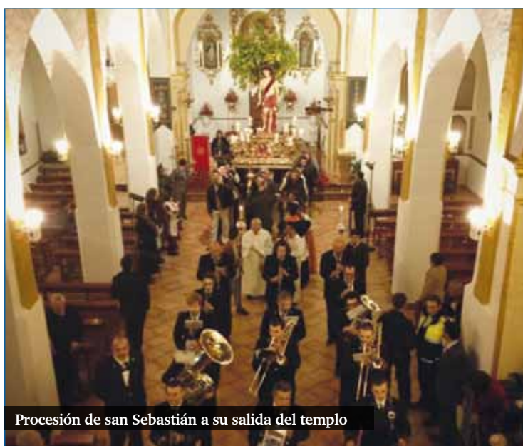
Procesión de san Sebastián a su salida del templo