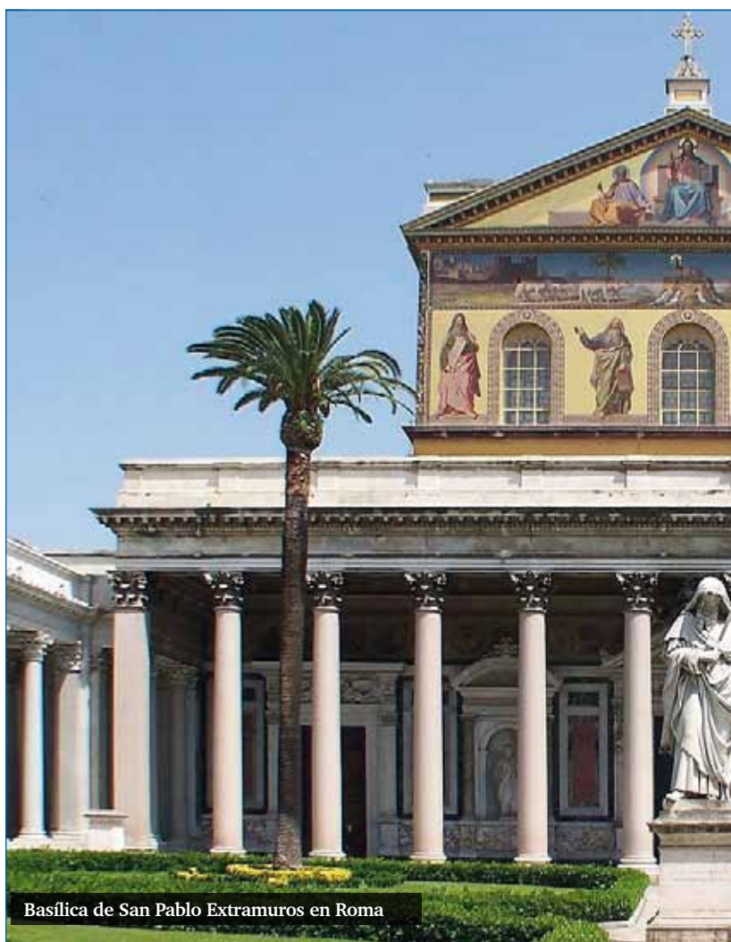
Basilica de San Pablo Extramuros en Roma

Además de esta distinción, más modernamente se establece una diferencia entre cartas protopaulinas y deuteropaulinas. Las primeras habrían sido escritas indudablemente por el Apóstol, que por lo general recurría a un amanuense o secretario; este grupo lo formarían 1 Tesalonicenses, el escrito más antiguo de todo el Nuevo Testamento y de la literatura cristiana en general, 1 y 2 Corintios, Filipenses, Gálatas, Romanos y Filemón, que Pablo habría compuesto más o menos en este orden. Por lo que respecta a las cartas deuteropaulinas, las diferencias que presentan frente a las protopaulinas inclinan a pensar que fueron compuestas en fecha más tardía y con una intervención mayor del correspondiente amanuense o incluso de algún discípulo de Pablo. En este segundo grupo se incluyen Colosenses y Efesios, por un lado, y las cartas pastorales, por otro. Un caso especial lo constituye 2 Tesalonicenses, que, aunque vinculada estrechamente a 1 Tesalonicenses por estar dirigida a la misma comunidad, parece haber sido compuesta bastante más tarde.