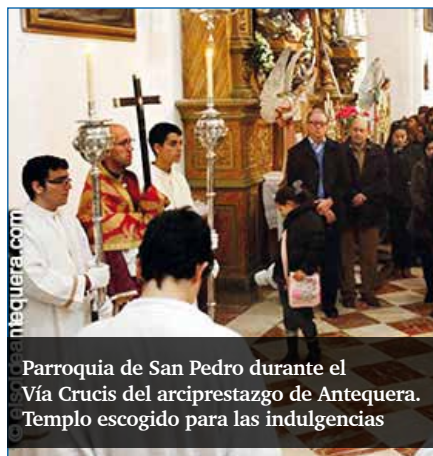
Parroquia de San Pedro durante el Vía Crucis del arciprestazgo de Antequera. Templo escogido para las indulgencias

Con motivo del Año de la fe, las parroquias y lugares de culto de la diócesis celebran este fin de semana un Vía Crucis simultáneo. Es una de las propuestas del Sr. Obispo como celebración complementaria a las prioridades pastorales. Otras propuestas son una adoración eucarística en fecha cercana a la solemnidad del Corpus y unas vísperas hacia el final del Año de la fe. El objetivo es que se lleven a cabo en la misma fecha en todas las comunidades cristianas, para que «toda la iglesia diocesana esté celebrando el mismo acto, al igual que un solo corazón late armónicamente para todo el cuerpo. Es una hermosa manera de sentirnos y de expresarnos como iglesia particular», afirma D. Jesús Catalá en la carta que ha enviado a todos los sacerdotes. Para el Vía Crucis se ofrece el texto que se leyó en el Coliseo, en 2005, cuyo autor fue el entonces cardenal Joseph Ratzinger.