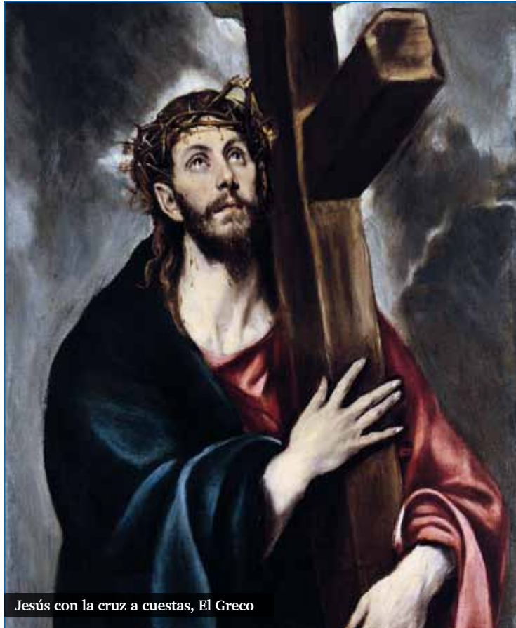
Jesús con la cruz a cuestas, El Greco

Ha llegado el momento de recuperar ese proyecto del reino de Dios en nuestras comuni-