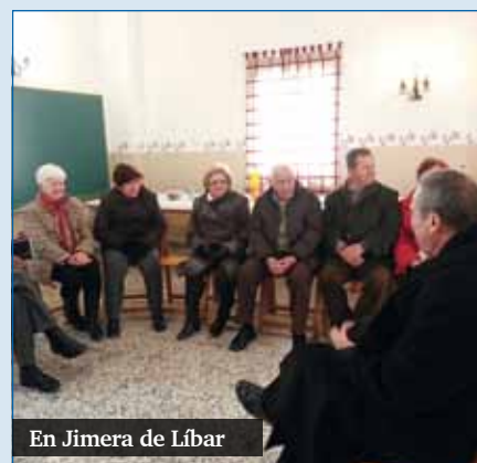
En Jimera de Líbar