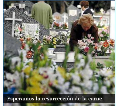
Esperamos la resurrección de la carne

«El término "carne" designa al hombre en su condición de debilidad y de mortalidad. La "resurrección de la carne" significa que, después de la muerte, no habrá solamente vida del alma inmortal, sino que también nuestros "cuerpos mortales" volverán a tener vida; pero "transfigurados en cuerpo de gloria", en "cuerpos espirituales" (1Co 15, 44)". Creer en la resurrección de los muertos ha sido desde sus comienzos un elemento esencial de la fe cristiana. Como señala Tertuliano, "la resurrección de los muertos es esperanza de los cristianos; somos cristianos por creer en ella". La muerte es el fin de la peregrinación terrena del hombre, del tiempo de gracia y de misericordia que Dios le ofrece para realizar su vida terrena según el designio divino y para decidir su último destino. Cuando ha tenido fin "el único curso de nuestra vida terrena" ya no volveremos a otras vidas terrenas. El Catecismo es muy claro en este punto ante la confusión provocada muchas veces por el cine y la literatura y afirma rotundo: «No hay "reencarnación" después de la muerte».