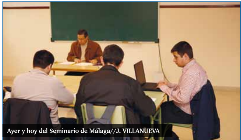
Ayer y hoy del Seminario de Málaga//J. VILLANUEVA