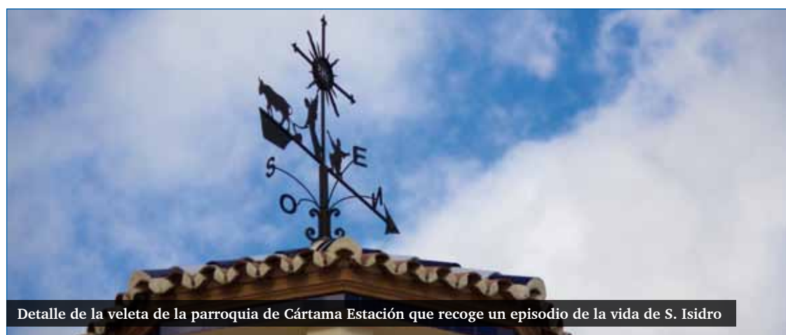
Detalle de la veleta de la parroquia de Cártama Estación que recoge un episodio de la vida de S. Isidro

Este año, al igual que en años anteriores, las fiestas patronales comienzan el domingo previo, 12 de mayo, con la celebración de la Palabra, el tradicional besapies y la ofrenda floral, ya que los habitantes del pueblo tienen la costumbre de ofrecer flores a la imagen de san Isidro, con las que posteriormente se adornarán el trono y la iglesia. El miércoles, 15 de mayo, a las 11.00 horas, tendrá lugar la misa en honor del patrón de los labradores y posteriormente el traslado de santa María de la Cabeza hasta el centro del pueblo, para su posterior reen-