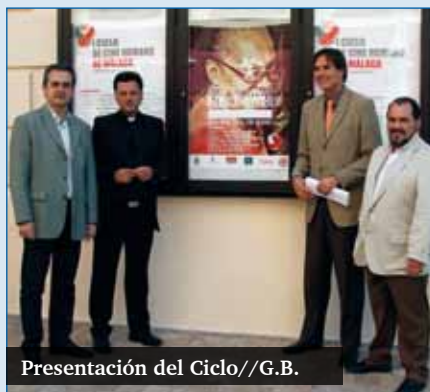
Presentación del Ciclo//G.B.