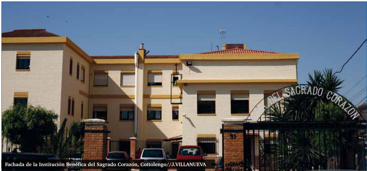
Fachada de la Institución Benéfica del Sagrado Corazón, Cottolengo