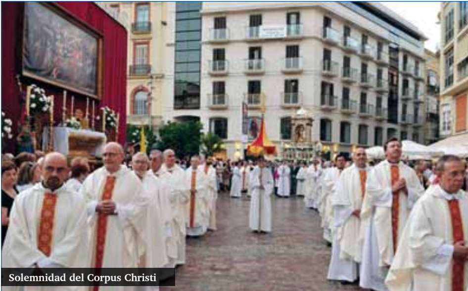
Solemnidad del Corpus Christi

El próximo domingo celebramos la Solemnidad del Corpus Christi, que este año cambia de horario. La Eucaristía tendrá lugar por la mañana, a las 11.30 horas, y la procesión por la tarde, a las 19.00.