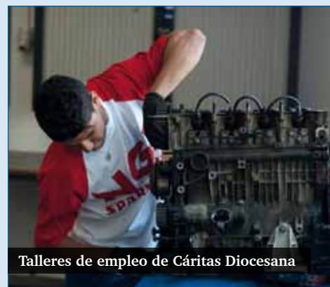
Talleres de empleo de Cáritas Diocesana

Además, en los últimos años, del dinero de la X del IRPF, la Conferencia Episcopal Española ha donado a Cáritas un total de 19,8 millones de euros. La cantidad se ha ido incrementando en los últimos cuatro años (2008-2012). En 2011 se donaron cinco millones de euros y en 2012, seis millones.