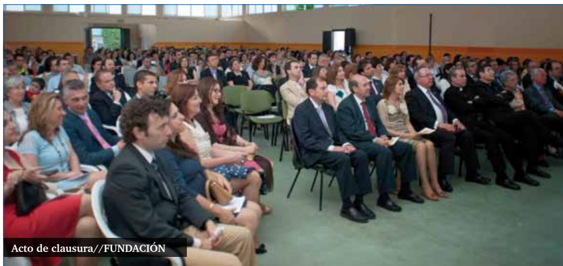
Acto de clausura/FUNDACIÓN