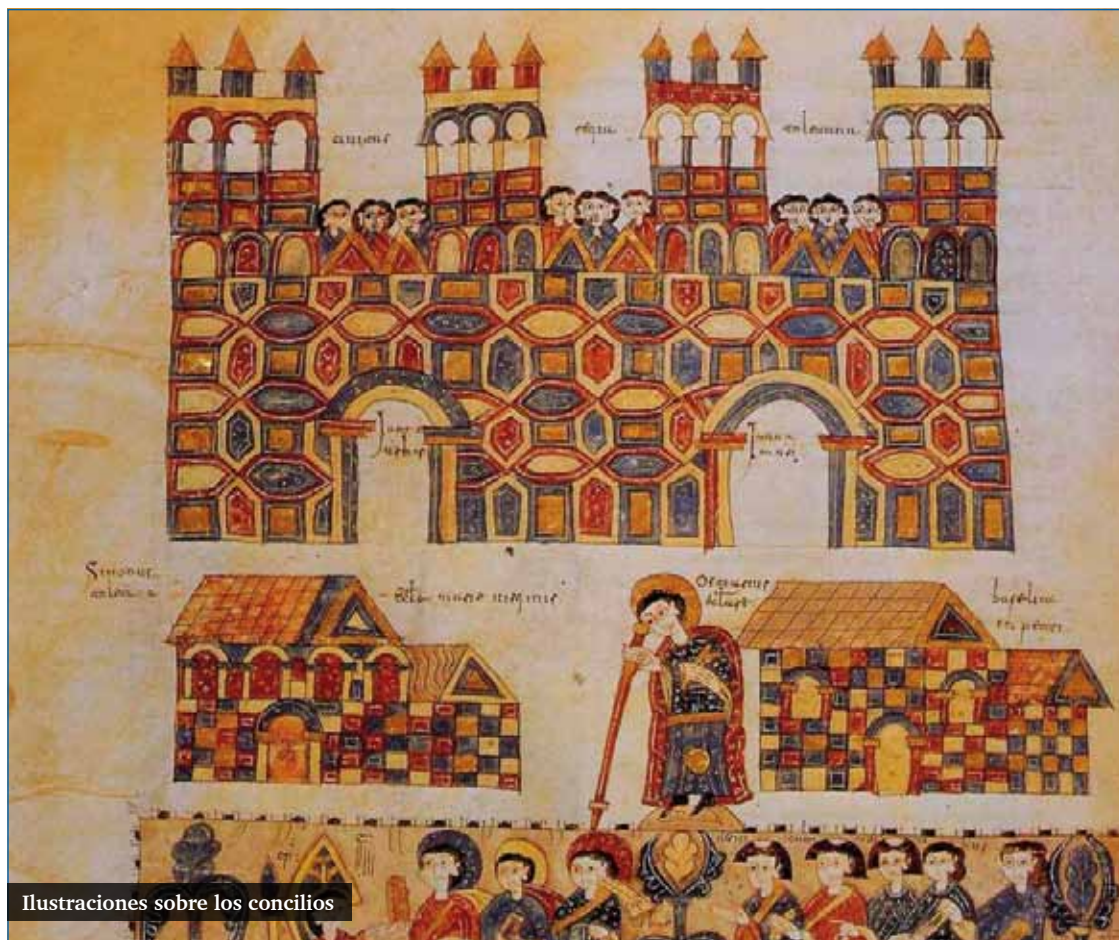
Ilustraciones sobre los concilios

Los monofisistas, amparados por el patriarca de Alejandría Dióscoro y por el emperador Teodosio II, consiguen la convocatoria de un Sínodo. Éste se celebró en Éfeso (449). Invitaron al papa, que envió dos legados.