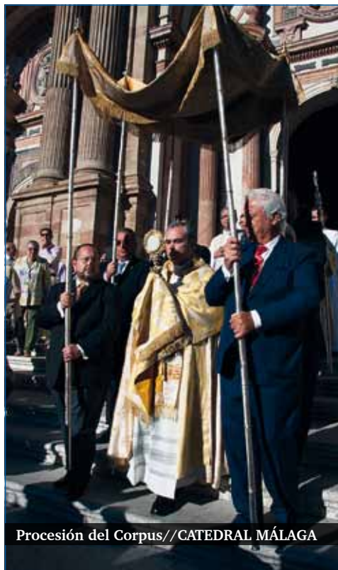
Procesión del Corpus//CATEDRAL MÁLAGA

La eucaristía es misterio y acontecimiento, que exige el obsequio de la fe. En ella se nos ofrece el beneficio de la redención y de la santificación. La eucaristía es la prueba del