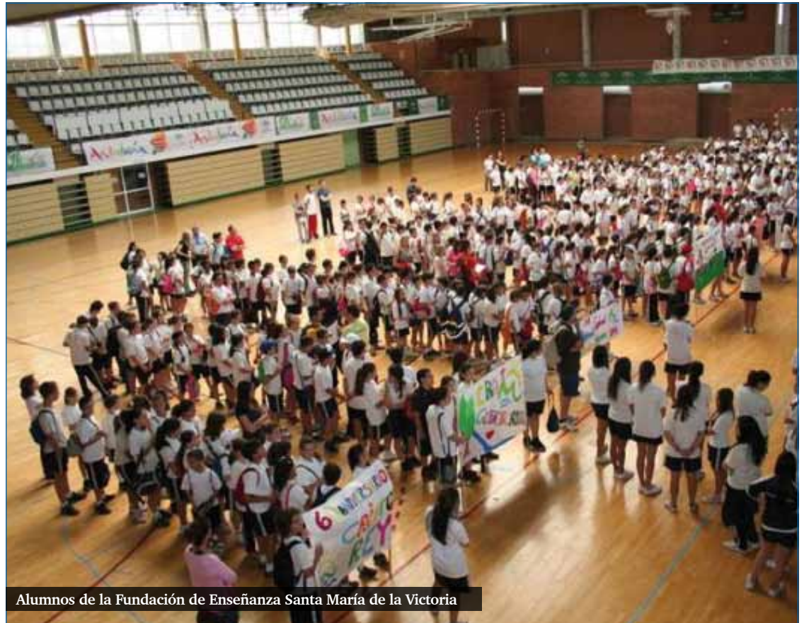
Alumnos de la Fundación de Enseñanza Santa María de la Victoria

3 El proyecto de Ley recoge los Acuerdos Iglesia - Estado en el tema de enseñanza, acuerdos reconocidos por todos los gobiernos de España desde el inicio de la democracia: UCD, PSOE y PP. A veces sorprende que políticos que han estado go-