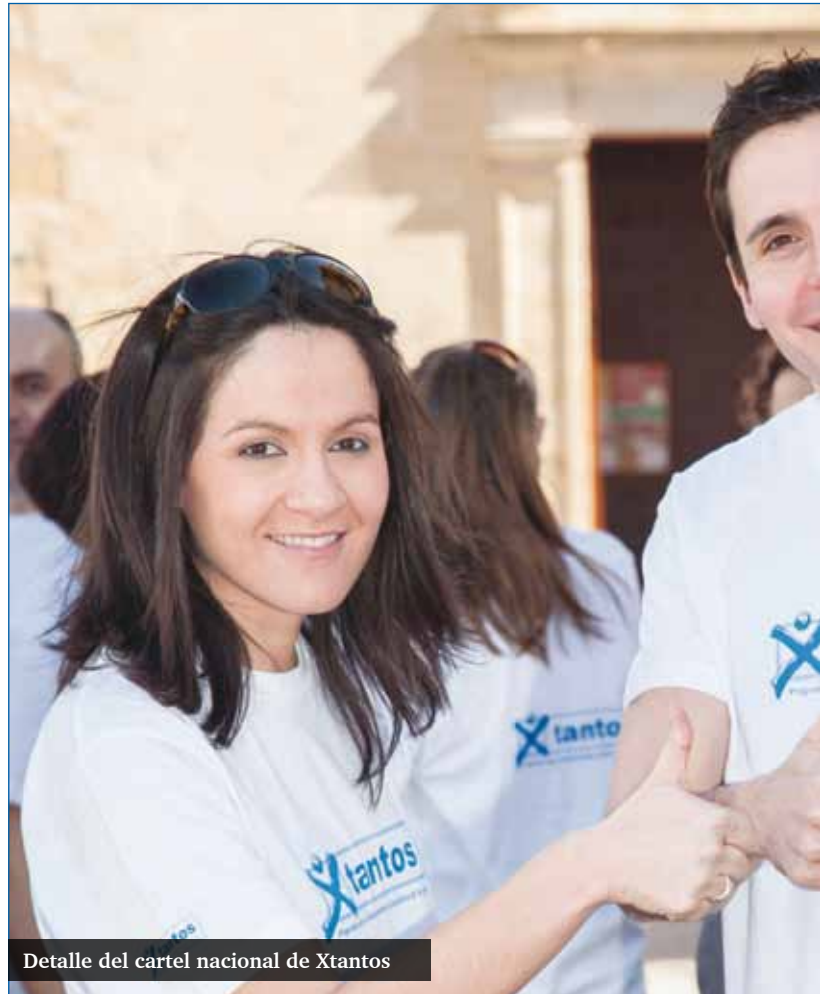
Detalle del cartel nacional de Xtantos

La campaña Xtantos vuelve a salir a la calle este año. Durante el mes de junio se ha instalado una mesa informativa en la puerta de la Delegación Provincial de Hacienda, en la Avenida de Andalucía de la capital malagueña, desde la que se repartirá diverso material a los viandantes. Son muchos los ciudadanos que acuden a esta sede a confeccionar su declaración y es el momento de recordarles la posibilidad de marcar la casilla de la Iglesia para ayudar a tantos que necesitan tanto, así como la de otros fines sociales.