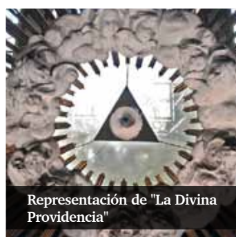
Representación de "La Divina Providencia"