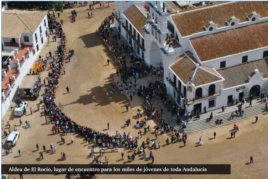
Aldea de El Rocío, lugar de encuentro para los miles de jóvenes de toda Andalucía