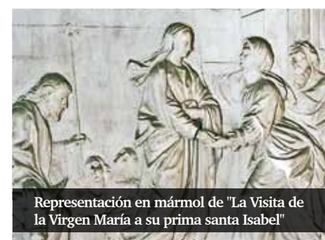
Representación en mármol de "La Visita de la Virgen María a su prima santa Isabel"