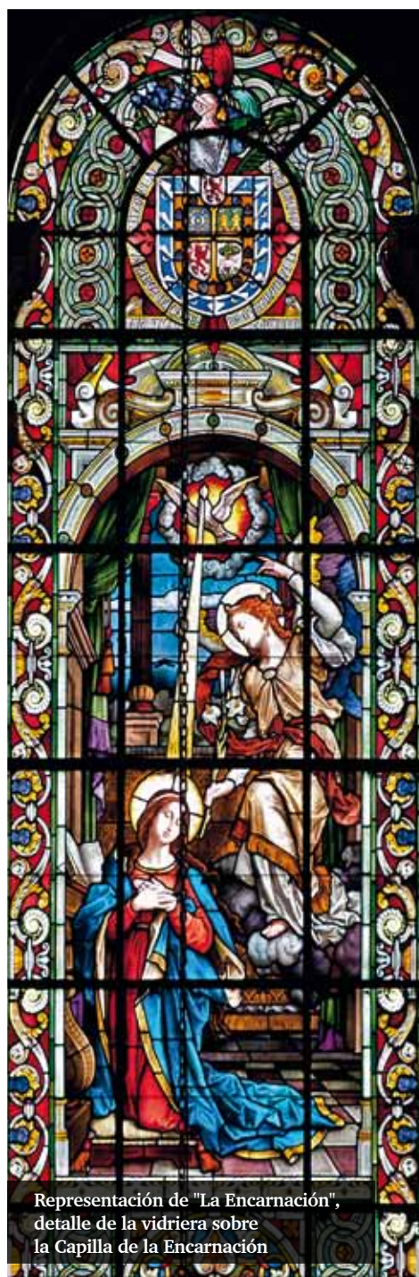
Representación de "La Encarnación", detalle de la vidriera sobre la Capilla de la Encarnación