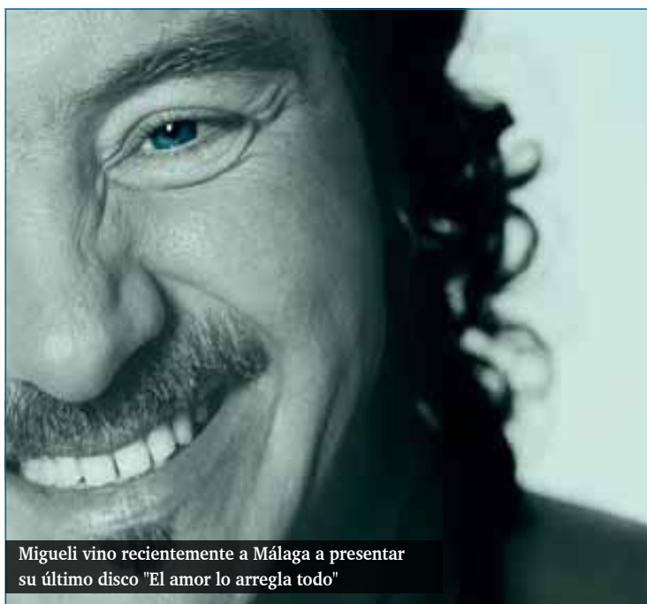
Migueli vino recientemente a Málaga a presentar su último disco "El amor lo arregla todo"

–Tiene usted una discografía amplia, ¿en qué proyecto está sumergido?