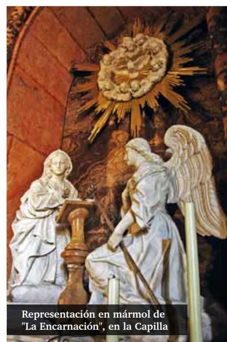
Representación en mármol de "La Encarnación", en la Capilla