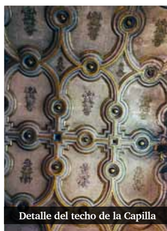
Detalle del techo de la Capilla