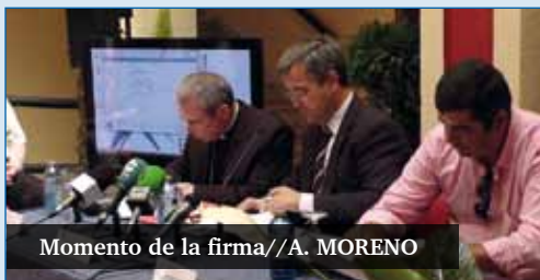
Momento de la firma

El Sr. Obispo ha firmado el convenio que permitirá la apertura del nuevo colegio Juan XXIII en Estepona. Se trata de un acuerdo entre la Fundación