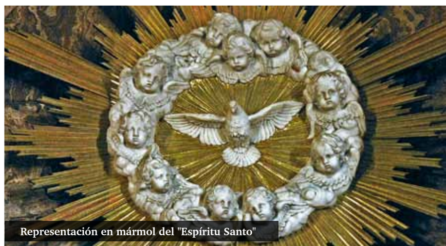
Representación en mármol del "Espíritu Santo"