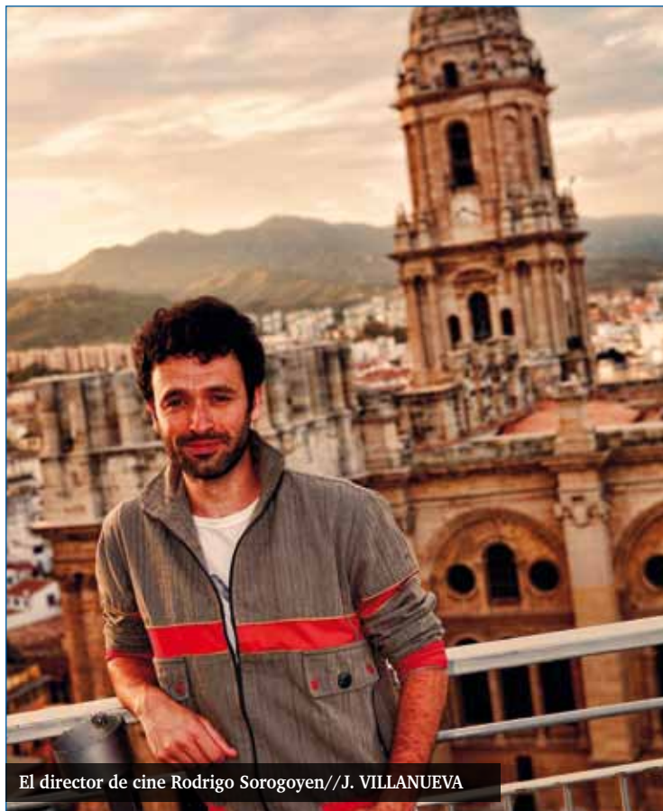
El director de cine Rodrigo Sorogoyen

—El drama es mayor si son jóvenes, todo adquiere otra dimensión. Queríamos mostrar cómo se relacionan los jóvenes en la actualidad. Estamos hablando de una generación de 20 a 40. Hoy sufrimos una juventud totalmente alargada, para bien y para mal, pero es que eres joven hasta los 40 años: puedes seguir haciendo el gandul, salir de copas y no te planteas crear una familia que es cuando se supone que dejas de ser joven. La película habla sobre las relaciones interpersonales y de cómo están cambiando. La sociedad está tomando una dirección hacia un individualismo y hacia un egoísmo muy bestia. Y eso, donde más repercute es en los jóvenes que están viviéndolo de nuevas. Y somos responsables tanto la sociedad que nos lo mete en la cabeza como cada uno que actuamos así. Porque somos muy egoístas, muy individualistas y es muy fácil no pensar en la otra persona.