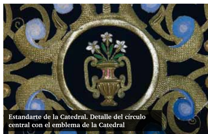
Estandarte de la Catedral. Detalle del círculo central con el emblema de la Catedral