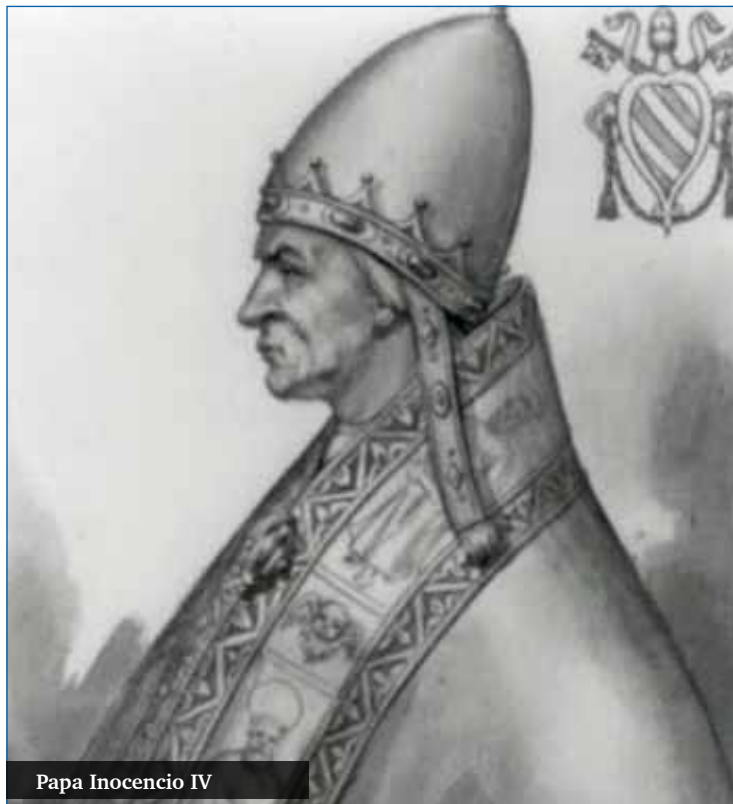
Papa Inocencio IV

Los atropellos contra la Iglesia promovidos por el emperador aumentaron: incautación de los bienes de los monasterios, encarcelamiento y muerte a sacerdotes, destrucción e incendio de templos, procesos a presuntos herejes con penas de muerte. Razón por la cual Gregorio IX organizó la Inquisición episcopal y papal como medida para evitar los abusos imperiales. Fueron diez años de atropellos contra la Iglesia. El Papa mandó predicar una especie de cruzada moral contra Federico II.