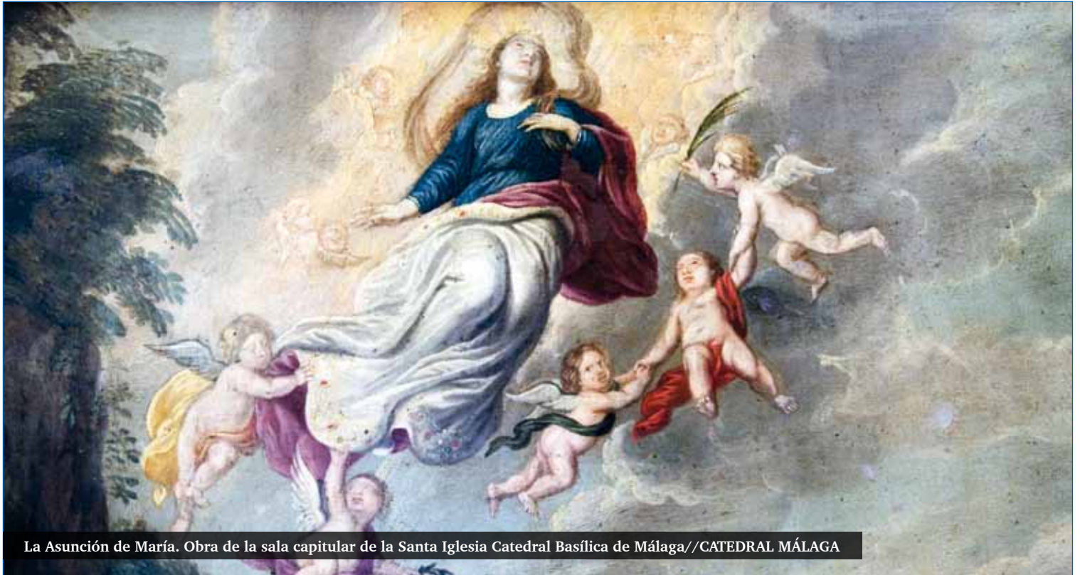
La Asunción de María. Obra de la sala capitular de la Santa Iglesia Catedral Basílica de Málaga