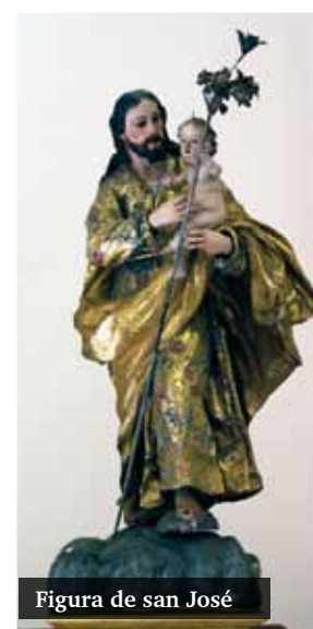
Figura de san José