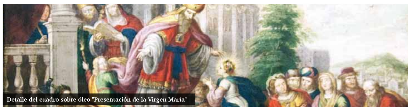
Detalle del cuadro sobre óleo "Presentación de la Virgen María"