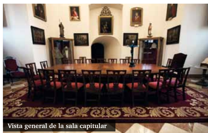
Vista general de la sala capitular