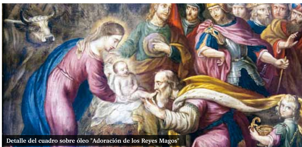
Detalle del cuadro sobre óleo "Adoración de los Reyes Magos"