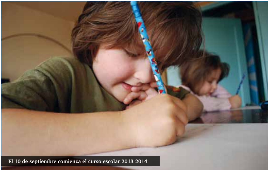
El 10 de septiembre comienza el curso escolar 2013-2014