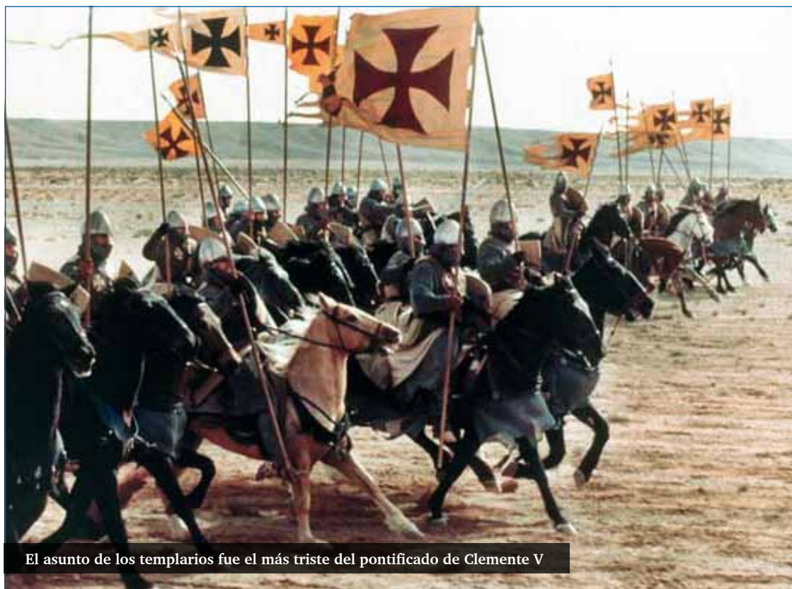
El asunto de los templarios fue el más triste del pontificado de Clemente V

A instancias de Felipe IV, se celebró un juicio en Poitiers