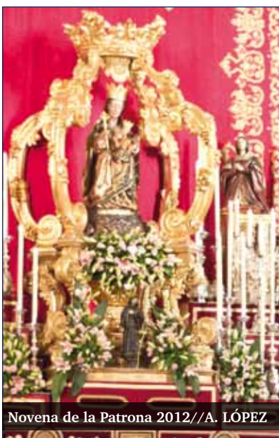
Novena de la Patrona 2012

A las 21.15 horas se reunirán los responsables de Pastoral Familiar, agentes de pastoral y personas comprometidas con este servicio para compartir un tiempo de convivencia, en la sede de la cofradía del Santo Sepulcro, en calle Alcazabilla.