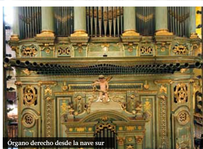
Órgano derecho desde la nave sur