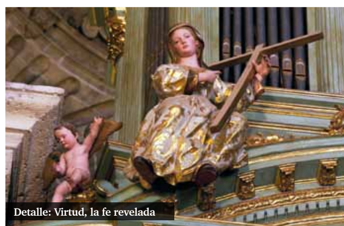
Detalle: Virtud, la fe revelada