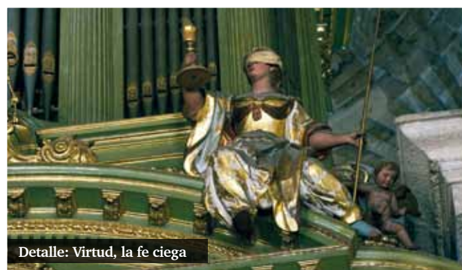
Detalle: Virtud, la fe ciega