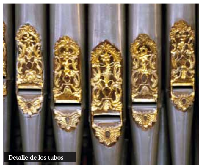
Detalle de los tubos