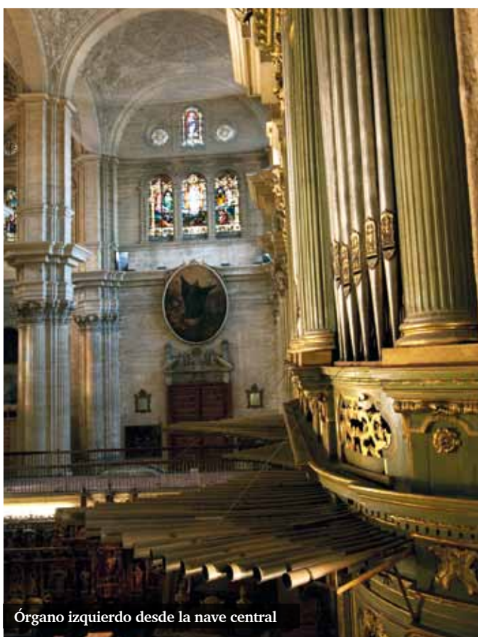
Órgano izquierdo desde la nave central