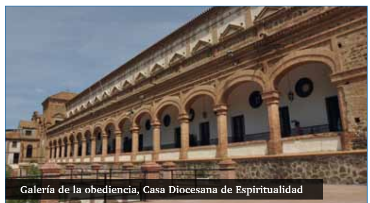
Galería de la obediencia, Casa Diocesana de Espiritualidad