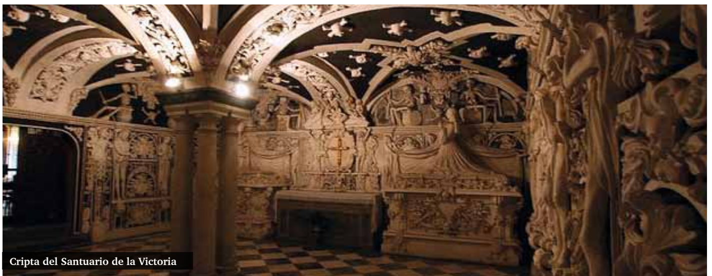
Cripta del Santuario de la Victoria