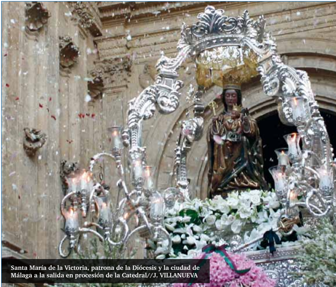
Santa María de la Victoria, patrona de la Diócesis y la ciudad de Málaga a la salida en procesión de la Catedral