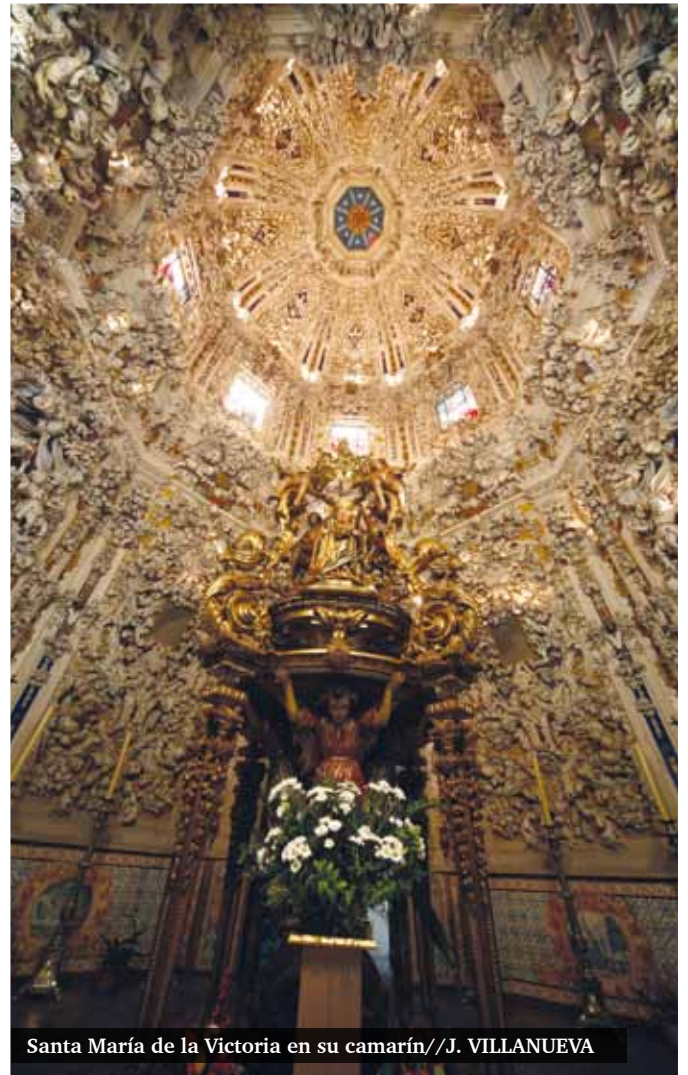
Santa María de la Victoria en su camarín//J. VILLANUEVA

Para saber más, santamariadelavictoria.blogspot.com.es