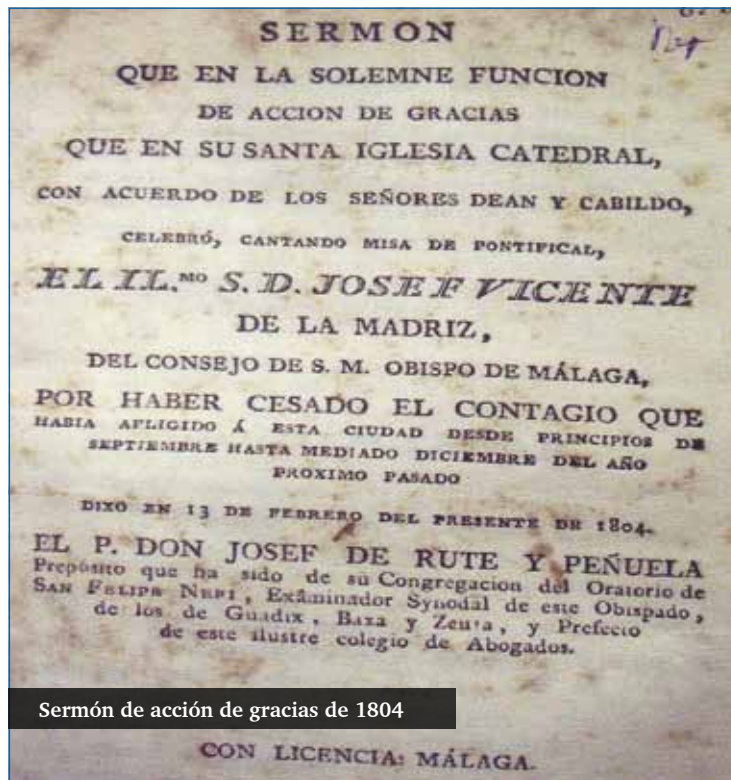
Sermón de acción de gracias de 1804

Es a partir de este momento cuando la presencia de la Virgen se erige como recurso de la ciudad ante cualquier coyuntura adversa. Y el pueblo sabía agradecerle su amparo ante estas inclemencias. Entre ellas la que tuvo lugar ante una oleada de peste bubónica en octubre de 1678, cuando un mes después de declararse oficialmente el contagio, 176 convalecientes