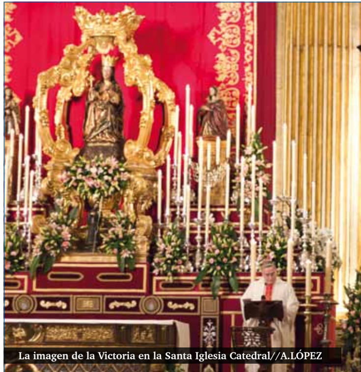
La imagen de la Victoria en la Santa Iglesia Catedral

Este año nuestras fiestas Patronales vienen enmarcadas por el “Año de la fe”, es un deseo profundo que quisiera contribuir a una renovada conversión al Señor fuente de salvación y vida para la humanidad sedienta de felicidad. “Caritas Chisti urget nos” (2 Cor 5,14): es el amor de Cristo el que llena nuestros corazones y nos impulsa a evangelizar. Hoy como ayer, Él nos envía por los caminos del mundo para proclamar su Evangelio a todos