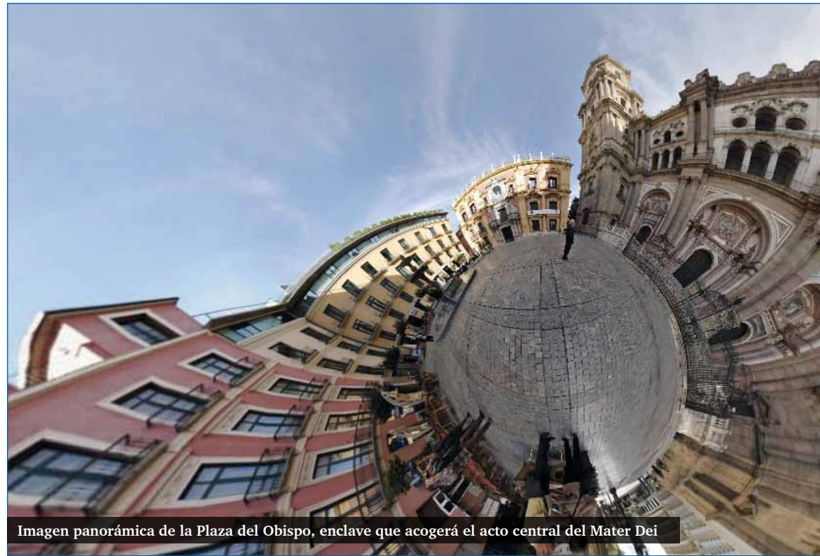
Imagen panorámica de la Plaza del Obispo, enclave que acogerá el acto central del Mater Dei