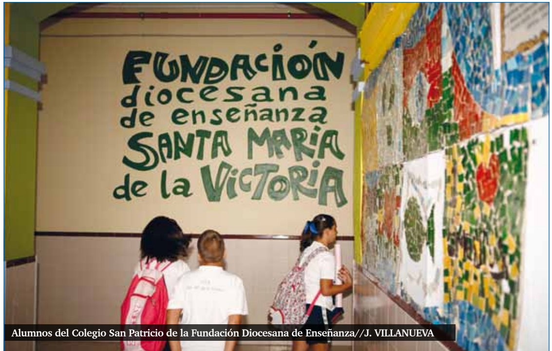
Alumnos del Colegio San Patricio de la Fundación Diocesana de Enseñanza

Amor que perdona. Perdón sin límites, hasta "setenta veces siete" nos recuerda el Maestro a los que como Pedro nos cansamos de