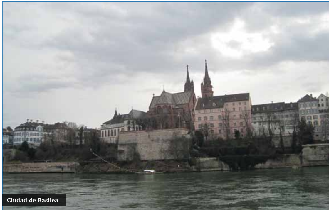
Ciudad de Basilea

Los objetivos propuestos en Basilea fueron: la eliminación de