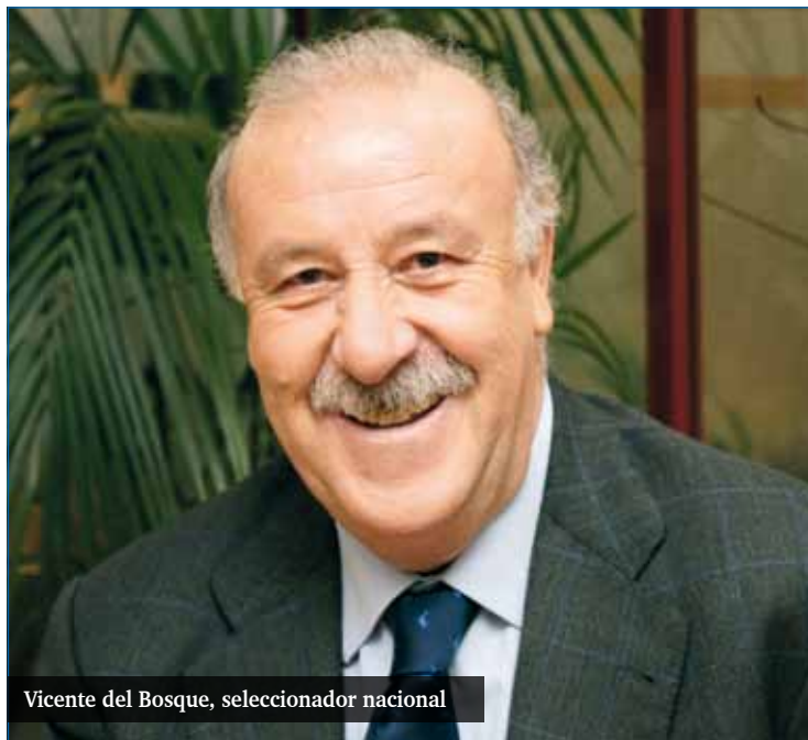
Vicente del Bosque, seleccionador nacional

—He pasado por distintas circunstancias y el apoyo principal de los que están más cerca es fundamental. Eso si, soy consciente de que he estado en sitios donde el éxito lo he tenido cerca. Pero no debemos olvidar que esto es un deporte y que otros pueden estar más fuertes que tú. Hay que estar preparado para la derrota y en esos momentos de más dificultad o de tristeza, naturalmente, es el apoyo de mi familia lo que más me ha ayudado.