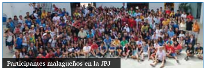
Participantes malagueños en la JPJ

Para más información pueden llamar al 952303876.