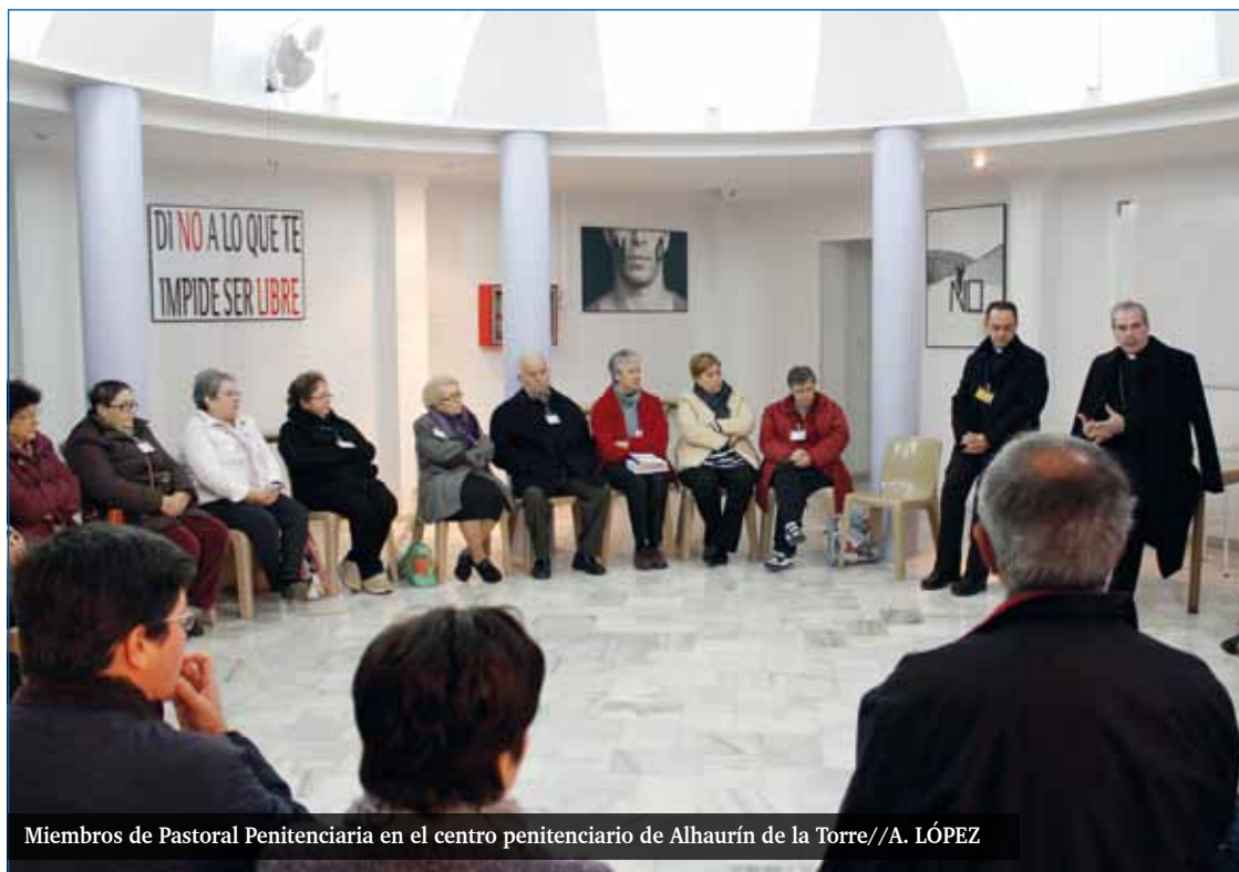
Miembros de Pastoral Penitenciaria en el centro penitenciario de Alhaurín de la Torre

Para el nuevo capellán, esta fiesta es muy especial para todo el personal que forma parte del centro penitenciario «pero fundamentalmente es la patrona de los presos, aunque también es la patrona de los funcionarios. Es un día especial en el que se les invita a tomar conciencia del significado de tener a María como patrona. La cárcel es un lugar donde faltan los sentimientos o se desbordan. El sentimiento religioso de acogida y de cercanía del Padre Dios y de la Madre María son algo mucho más fuerte que un sentimiento». Fray Andrés celebra la Eucaristía con