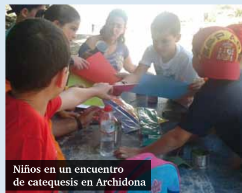
Niños en un encuentro de catequesis en Archidona

Toda la información está disponible en diocesismalaga.es