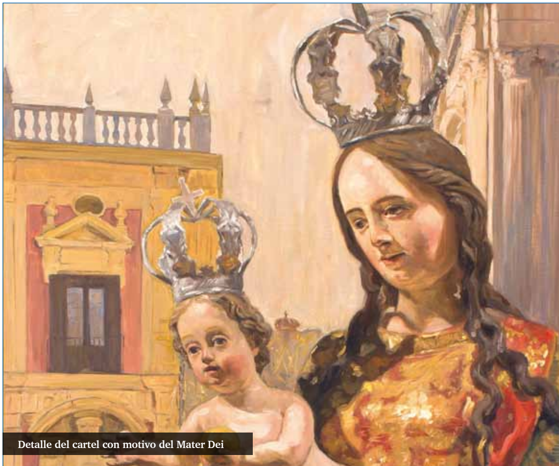
Detalle del cartel con motivo del Mater Dei