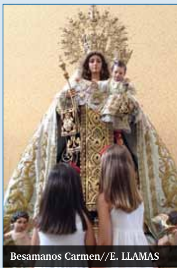
Besamanos Carmen

La mayoría de las imágenes marianas, de pasión y de gloria, estuvieron en besamanos durante todo el día 27 y la mañana del 28 de septiembre. Era la primera vez en la historia de la Agrupación de Cofradías de Semana Santa de Málaga que se invitaba a participar en un acto propio a las hermandades de penitencia no agrupadas y a las de Gloria. La ocasión no fue desperdiciada y por todos los barrios de Málaga podían verse ríos de devotos que se acercaban a los templos para ver de cerca a la Virgen y poder susurrarle, en la cercanía de ese encuentro, una oración, una petición o una acción de gracias.