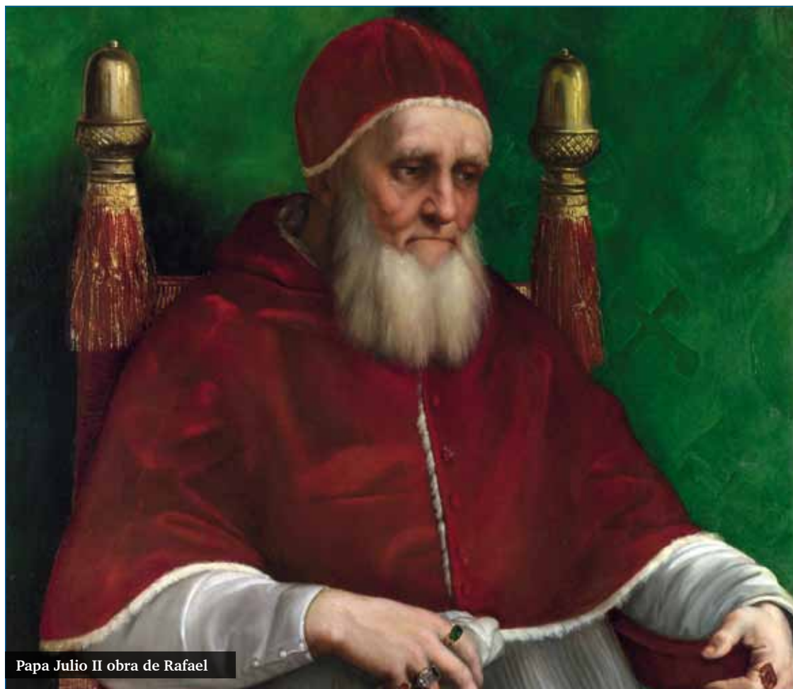
Papa Julio II obra de Rafael

Durante el pontificado de Julio II se celebraron cinco se-