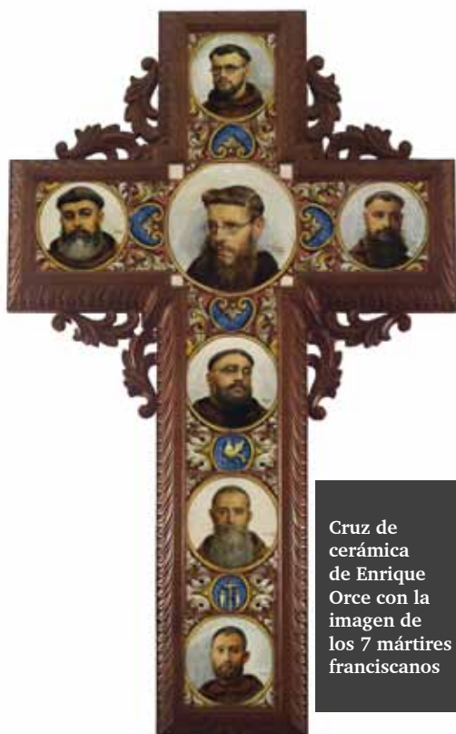
Cruz de cerámica de Enrique Orce con la imagen de los 7 mártires franciscanos