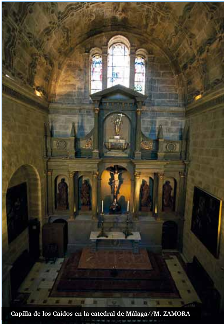
Capilla de los Caídos en la catedral de Málaga