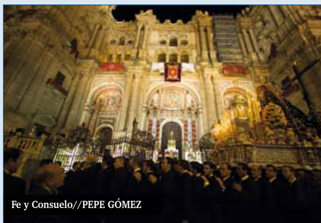
Fe y Consuelo

La jornada del Mater Dei culminó con una cita histórica: siete imágenes de María salieron en procesión hasta la plaza del Obispo. En el atrio de la Catedral se ubicó un altar que estaba presidido por la imagen del Resucitado, titular de la Agrupación de Cofradías, que se encuentra en la Ca-