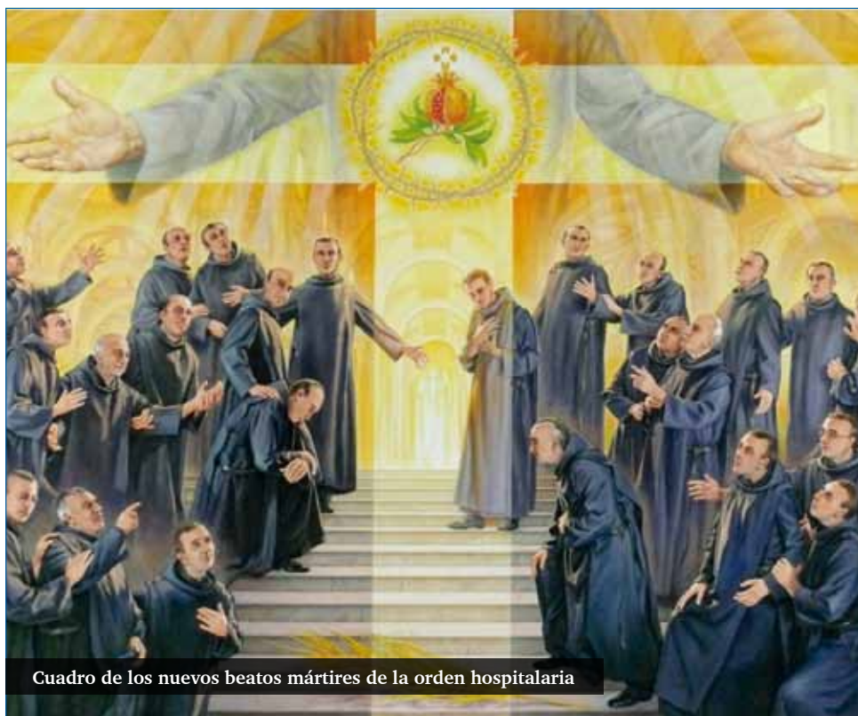
Cuadro de los nuevos beatos mártires de la orden hospitalaria

B. LAFUENTE/E. LLAMAS @beatrizlfuente @enllamasfortes