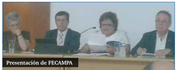
Presentación de FECAMPA