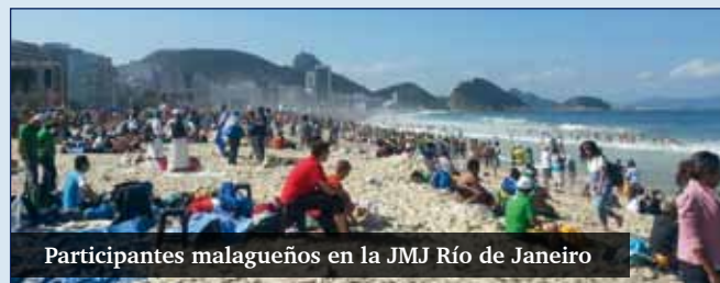
Participantes malagueños en la JMJ Río de Janeiro

La Delegación de Juventud convoca a la "Fiesta y vigilia de la fe", que tendrá lugar el 19 de octubre, en la S.I. Catedral, a partir de las 20.00 horas. Se trata de una iniciativa con la que se invita a todos los jóvenes a dar testimonio público de la fe y a profundizar en el mensaje que el papa Francisco ha dado a los jóvenes en la JMJ Río de Janeiro.