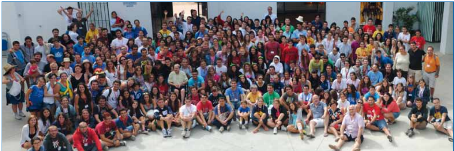
Malagueños participantes en la JPJ El Rocío, encuentro de las Diócesis andaluzas, en comunión con la JMJ Río de Janeiro