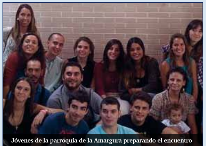
Jóvenes de la parroquia de la Amargura preparando el encuentro

✓ Para más información, pueden llamar al 619 646 826 o escribir un e-mail a juventud@diocesismalaga.es