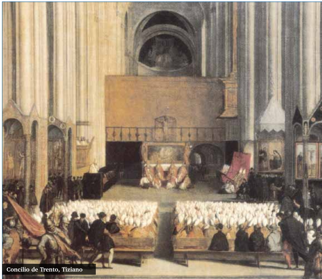
Concilio de Trento, Tiziano

Sostiene Lutero que la Iglesia es una comunidad de fieles es-