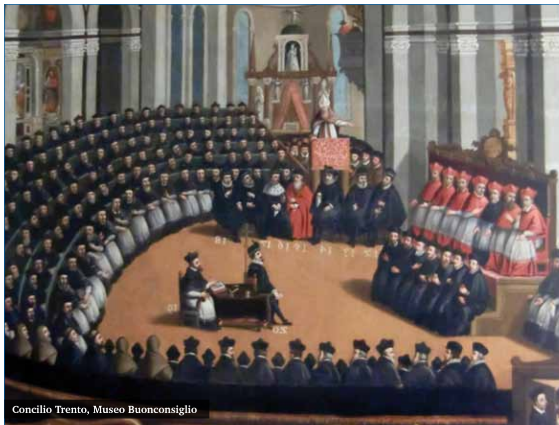
Concilio Trento, Museo Buonconsiglio

La sesión V precisa el sentido del pecado original, su transmisión por propagación a toda la descendencia de Adán, su perdón por el bautismo y expresamente se declara, contra los protestantes, que la concupiscencia no es pecado, aunque incline al pecado. En definitiva se rechaza el optimismo pelagiano que