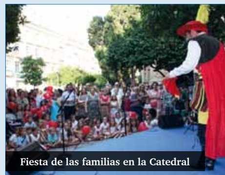
Fiesta de las familias en la Catedral

Están convocados todos los responsables de los cursos de preparación a la vida familiar y de los movimientos y asociaciones que trabajan con la familia en nuestra diócesis. El encuentro comenzará a las 10.30 horas, con la acogida y presentación del encuentro. A las 11.00, se presentará la tercera prioridad pastoral diocesana: iniciar la renovación de la pastoral familiar. A las 11.30 hablarán sobre los cursos de preparación a la vida familiar, exponiendo las experiencias de Marbella, la Axarquía y Málaga. Tras un tiempo de diálogo, informarán sobre las actividades propuestas por la Delegación de Pastoral Familiar: cursos de formación y Jornada de la familia.