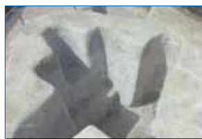
Pila bautismal, Vega del mar

La Fundación Lux Mundi está celebrando su 40 aniversario y dentro del calendario de actos organizados con este motivo, el próximo viernes, 25 de octubre, a las