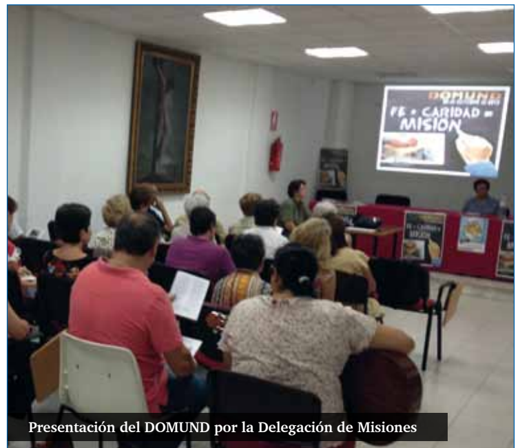
Presentación del DOMUND por la Delegación de Misiones

Según los datos de las Obras Misionales Pontificias, cada año parten de España cerca de 150 misioneros de las órdenes, congregaciones, institutos seculares, movimientos y asociaciones misioneras presentes en los territorios de misión. En la actualidad hay cerca de 13.000 misioneros españoles por todo el mundo, 227 misioneros españoles en países donde los cristianos son perseguidos. La Delegación Diocesana de Misiones presentó este año la campaña del DOMUND con el testimonio de tres de estos misioneros que ahora se encuentran en Málaga y que presentamos en este reportaje.